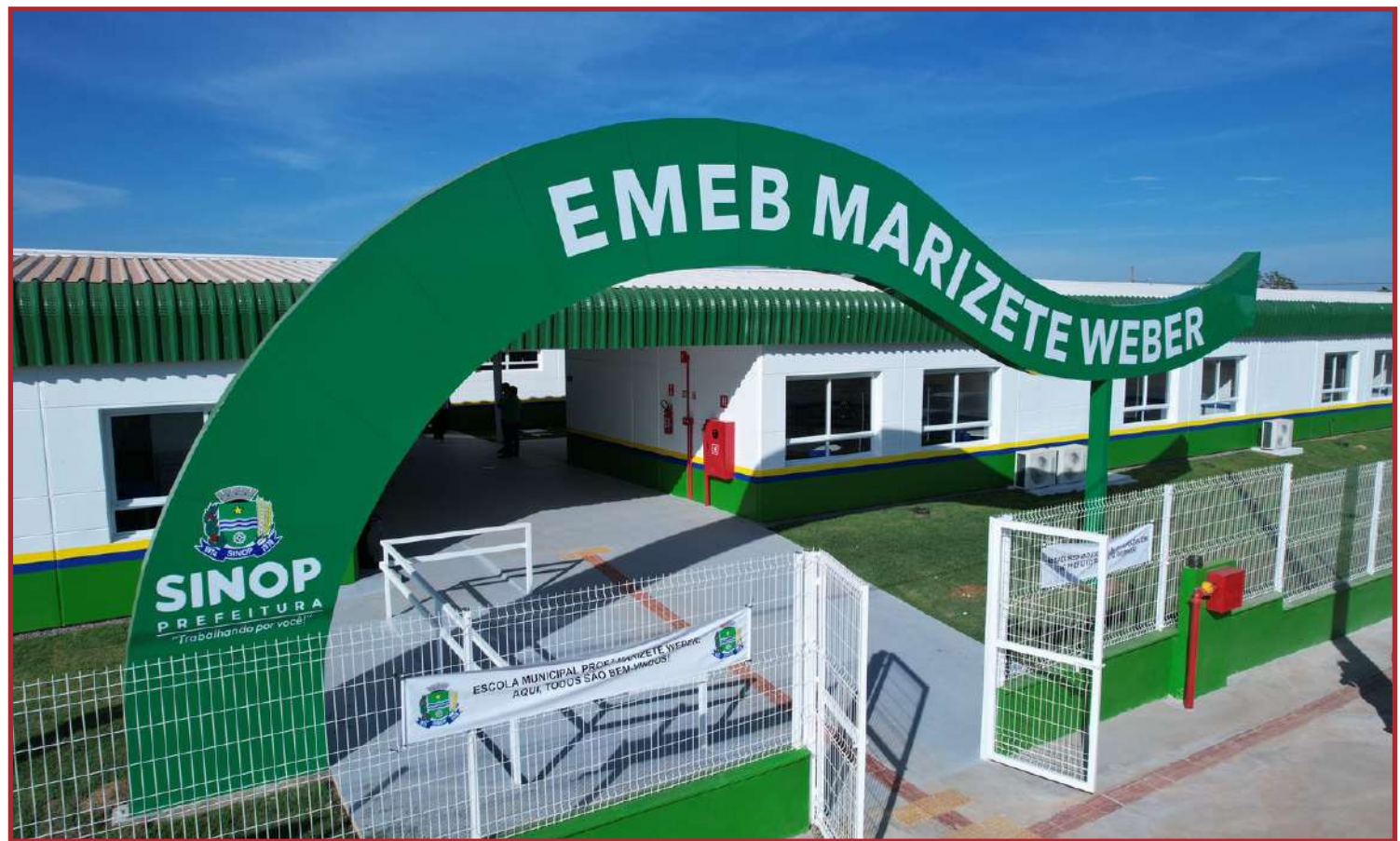
Escola vai atender 600 novos alunos