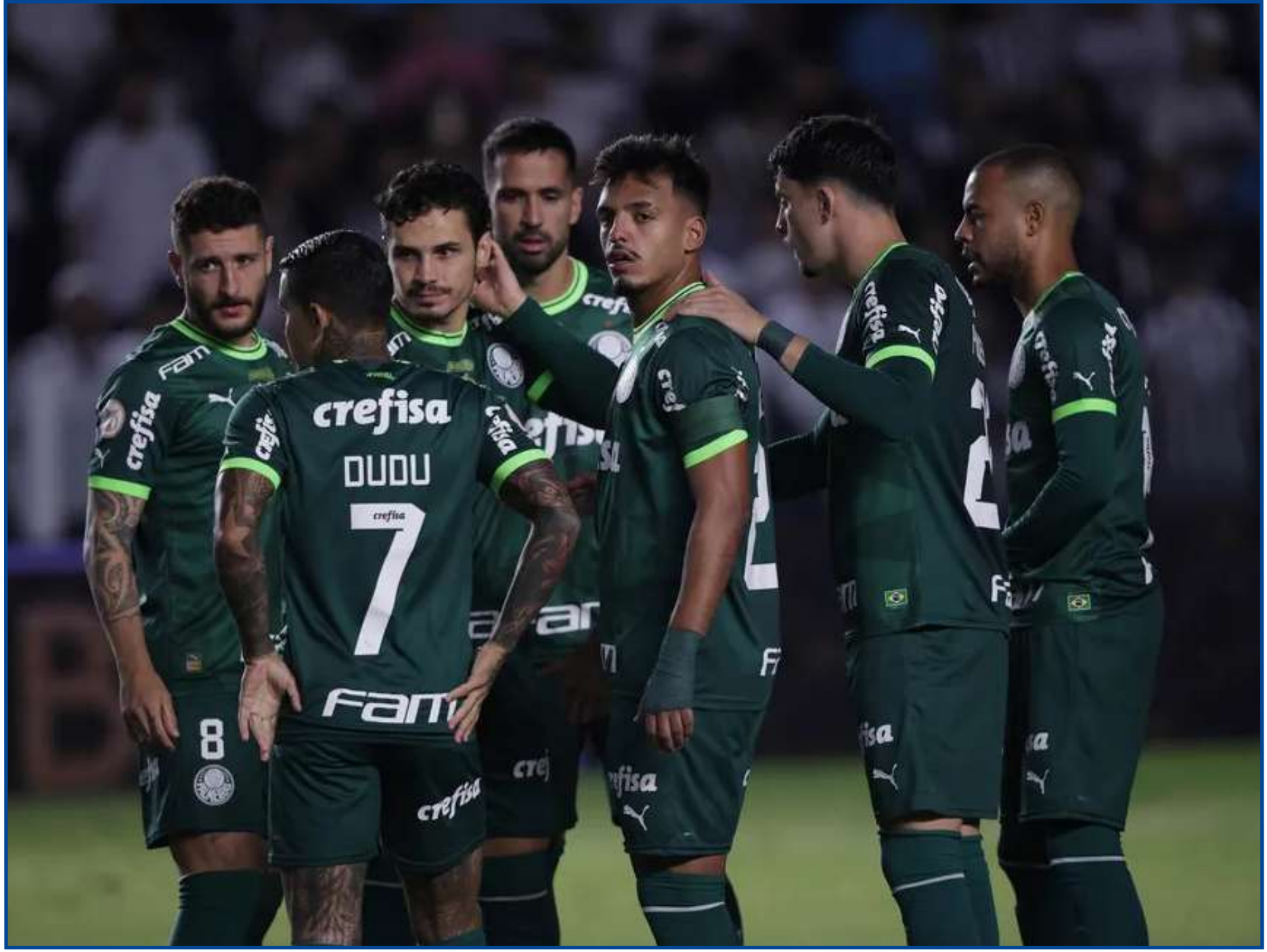
Jogadores do Palmeiras durante o clássico contra o Santos

"Precisamos ver o caso do Gustavo Gómez, temos a volta do Marcos Rocha, o Veiga com alguns problemas, o próprio Rony. Mas com três dias vamos driblar estas limitações. Temos opções, o Jailson, Jhonatan, Garcia... mas com três dias vamos estar em 100% e preparados para vencer o jogo", acrescentou. Enquanto ainda não há