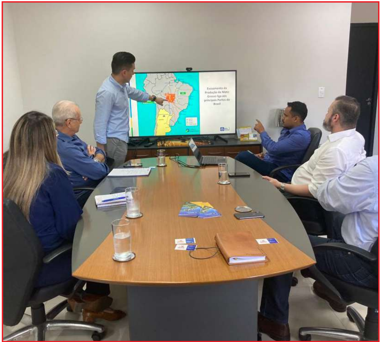
Mato Grosso ainda não cultiva a cultura

A Moinho Anaconda tem capacidade de processar 400 mil toneladas/ano na planta paranaense. Além disso, é uma empresa familiar com capital 100% nacional e com 490 funcionários nas duas unidades.