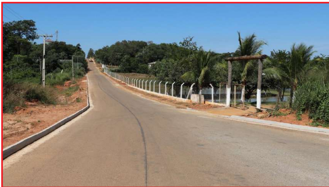
Prefeitura finaliza a empreitada, que contou com apoio de moradores e empresários do bairro

Outra parceria importante para evitar que, durante o período das chuvas mais intensas, a água fique empocada foi a Concessionária Rota do Oeste, que implantou um canal de drenagem na travessia urbana da BR-163, evitando as-