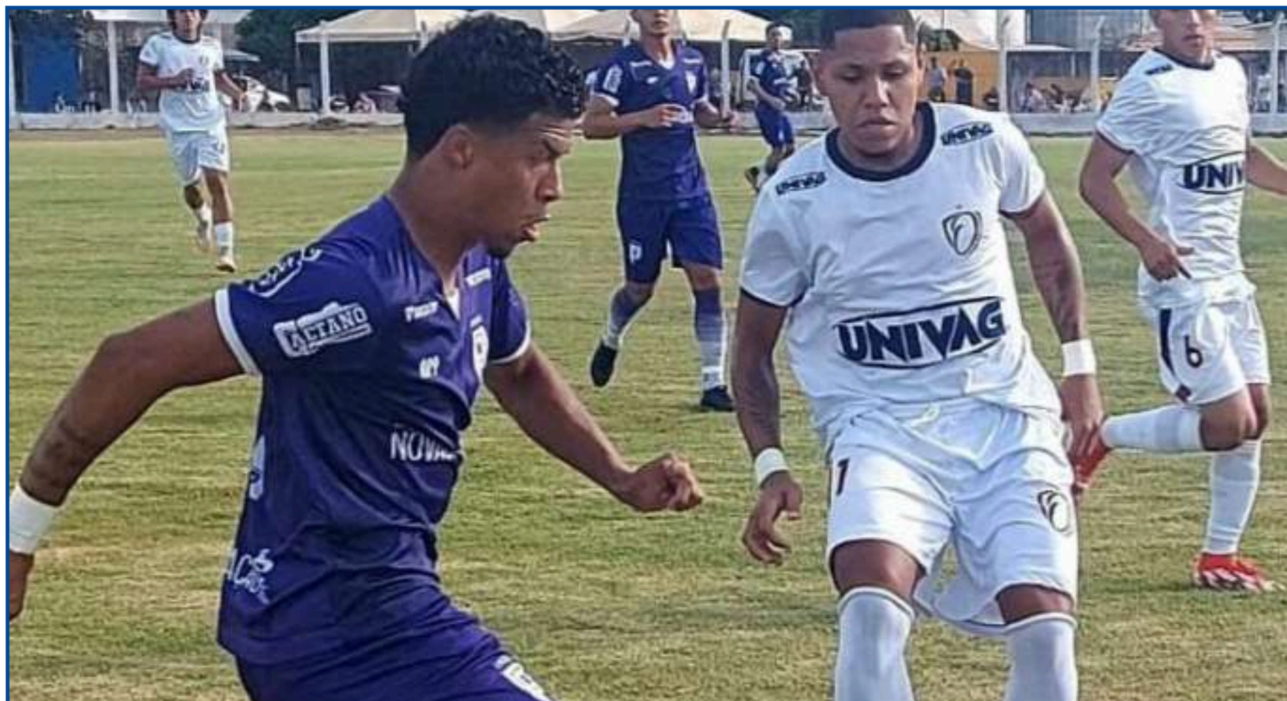
Primavera fez 4 a 1 no Operário, em confronto direto

O Tricolor juntou-se a Açã e Poconé já eliminados. Inclusive, a partida entre ambos, que seria realizada no domingo, foi cancelada, conforme a equipe do Diário do Estado MT buscou informações. Não há confirmação do resultado e os sites apontam como jogo cancelado.