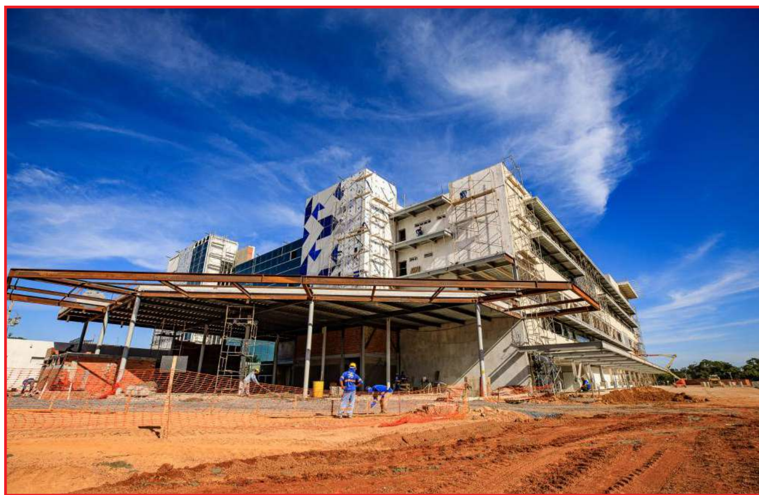
Previsão é de que a construção seja concluída ainda em 2023