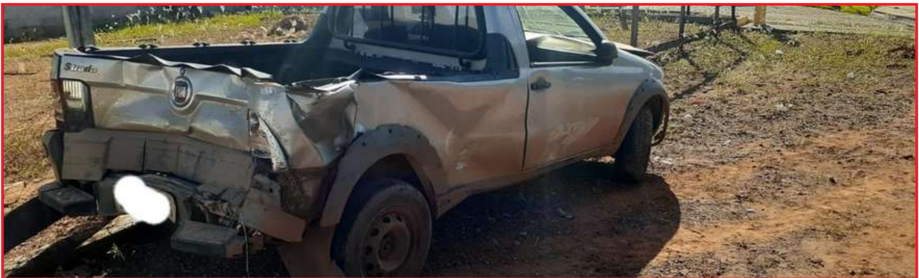
Homem ainda bateu na Strada do proprietário do da distribuidora

Conforme o boletim de ocorrência, o proprietário da distribuidora de bebidas narrou aos policiais que o suspeito estava com a Toyota Hilux realizando manobras em alta velocidade pela via, quando em certo momento entrou nas proximidades do estabelecimento com a caminhonete.