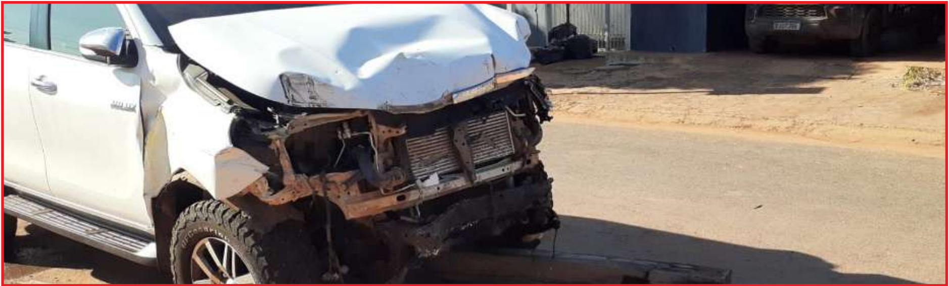
Hilux ficou destruída