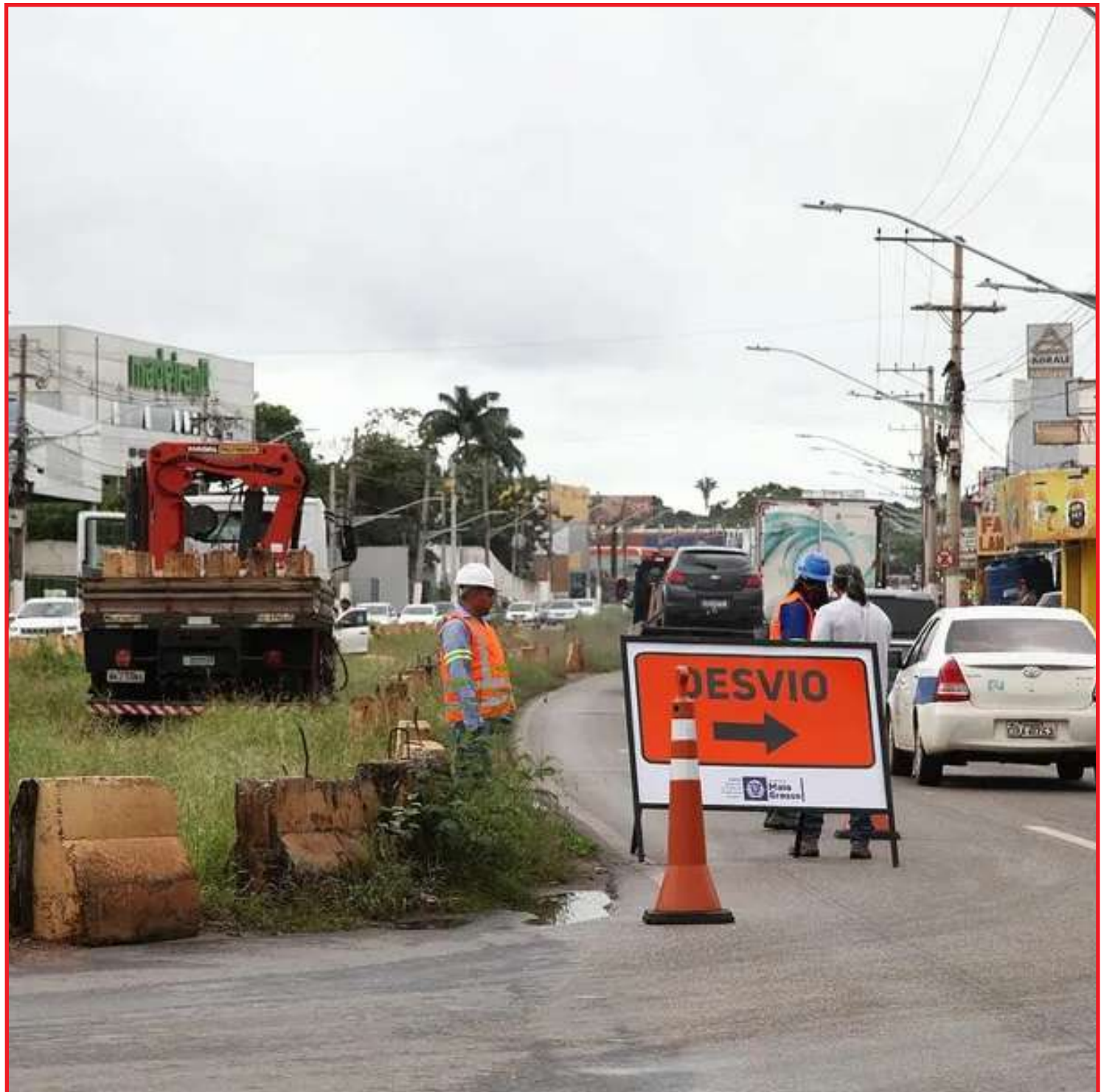
Motoristas devem se atentar às mudanças no trecho de obra do BRT

Em dezembro de 2014, as obras foram interrompidas. Em 2018, o governo do estado rompeu o contrato com o consórcio VLT e, depois, decidiu substituir o modal pelo BRT. Já em dezembro do ano passado, o governo começou a retirar as estruturas que serviriam de suporte para o VLT em Várzea Grande. As obras do projeto, que deveria ter ficado pronto oito anos atrás, já custou mais de R$ 1 bilhão.