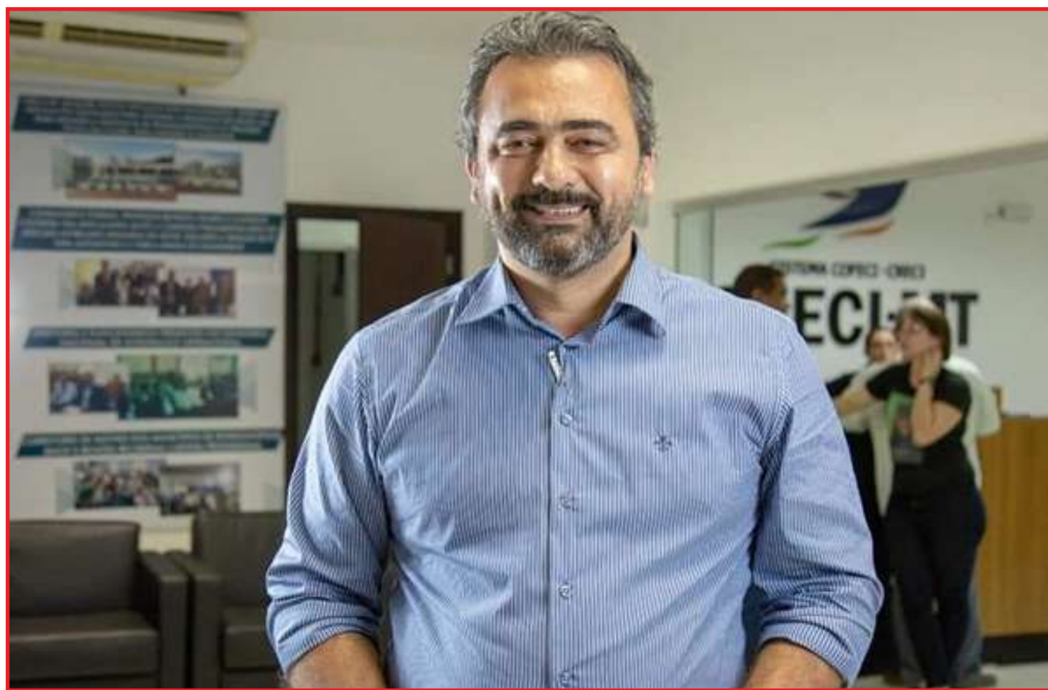
Contreira esteve em Sinop entregando carteiras para os novos corretores