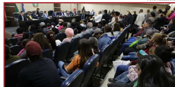
Deputados e prefeitos da região também devem participar

Em maio, após a conclusão dos processos burocráticos para transferência do controle acionário para a MT Par, o Governo do Estado assinou as ordens de serviço para recuperação, com início imediato, compreendem os seguintes trechos: rodovia dos imigran-