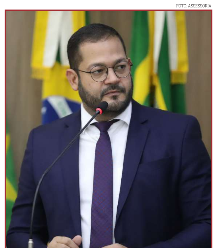
Deputados e prefeitos da região também devem participar

também foi confirmado que começará, neste ano, a construção de dois viadutos no perímetro urbano de Sinop.