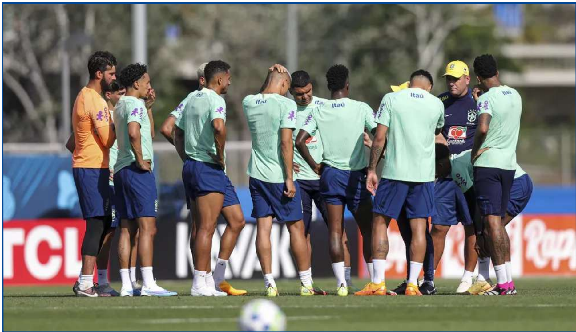
Ramon Menezes orienta jogadores da seleção brasileira durante treino

O técnico aproveitou a última atividade antes do