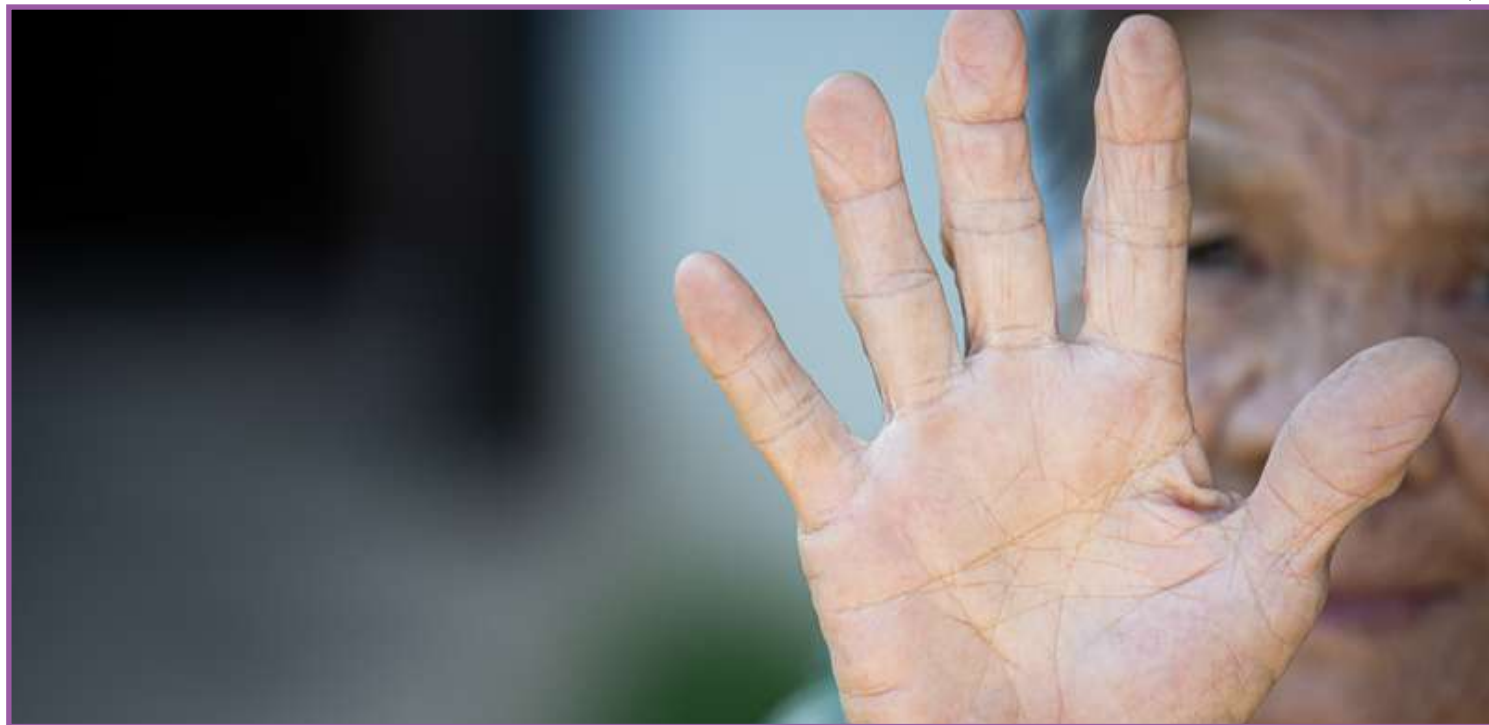
OMS aponta que população acima dos 60 anos, no Brasil, triplicará até 2050

Violência financeira ou econômica: São os