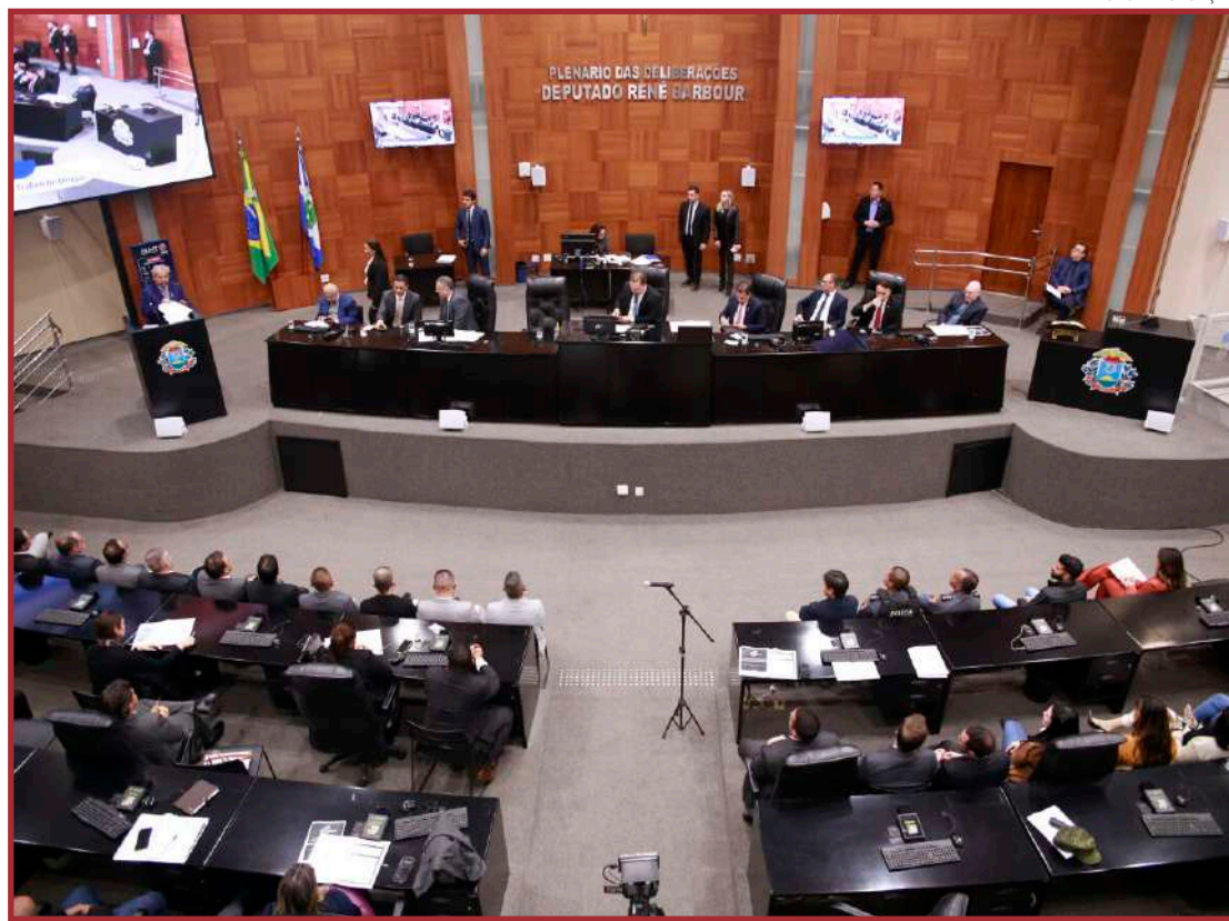
PL trata de homicídio relacionado à produção, distribuição e venda de drogas ilícitas

"Além dessa proposta, consta no PL também mais um requisito para a configuração do chamado tráfico privilegiado. Isto é, a diminuição de pena no tráfico será restringida à pequena quantidade da droga, desde que seja primário e tenha bons antecedentes. Esse projeto foi construído a várias mãos