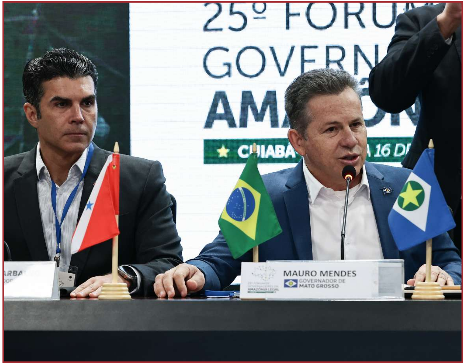
Posicionamento está contido na Carta de Cuiabá

Os governadores ainda reiteraram que "o protagonismo de defender a Amazônia será exercido por aqueles que de forma legítima representam os estados que integram esse bioma". A carta será enviada ao Governo Federal para compor o posicionamento do governo brasileiro na Cúpula da Amazônia, que será realizada em agosto em Belém (PA). "Nós, os governadores dos estados da Amazônia Legal, reunidos neste dia 16 de junho de 2023, em Cuiabá/MT, durante o 25º Fórum dos Governadores, apresentamos à sociedade e ao Governo Federal as nossas deliberações e subsídios ao posicionamento brasileiro na Cúpula da Amazônia, a realizar-se em agosto de 2023, em Belém/PA, entre os países da Pan-Amazônia e membros da Organização do Tratado de Cooperação Amazônica (OTCA): Brasil, Bolívia, Peru, Equador, Colômbia, Venezuela, Guiana, e Suriname".