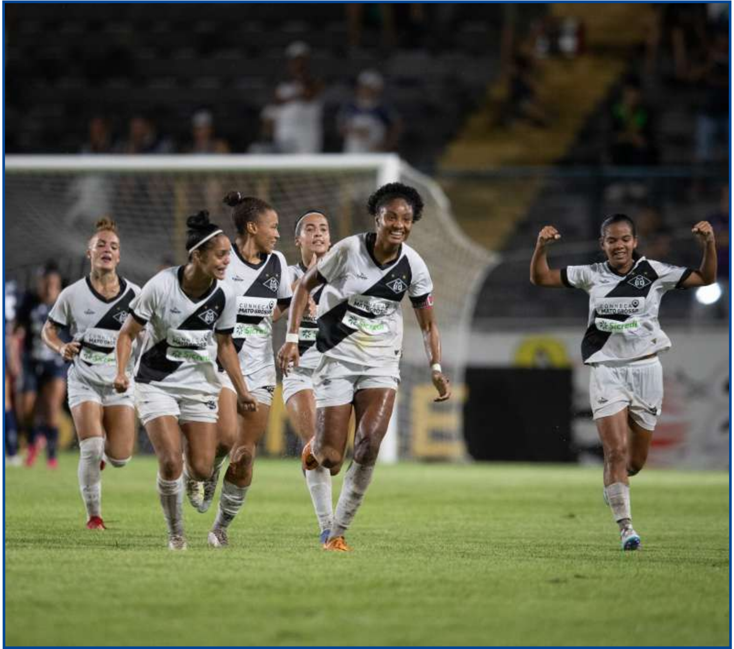
Mixto venceu fora e ficou perto do título na A3

No sábado, o União volta a campo pela 10ª rodada diante do Anápolis-GO, no Estádio Luthero Lopes, em Rondonópolis.