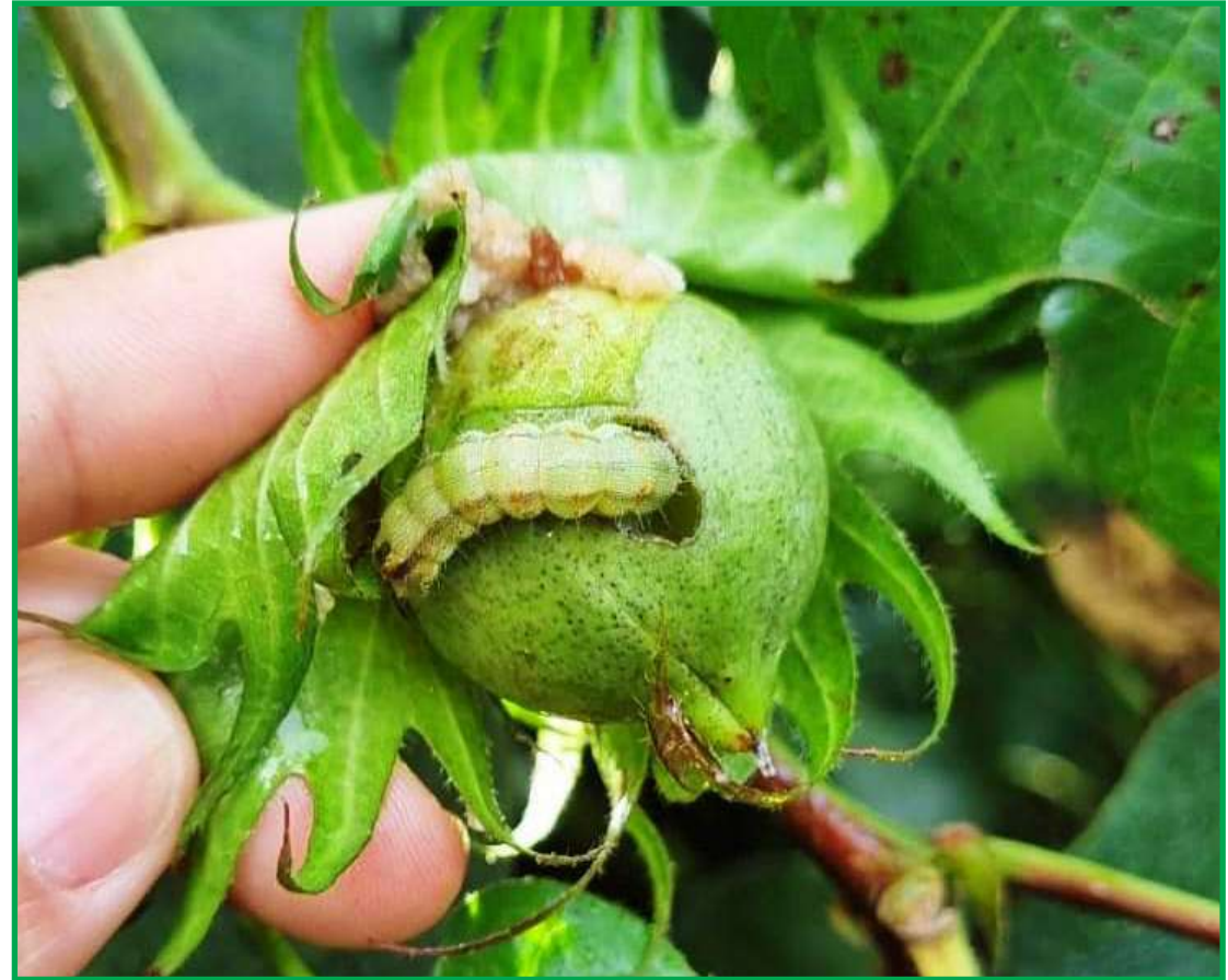
Cultivares ocasionam desfolha e danos nas estruturas vegetativas

Essa área é denominada "área de refúgio" e seu obje-