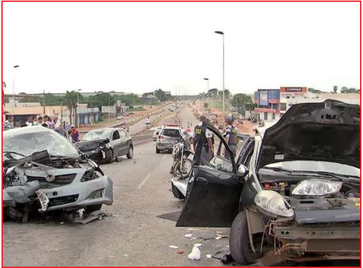
Ontem, comemorou-se 15 anos em que a Lei Seca entrou em vigor no país

Mais da metade (17) dos estados brasileiros registraram índices de mortalidade superi-