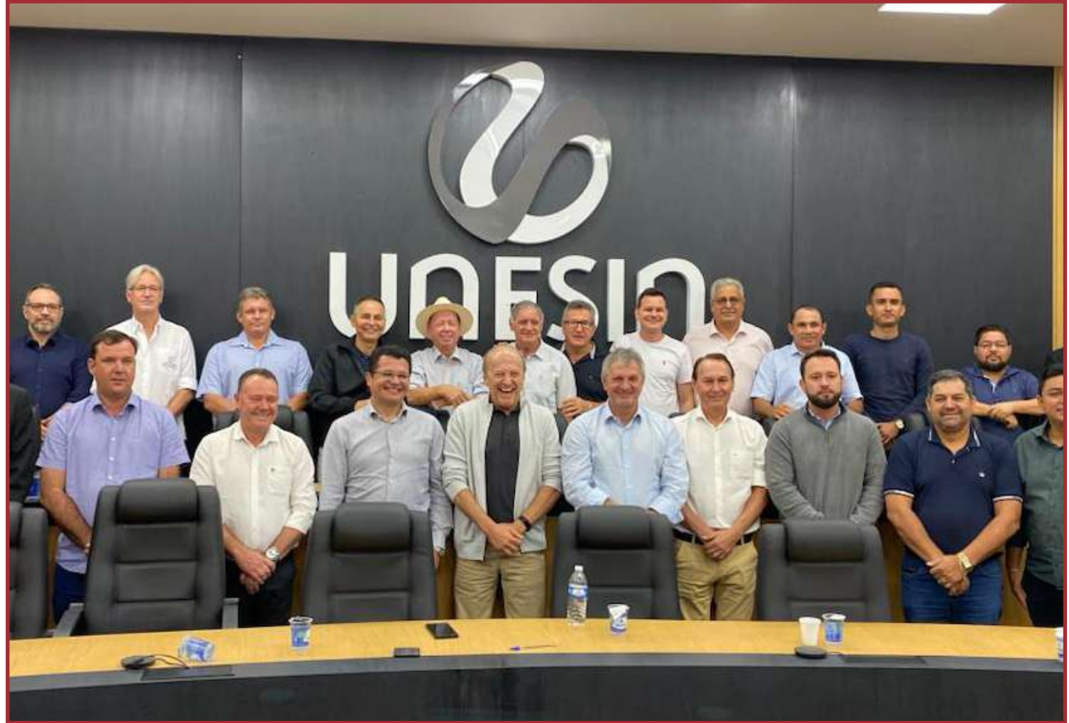
Obras devem começar ainda em 2023

O Governo do Estado, por meio da MT Par, assumiu o controle acionário da Concessionária Rota do Oeste em maio deste ano, já assinando cinco ordens de serviço para recuperação do pavimento,