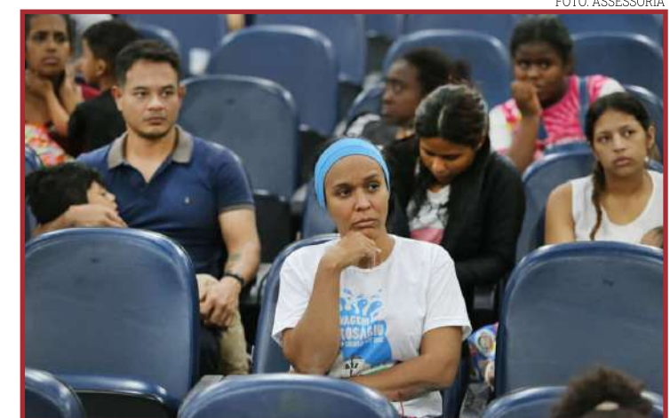
A proposta é trabalhar para a criação de políticas