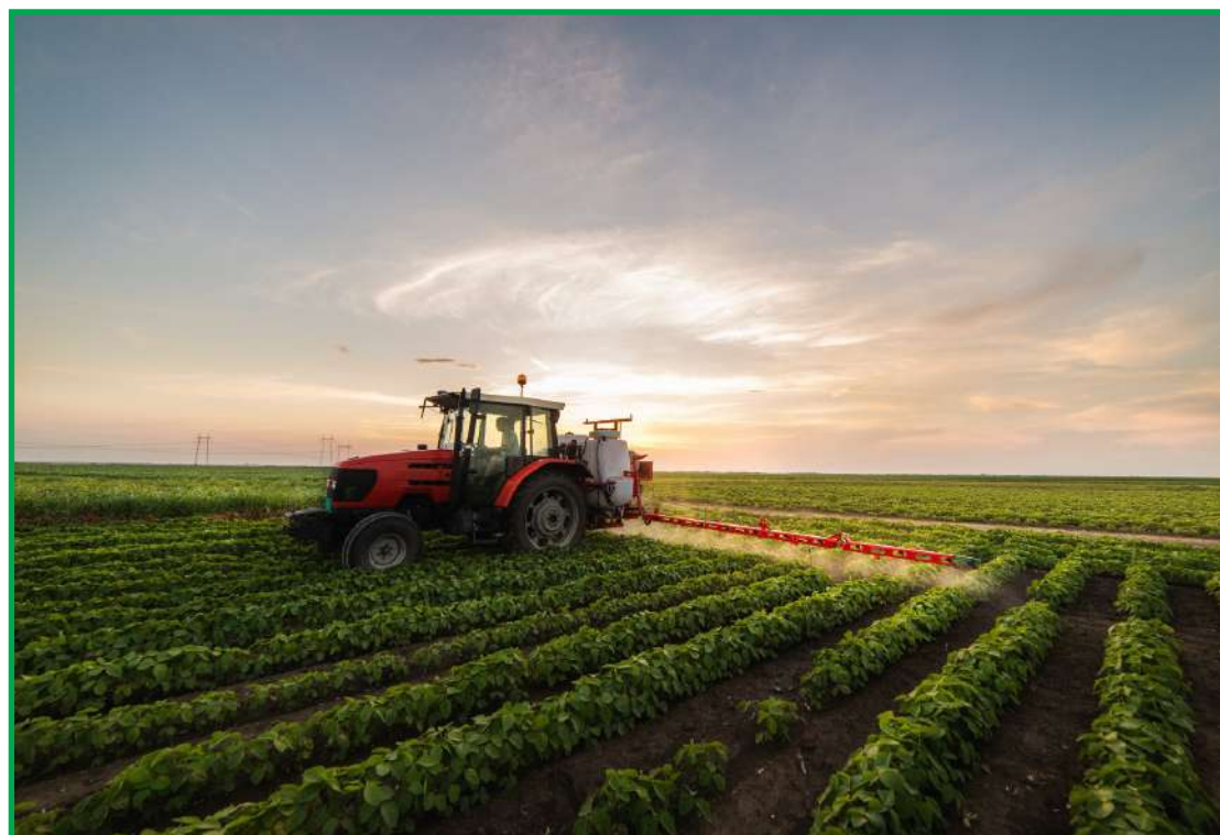
Capacidade de alterar dinamicamente a fluidez e viscosidade da calda de pulverização

está diretamente alinhada com o compromisso da companhia em desenvolver produtos que