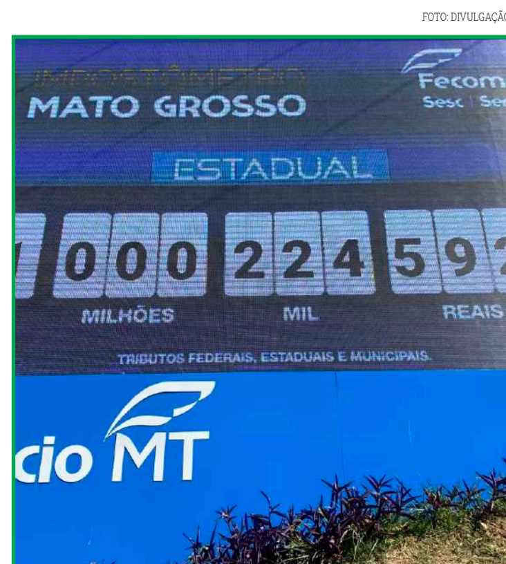
A marca foi atingida com 12 dias de antecedência se comparado ao mesmo valor arrecadado no ano passado

do evento e os participantes receberão certificado. A programação completa da Jornada Científica será divulgada posteriormente pela comissão organizadora.