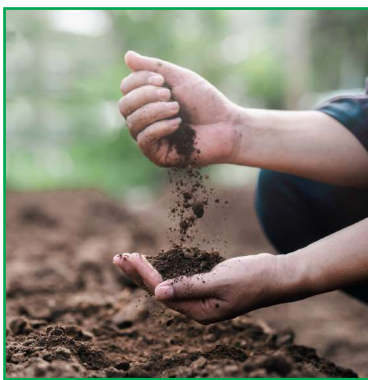
Melhorar a saúde do solo e promover a biodiversidade são os pilares

Entre os fertilizantes classificados como especiais que apresentam grandes resultados a cada safra estão os biotecnológicos. A Superbac, por exemplo, empresa brasileira que é pioneira no mercado nacional com essas soluções, desenvolve produtos que além de minerais, têm em sua base o Smartgran, o primeiro condicionador biológico de solo do mercado que combina matéria orgânica e bactérias inteligentes (Smartbacs).