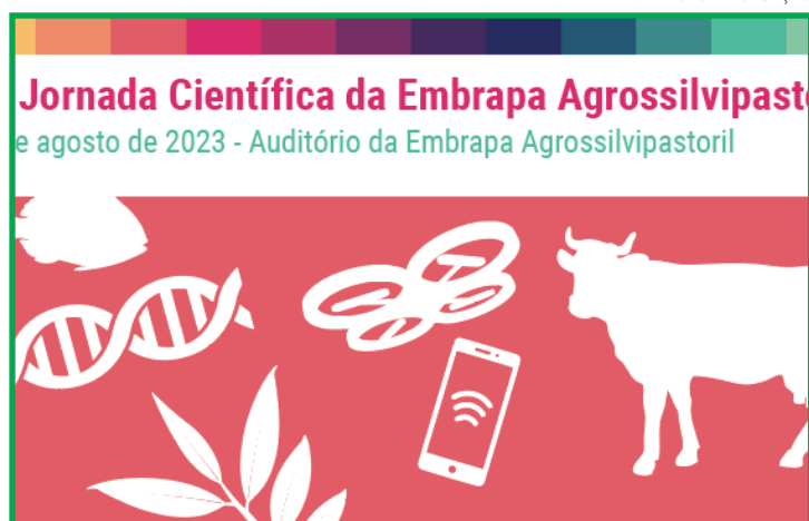
Prazo para submissão vai até o dia 19 de julho

Haverá premiação para o melhor trabalho na modalidade apresentação oral e na modalidade apresentação em formato de pôster. Todos os trabalhos inscritos e aceitos comporão os anais