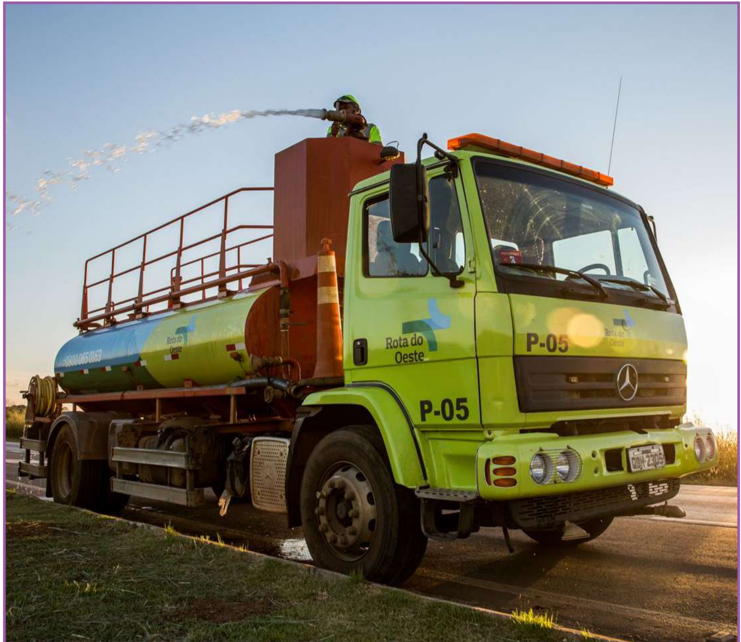
Nova Rota do Oeste dispõe de caminhões-pipa, abafadores e equipes treinadas

queimadas, a Nova Rota dispõe de seis caminhões pipa (sendo um