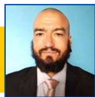
POR LEANDRO CARECA

Uma onça-parda foi resgatada pelo Batalhão de Proteção Ambiental (BPMPA), no último domingo (25), depois de ter sido atropelada na MT-040 entre Cuiabá e Santo Antônio do Leverger. Segundo o Batalhão, o animal estava ferido às margens da rodovia. Os militares foram acionados para dar apoio ao Corpo de Bombeiros no resgate da onça-parda. O animal teria sido atropelado por um veículo e estava ferido no local. O BPMPA confirmou que a onça estava machucada e fez o resgate do felino. Posteriormente, o animal foi encaminhado para o Recinto de Animais Silvestres (RAS) do Batalhão para que fosse atendida.