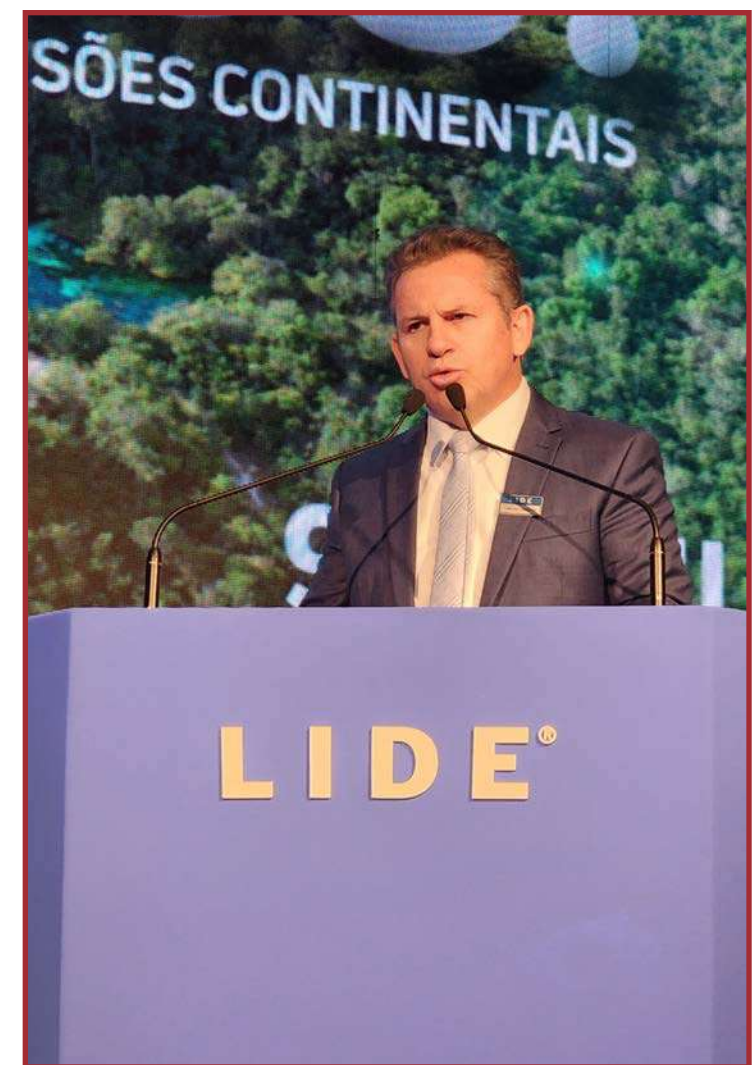
"Vamos cada vez mais liderar na produção de alimentos"