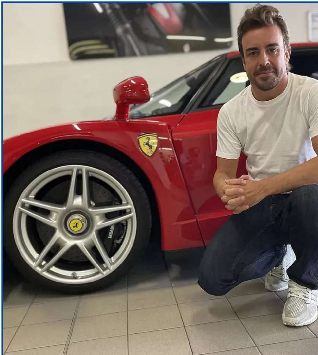
Chassi é o primeiro de apenas 399 fabricados no mundo

A Ferrari Enzo conta com motor V12 e 650 cavalos de potência. O modelo leva esse nome em homenagem a Enzo Ferrari, fundador da marca italiana, em comemoração ao primeiro título da escuderia na F1 no atual milênio.