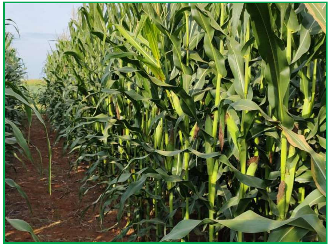
Solos com anos de agricultura possuem baixo teor de matéria orgânica

A adubação nitrogenada é realizada em doses e é outro fator a ser levado em conta. "Se o pro-