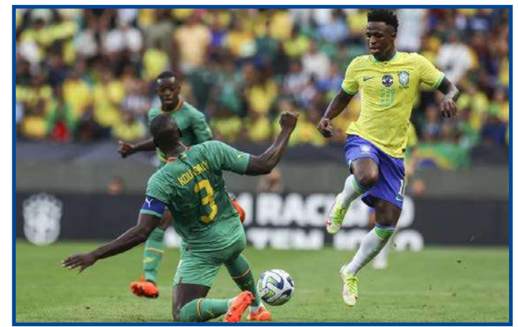
Seleção continua atrás de Argentina e França depois de amistosos em junho