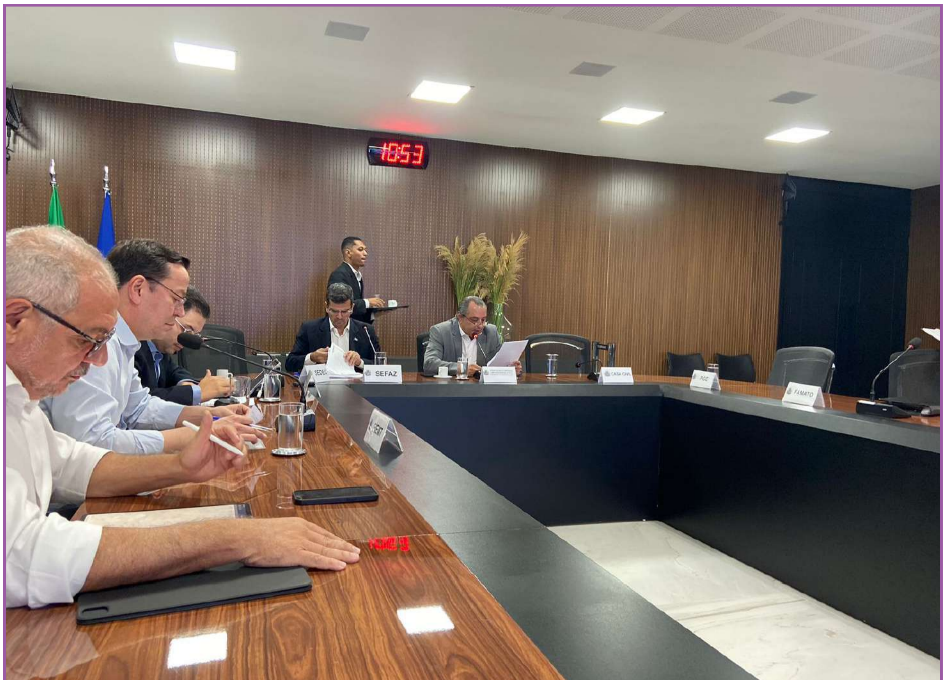
Condeprodemat aprovou em reunião realizada nesta semana, no Palácio Paiaguás

"A visão do futuro caminha em direção de fontes de energias renováveis, que diminuem o impacto ambiental quando comparadas