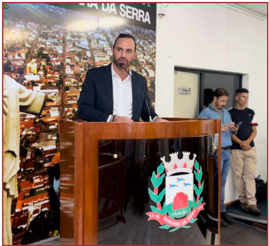
Compromisso de Reck Jr. com as rodovias de Mato Grosso

A MT-358 é uma via de ligação entre Tangará da Serra e Campo Novo do Parecis. Essa rodovia é fundamental para o escoamento da produção agrícola, especialmente grãos como soja e milho, que são cultivados em abundância na região. Além disso, a MT-358 também serve como rota para