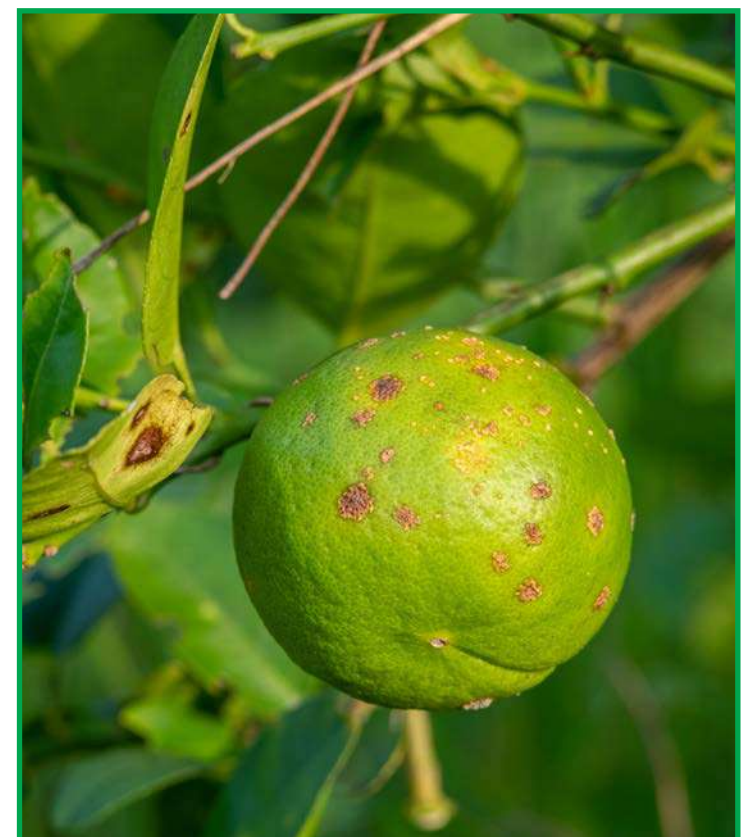
Doença provoca grandes perdas, mas ganha nova arma com o bactericida