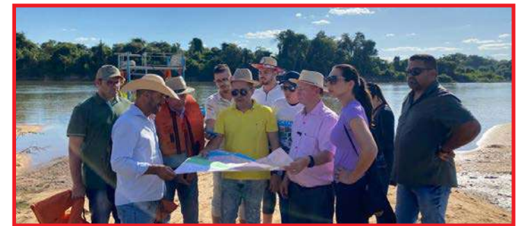
Festival de Praia e o Torneio de Pesca