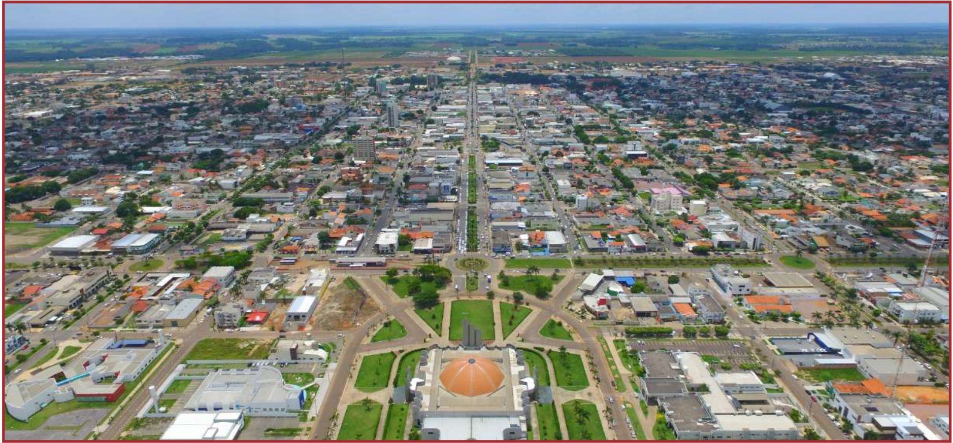
IBGE aponta 196 mil habitantes em Sinop

O resultado final foi menor até em relação a prévia divulgada, em dezembro de 2022, pelo próprio IBGE ao Tribunal de Contas da União (TCU), quando estimou-se uma população de 199.698 habitantes. Ou seja, na revisão do