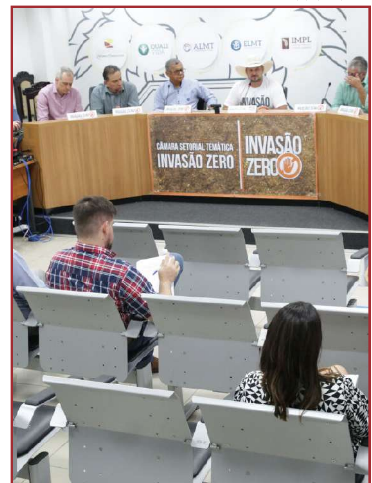
Objetivo é estudo sobre o número de invasões a propriedades privadas