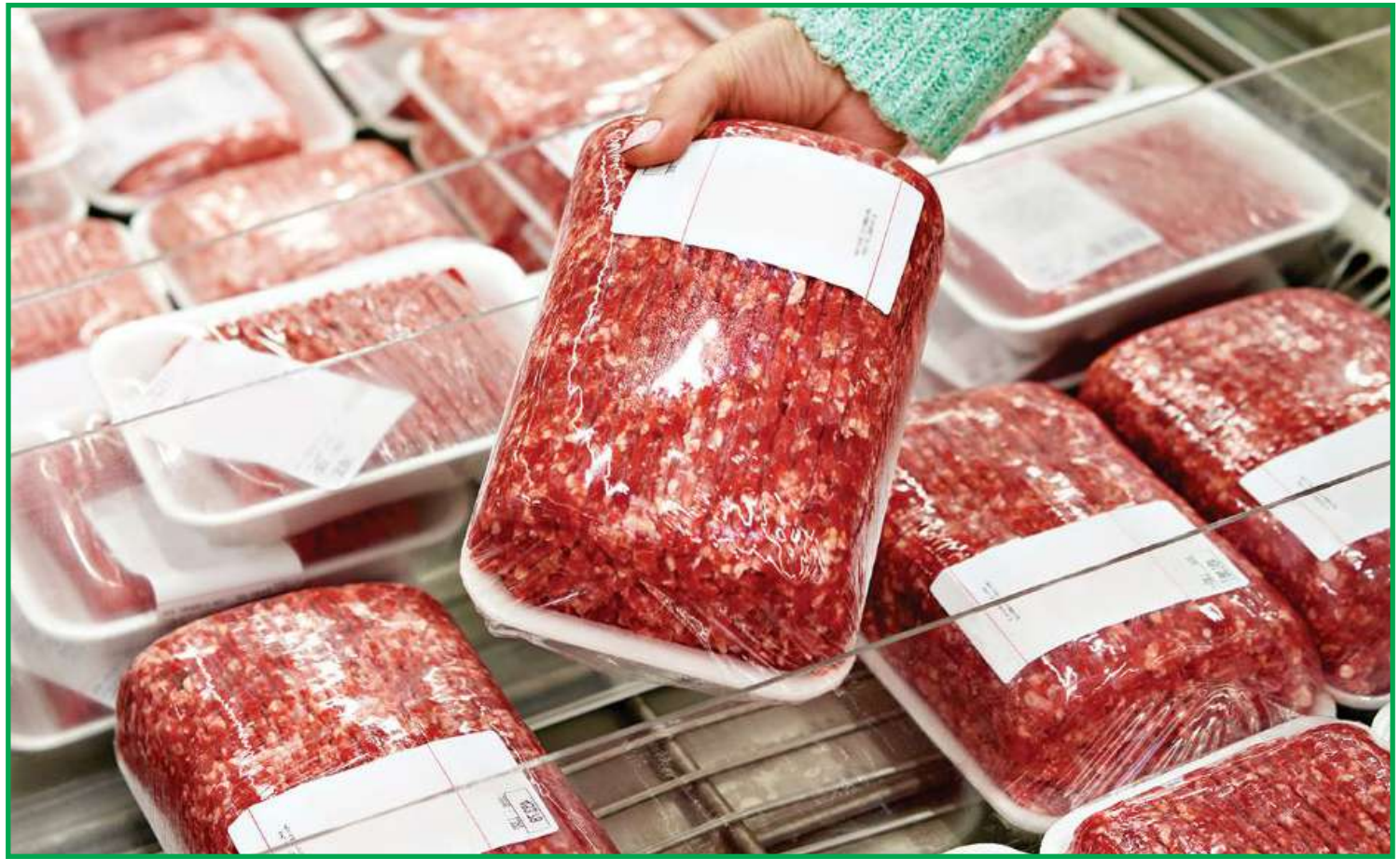
Cesta na capital encerrou o mês custando R$ 759,11 com variação nominal negativa