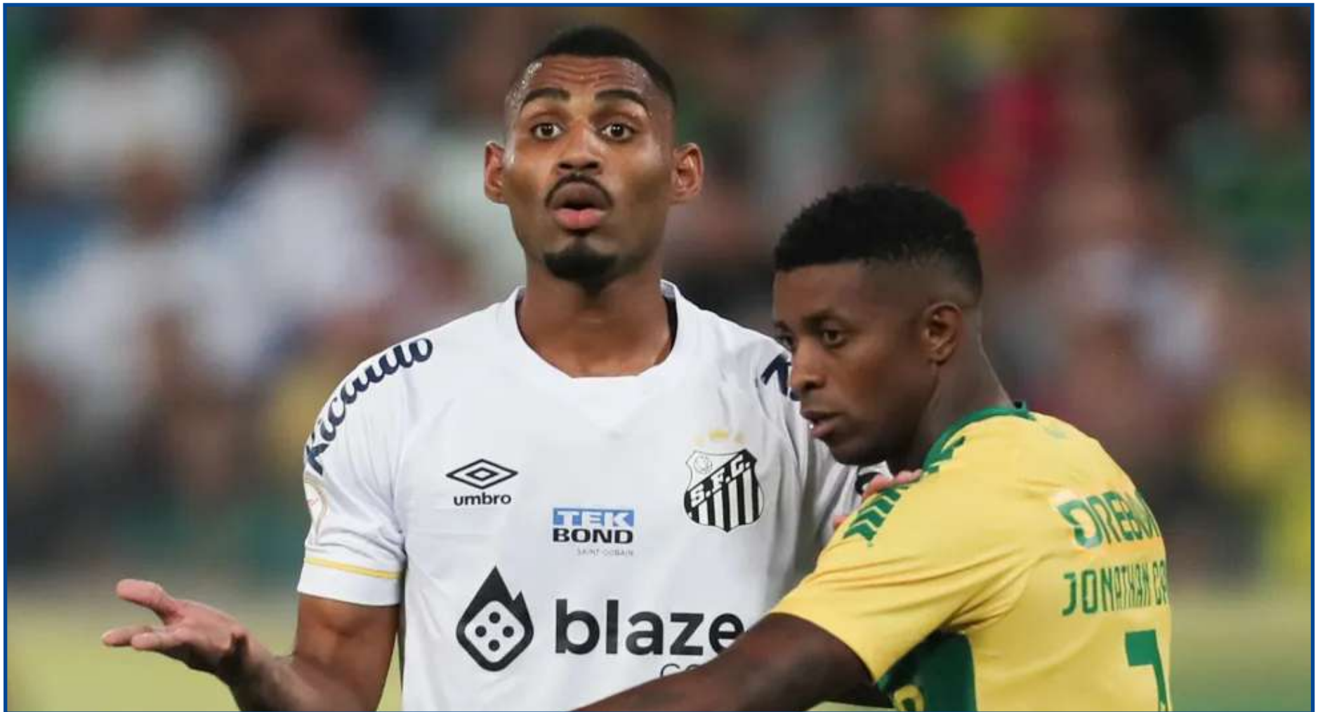
Zagueiro do Peixe reconhece fase ruim

Com a derrota no Pantanal, o Santos se manteve com 13 pontos ganhos e está cada vez mais próximo da zona do rebaixamento para a Série B do Brasileirão. Até o fechamento desta edição, o time ocupava a 14ª colocação, apenas dois pontos acima do Goiás, o primeiro time da zona – a equipe entrou em campo diante do lanterna Coritiba após fechar