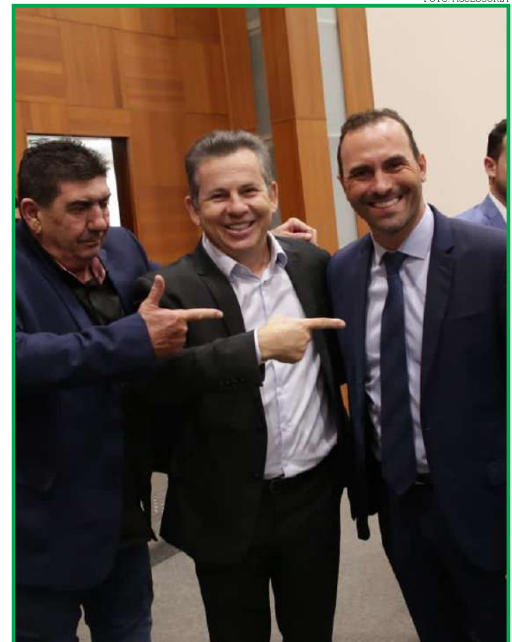
Evento foi realizado na noite da última sexta na Assembleia