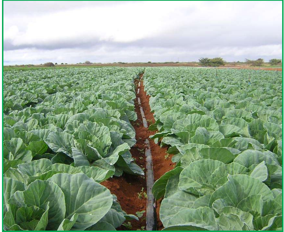
Mangueiras não precisam de bombeamento e atendem diferentes espécies vegetais

Para a água chegar às mangueiras, apenas a va-