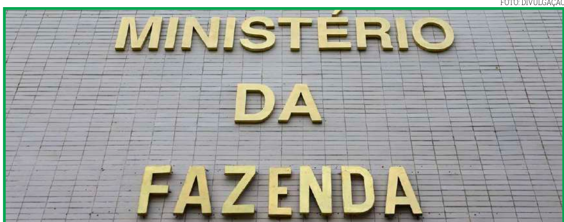
Secretário de Política Econômica adiantou nova estimativa

Em maio, a Fazenda tinha projetado crescimento de 1,91%