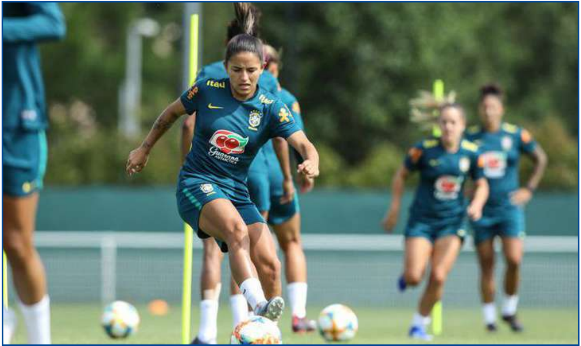
Jogadoras da seleção brasileira feminina durante treinamento antes da Copa

"Eu acho que a gente tem um espírito muito de querer vencer. A Pia fala muito isso. A gente tem que fazer coisas diferentes para obter resultados diferentes. Uma das coisas que ela implanta é