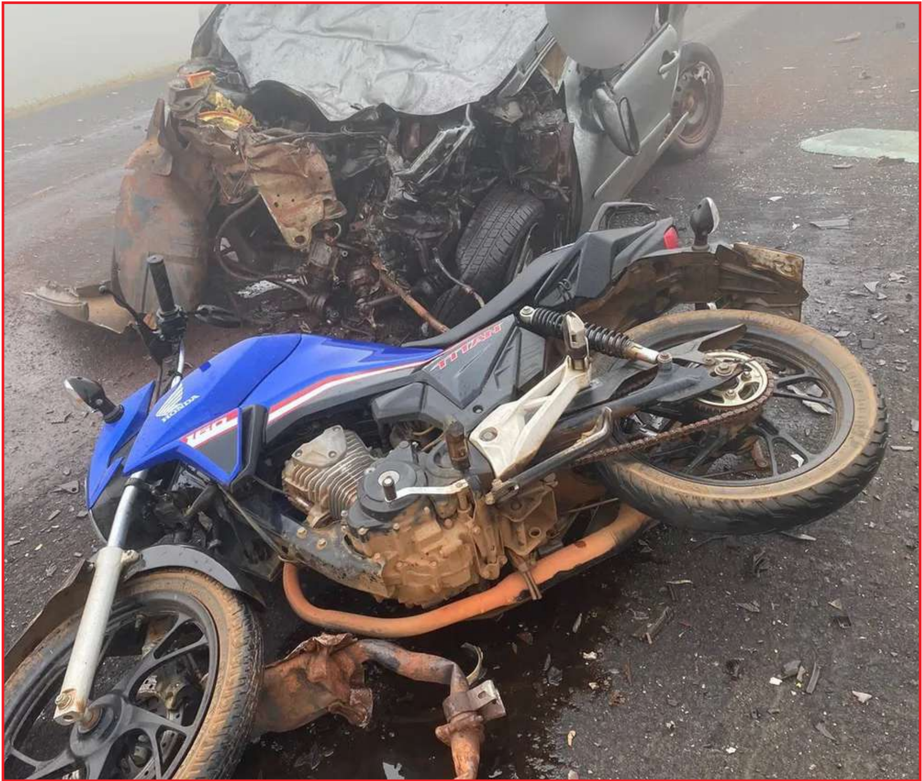
Pouca visibilidade, causada pela neblina, pode ser a principal causa do acidente

Segundo os bombeiros, a forte neblina e falta de visibilidade podem ter causado o engavetamento entre os veículos. As causas, no entanto, ainda serão investigadas. Por volta das 10h, não havia mais neblina no local do acidente, o que facilitou o trabalho das equipes e liberou o trânsito.