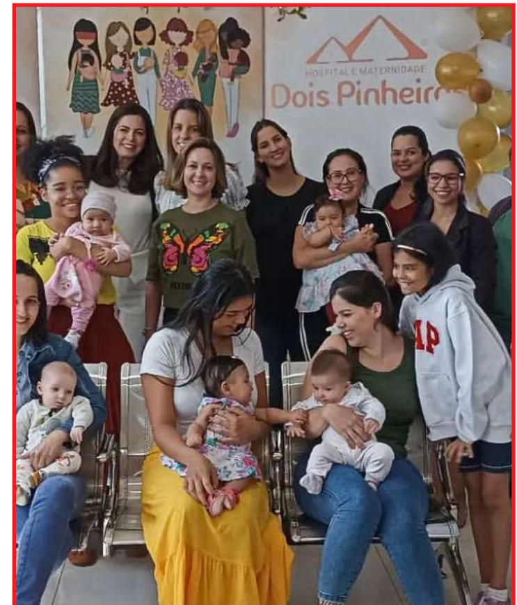
Para participar é necessário preencher um formulário