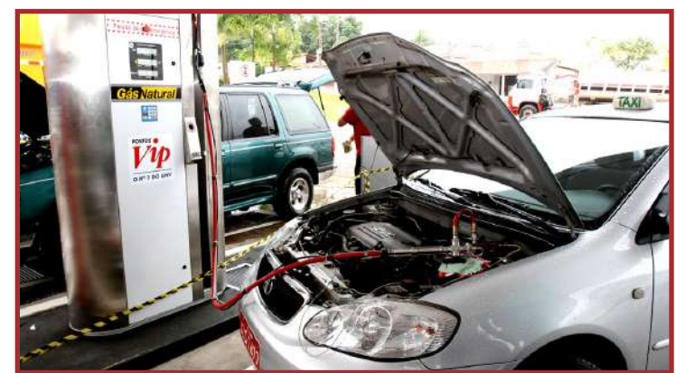
Valor praticado anteriormente, de R$ 1,45, reprovisto pela Ager