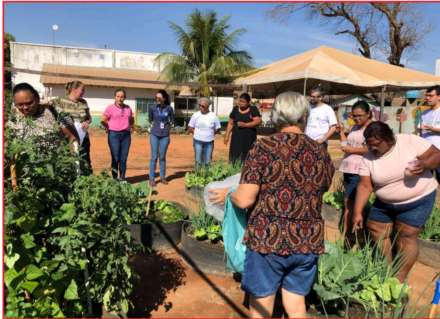
A horta comunitária do CRAS Menino Jesus é cultivada por mulheres