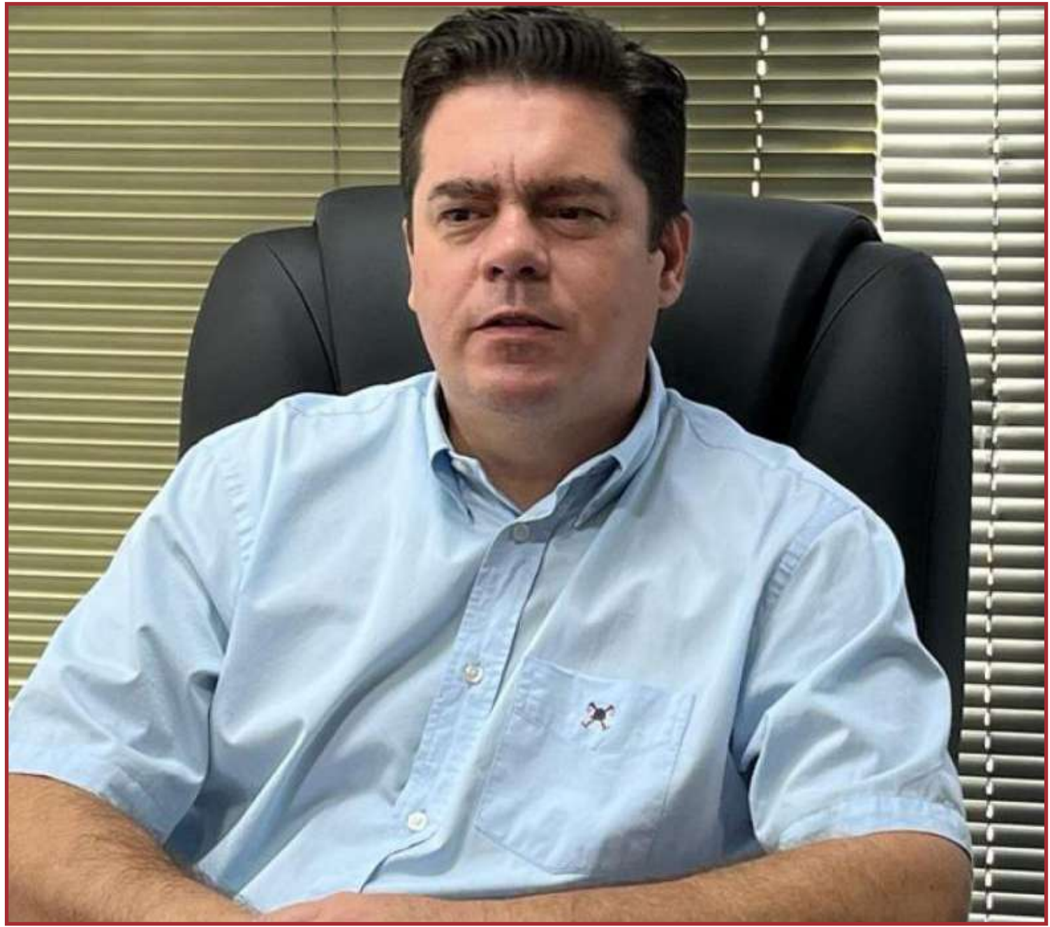
O documento destaca os princípios, as regras e os instrumentos