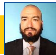
POR LEANDRO CARECA

Na última terça-feira (18) um caminhão carregado de papelão pegou fogo na BR-246, próximo a Rosário Oeste. O condutor que passava por uma praça de pedágio seguia de Tangará da Serra em direção a Cuiabá. Ao passar pela cabine de pedágio os funcionários alertaram que o veículo estava em chamas. Foi então que o motorista estacionou próximo a uma caixa d'água presente no local. Ele e os funcionários tentaram conter o fogo, mas não foi possível. Segundo informações do 7º Batalhão de Polícia Militar de Rosário Oeste e Região, o fogo tomou conta de todo o caminhão, o destruindo por completo. O condutor escapou sem ferimentos. Com a chegada da Polícia Militar, foi realizado o Boletim de Atendimento para que as devidas providências sejam tomadas.