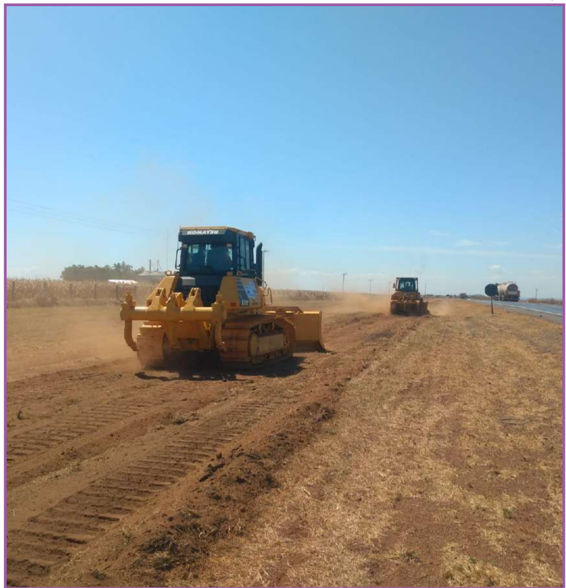
Obras de duplicação da BR-163, em Diamantino

Também como parte do plano de ataque estão a assunção do trecho da BR-364 - de Cuiabá a Rondonópolis - que está em recuperação e cerca de R$ 4 milhões são investidos por