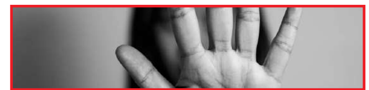
Casos de estupro de vulnerável crescem 18% em MT