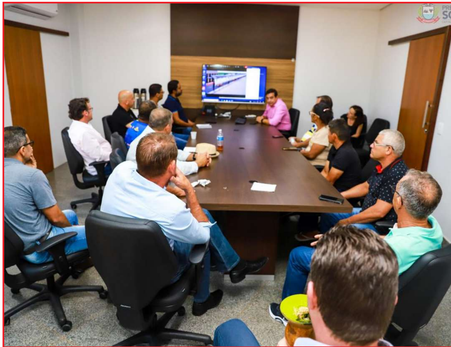
Local abriga a tradicional feira da Zona Leste, aos domingos de manhã