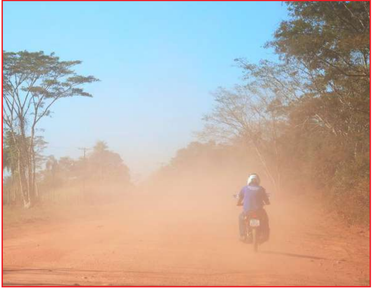
Poeira ajuda a agravar a situação

O ar com baixa umidade carrega vírus e bactérias. Gripe, resfriado e faringite são mais comuns nessa condição. Isso porque o muco das vias aéreas