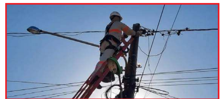
Dono de propriedade rural é multado em mais de R$ 70 mil por fraude de energia em MT