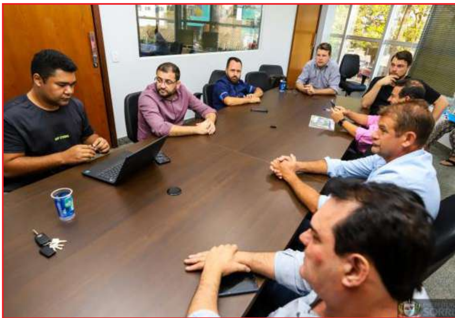
Ari recomenda que sejam observadas a padronização e a acessibilidade