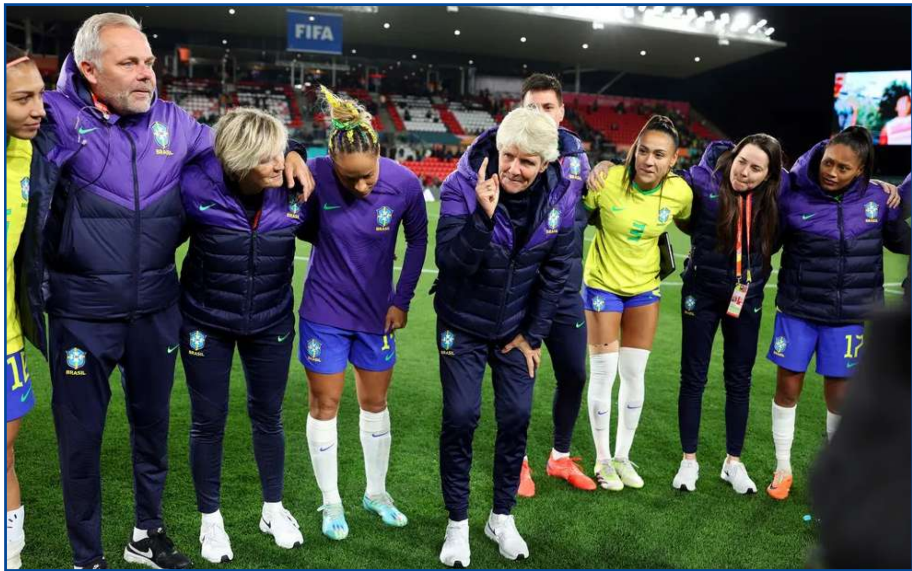
Pia Sundhage, em conversa com a seleção após goleada sobre Panamá

"Difícil fazer gols, fizemos quatro hoje. Estou muito feliz, muito feliz. Contando que criamos chance de gol, não fico preocupada. Da forma que jogamos hoje, fico bem satisfeita com as combinações e que o Panamá não fez gols", analisou