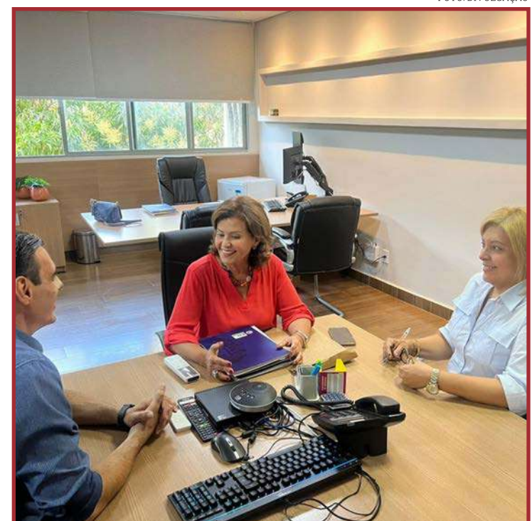
Atuação no Senado será pelos interesses de MT