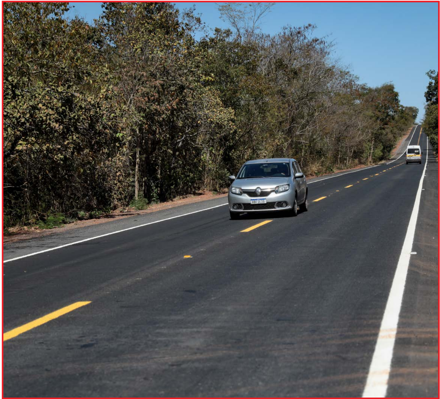
Trecho de 73,2 km da MT-060, no entroncamento com a BR-070 (Posto Tarumã)

"O Governo tem feito diversos investimentos para melhorar as condições de tráfego dos moradores e dos turistas que querem conhecer o nosso