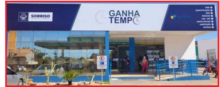
Mesmo antes da entrega oficial, unidade já está à disposição da comunidade desde fevereiro

DIRIGIR SOB O EFEITO DE ÁLCOOL OU OUTRAS DROGAS É CRIME