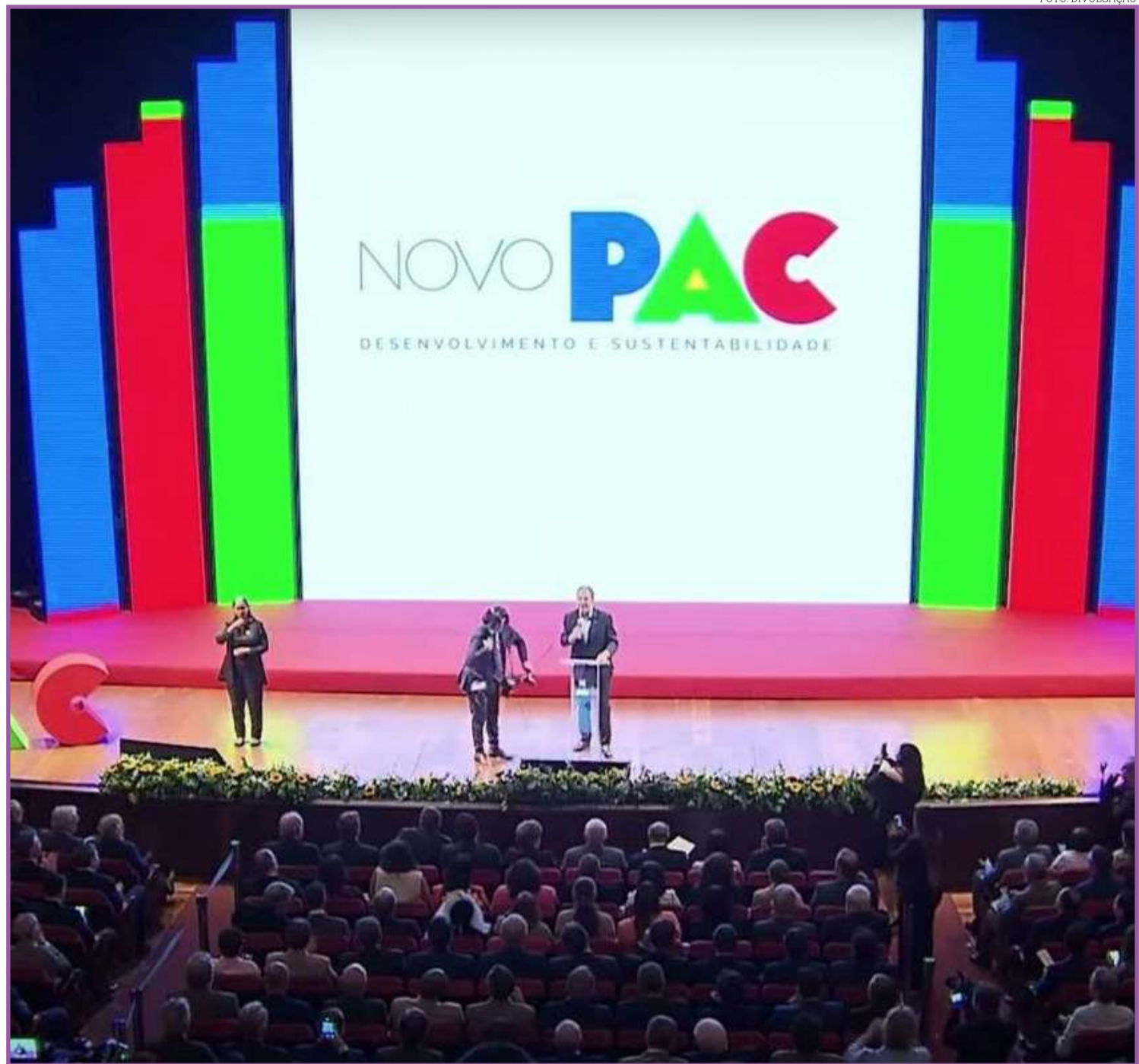
Programa foi lançado nesta sexta

No eixo SAÚDE, serão construídas novas unidades básicas de saúde, policlínicas, maternidades e compra de mais ambulâncias para melhorar o acesso a tratamento especializado. O Novo PAC investe também no complexo industrial de saúde,