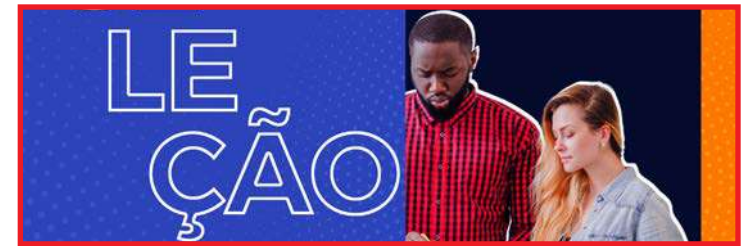
Inscrições vão até segunda-feira