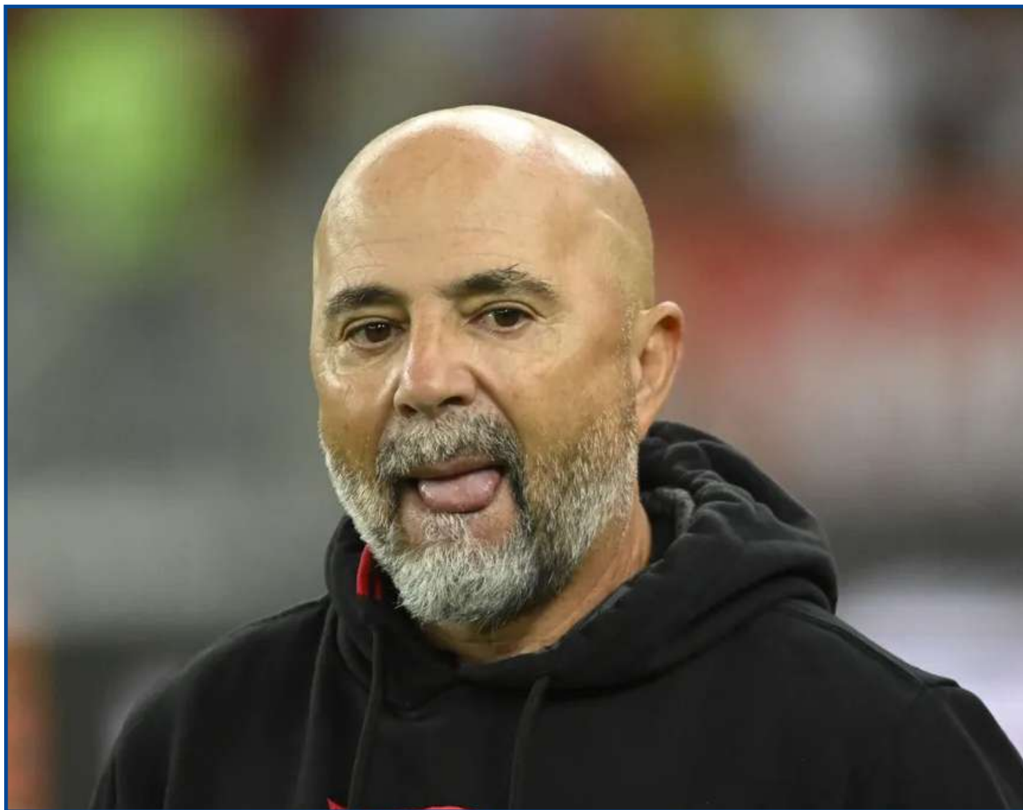
Jorge Sampaoli vive momento de isolamento no Flamengo

Diversos integrantes da delegação rubro-negra, entre eles Rodolfo Landim e Marcos Braz, passaram pelo mesmo bar, mas não houve qualquer diálogo com o treinador. Sampaoli não jantou