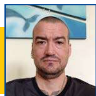
POR LEANDRO CARECA

Cinco trabalhadores foram resgatados em condições de trabalho análogas à escravidão em Chapada dos Guimarães, no último dia 10. No mesmo local, também foram retiradas uma mulher grávida, esposa de um dos trabalhadores, e uma criança de 2 anos. A operação foi conduzida por meio de uma equipe de auditores-fiscais do Ministério do Trabalho. De acordo com os auditores, as vítimas ficavam alojadas em espaços com condições insalubres, não tinham carteira assinada, não tinham descanso semanal remunerado e nenhum direito trabalhista garantido. A equipe afirma, também, que os trabalhadores dormiam em colchões apoiados em tábuas ou blocos de construção e que o local em que ficavam apresentava instalações elétricas irregulares com fiação exposta. Segundo os auditores, o alojamento era utilizado para armazenar materiais de construção, o que contribuía para a falta de higiene e o aparecimento de animais, como escorpiões, insetos, morcegos e cobras. Ainda conforme o relato dos fiscais, a alimentação ofertada era insuficiente e de baixa qualidade.