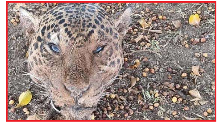
"Homem" alimentava em média 16 cães com a carne dos felinos abatidos