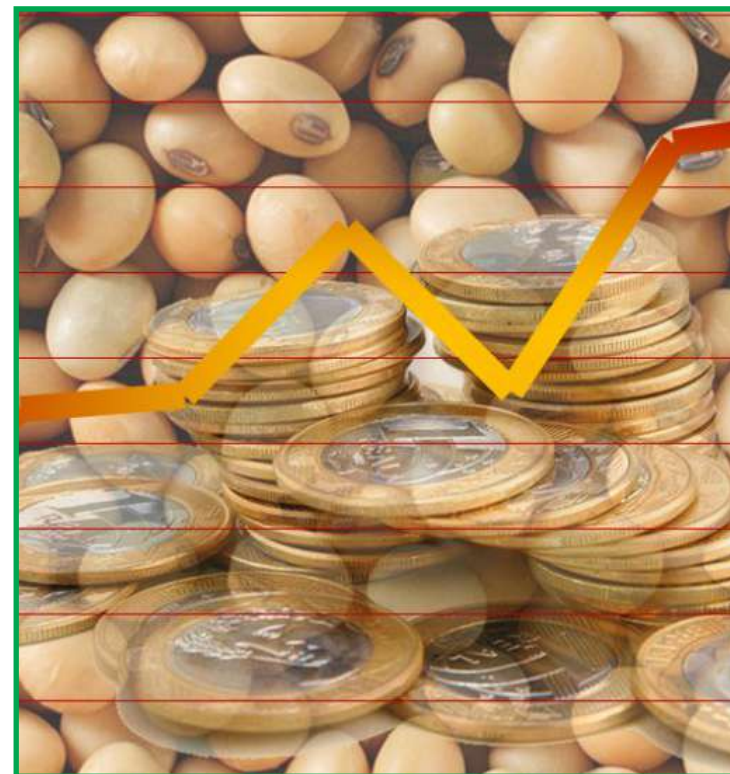
Defensivos também ajudaram na queda dos custos entre julho/22 e julho/23

ção. Porém, um efeito adverso é que a Selic alta também é recessiva, ou seja: dificulta o crédito, o consumo e investimentos.