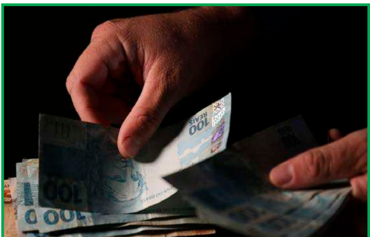
Dados obtidos com exclusividade são da Serasa Experian

No começo de agosto, o Comitê de Política Monetária (Copom) do Banco Central reduziu a taxa de juros básicos da economia (Selic) para 13,25% ao ano. Foi o primeiro corte em três anos. A Selic influencia diretamente o comportamento dos juros cobrados pelos empréstimos ofereci-