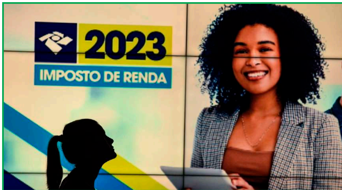
Estudo inédito do Sindifisco Nacional

Outro fator que contribui para o menor pagamento de Imposto de Renda em algumas ca-