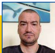
POR LEANDRO CARCA

Quatro gatos, dois cachorros e uma cadela com sete filhotes recém-nascidos foram resgatados em uma casa no bairro Mapim, em Várzea Grande, após um homem se mudar e abandoná-los trancados em casa sem acesso a água e comida. Segundo os moradores que fizeram o resgate, os animais aparentavam estarem abandonados há, no mínimo, uma semana. Em fotos tiradas por eles, é possível observar que a cadela, mãe dos filhotes, está muito magra. Uma das moradoras que ajudou no resgate contou que registrou um BO contra o ex-vizinho suspeito de abandonar os animais. Após o resgate, os animais foram encaminhados para a Fundação Júlio Campos, onde estão recebendo todos os cuidados necessários, como alimentos e vacinas. O local serve apenas como um lar temporário e os animais precisam ser adotados. Os interessados devem entrar em contato com a própria fundação.