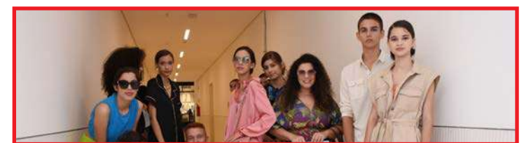
Sinop Fashion Trends acontece até hoje