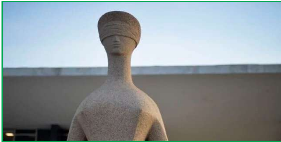
STF vai analisar recursos da União e do Senar contra a decisão que validou incidência de contribuição sobre a receita bruta do produtor rural

Agora, a discussão é sobre a natureza jurídica do tributo: se é social, ou de interesse de cate-