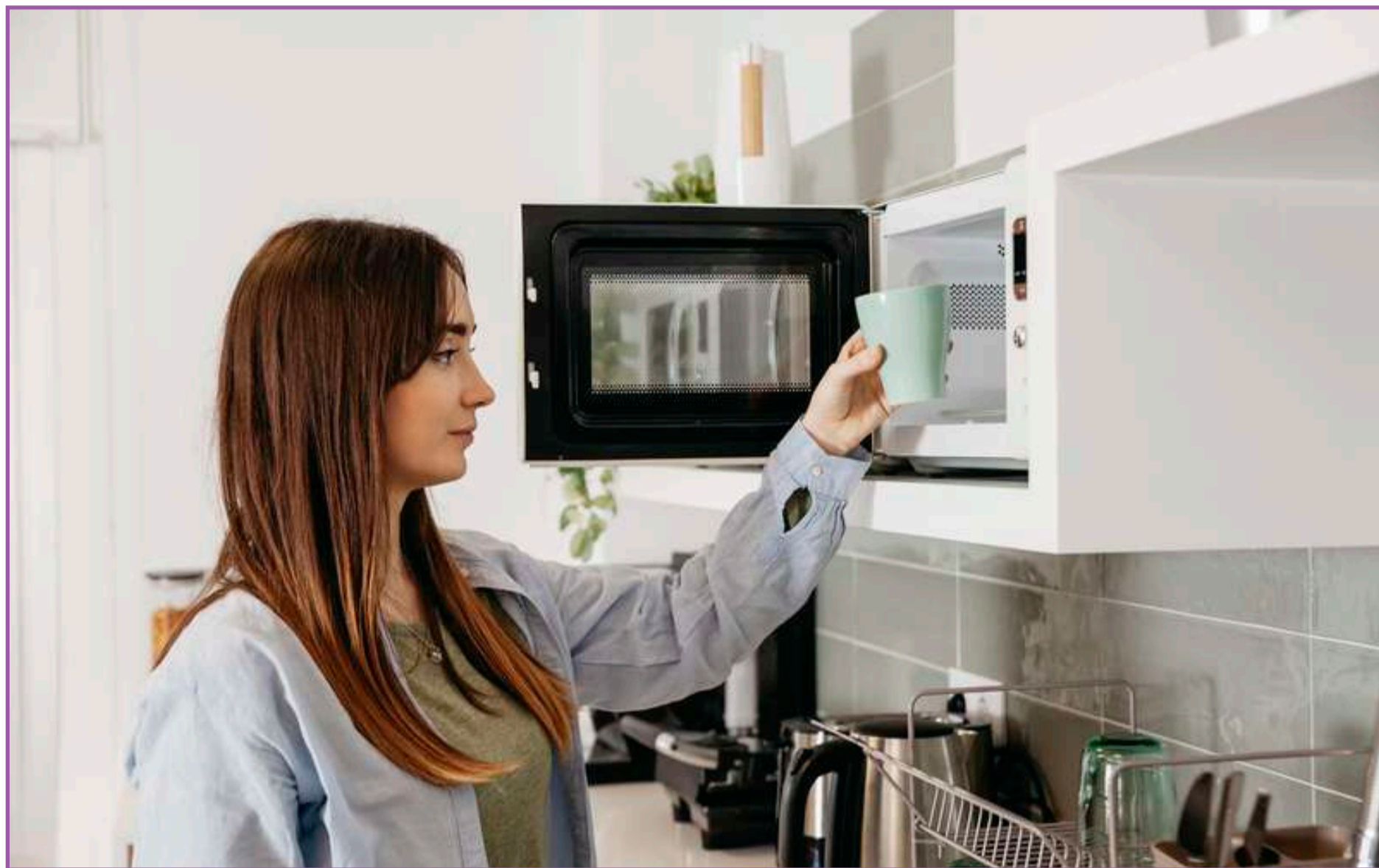
Micro-ondas não oferece riscos à saúde

- Use recipientes adequados, preferencialmente de vidro, cerâmica ou plástico seguro para micro-ondas. Nos plásticos, a recomendação é que tenham a indicação "livre de BPA" e/ou iden-