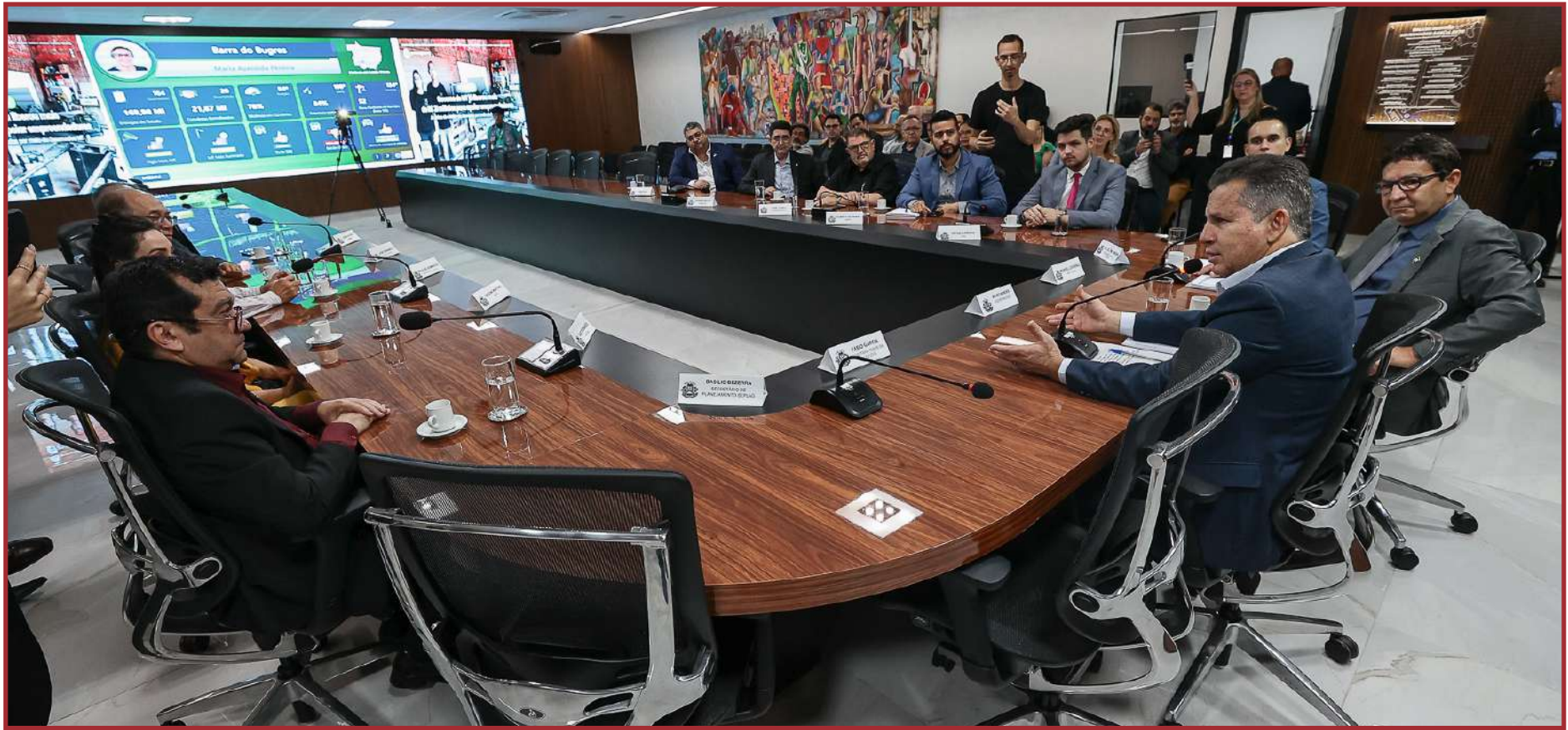
MT oferece atendimento digital de serviços

serviços prestados pelo Estado. E o cidadão que paga seus impostos quer esses serviços custando menos e produzindo mais", destacou o governador.