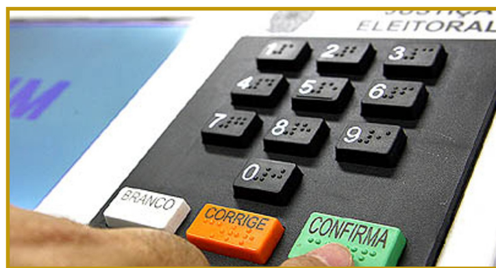
TRE alerta para regularização

O prazo final para inscrição nos processos seletivos vai de 11 de setembro a 31 de dezembro, a depender do cargo e da coopera-