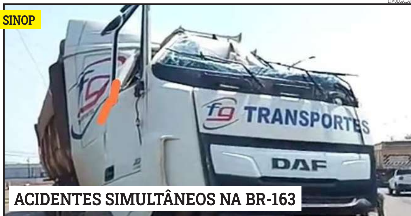
Página - 4

A Diretoria de Cultura de Sinop realiza neste sábado o 1º Festival do Campo no Núcleo Campos Novos, na Gleba Mercedes, a partir das 19h. O festival irá contemplar os melhores da noite com premiações para os três primeiros colocados de cada categoria, seja na adulto, para maiores de 16 anos ou infanto-juvenil, com idade mínima de 12 anos e máxima de 15 anos.