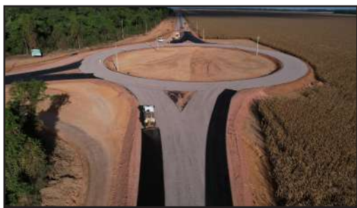
Página - 3