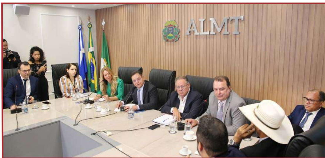
Objetivo é solucionar execução trabalhista

A proposta da Assembleia é de o Estado comprar a estrutura e depois desapropriá-la para fazer um hospital estadual. Com os recursos financeiros, quitar os débitos trabalhistas dos ex-funcionários. O presidente da AL, deputado Eduardo Botelho, afirmou que os parlamentares e o Tribunal Regional do Trabalho vão trabalhar em conjunto para formalização do acordo que ponha fim às dívidas trabalhistas que a Santa Casa tem com os ex-funcionários da unidade. O pedido será formalizado e apresentado ao Governo do Estado até o final de outubro.