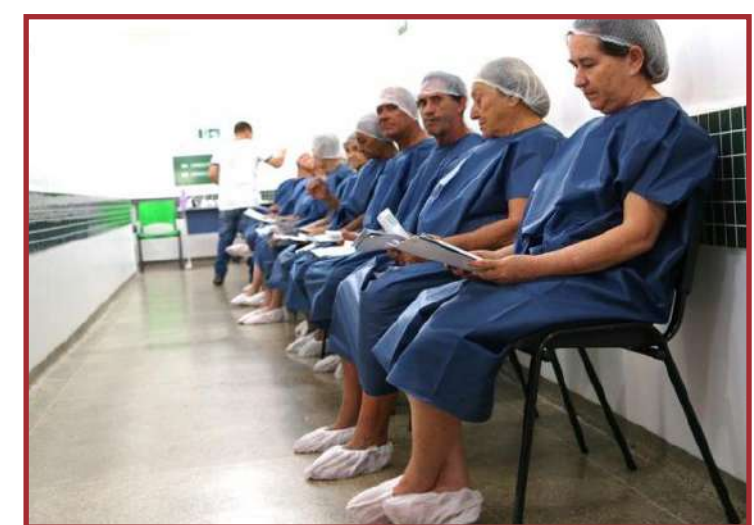
Aplicação será de mais de R$ 800 mil