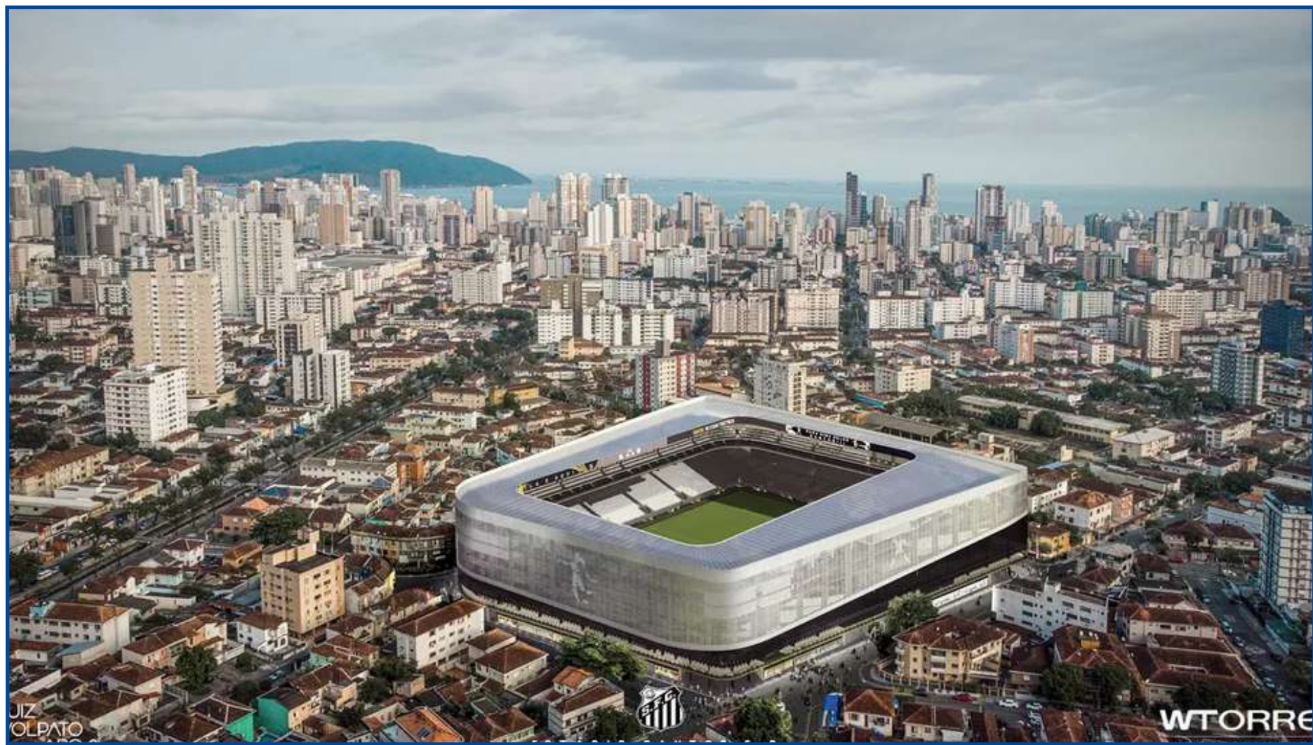
Imagem aérea mostra como ficará a cidade de Santos com a nova Vila Belmiro

A atual Vila Belmiro não tem estacionamento. O Santos, inclusive, chegou a ter parcerias