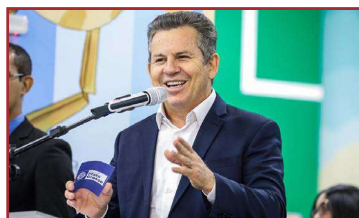
Auxiliar o Supremo a decidir questões sobre papel da União em processos de medicamentos

que irá solicitar informações de todos os estados para viabilizar soluções para esse "velho problema". "Vou pedir aos governadores que me apresentem as principais causas na judicialização da saúde em