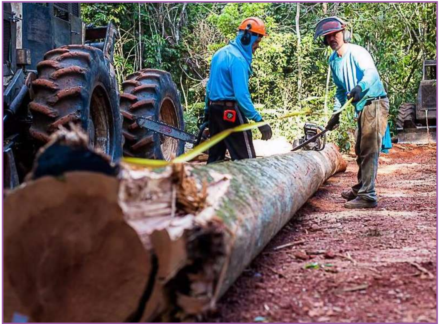
Produção inclui madeira em tora, óleos essenciais e castanhas

Conforme o Observatório de Desenvolvimento, houve uma redução de florestas de eucalipto de 218 mil hectares para 156