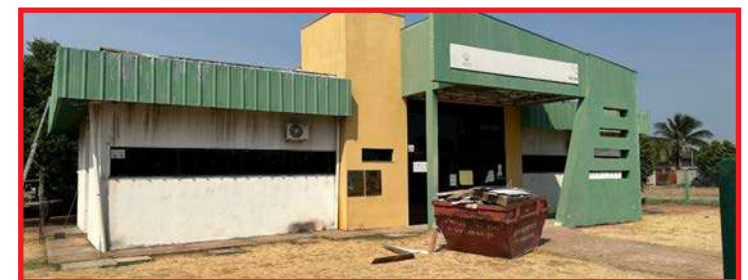
Unidades estão passando por reformas