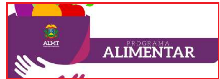
Na ocasião, foram entregues mais de 40 toneladas de mantimentos