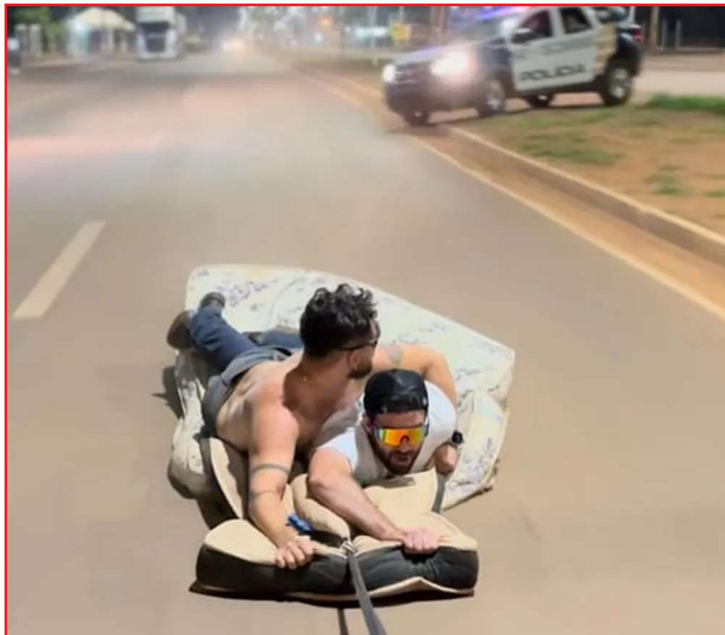
Veículo foi apreendido por direção perigosa e desordem pública