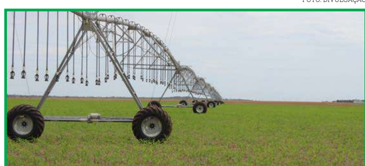
Recursos serão destinados ao apoio aos polos e projetos de agricultura irrigada

A articulação institucional da Associação dos Produtores de Feijão, Pulses, Grãos Especiais e Irrigantes de Mato Grosso (APROFIR), contribuiu para que fosse cumprido o Art. 42 do Ato das Disposições Constitucionais Transitórias (ADCT), com redação válida até 2028, onde a União deve aplicar dos recursos destinados à irrigação 20% na Região Centro-Oeste. APROFIR MT salienta que mesmo com esses recursos já consolidados, a associação ainda busca mais recursos que possam dar a sustentação mais rápida para o crescimento das áreas irrigadas não só em Mato Grosso, mas para todo o