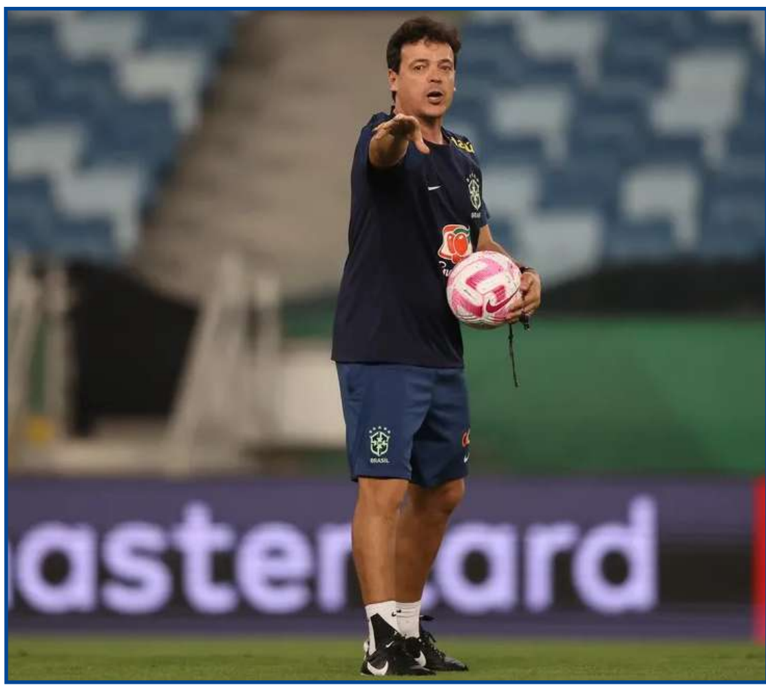
Fernando Diniz vai para o terceiro jogo no comando da Seleção

Tal qual o antecessor, Diniz utiliza linha de quatro defensores. Nos dois primeiros jogos com o técnico, Danilo teve um pouco mais de liberdade para atacar, mas em posição parecida, mais pelo centro do campo do que pela ala. Do outro lado, o lateral-esquerdo Renan Lodi apoiou um pouco mais do que Alex Sandro estava acostumado. Neymar segue como camisa 10, ten-