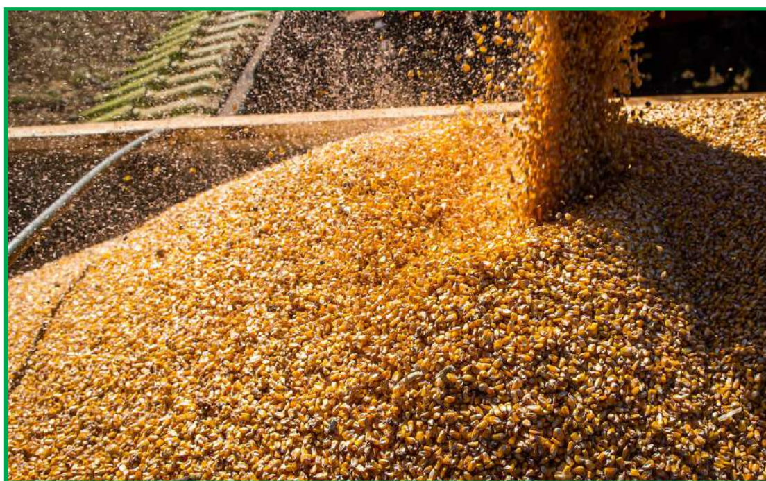
Levantamento da safra 2023/24 foi divulgado pela Conab

Entre as principais culturas acompanhadas pela Conab, o arroz apresenta, inicialmente,