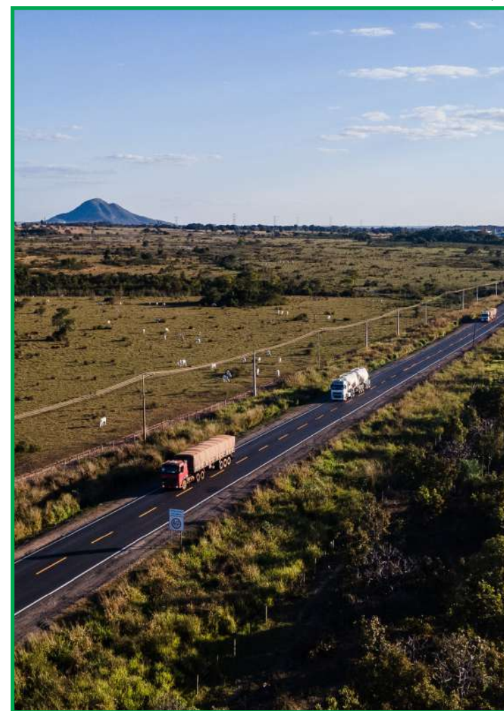
Trechos de duplicação em MT