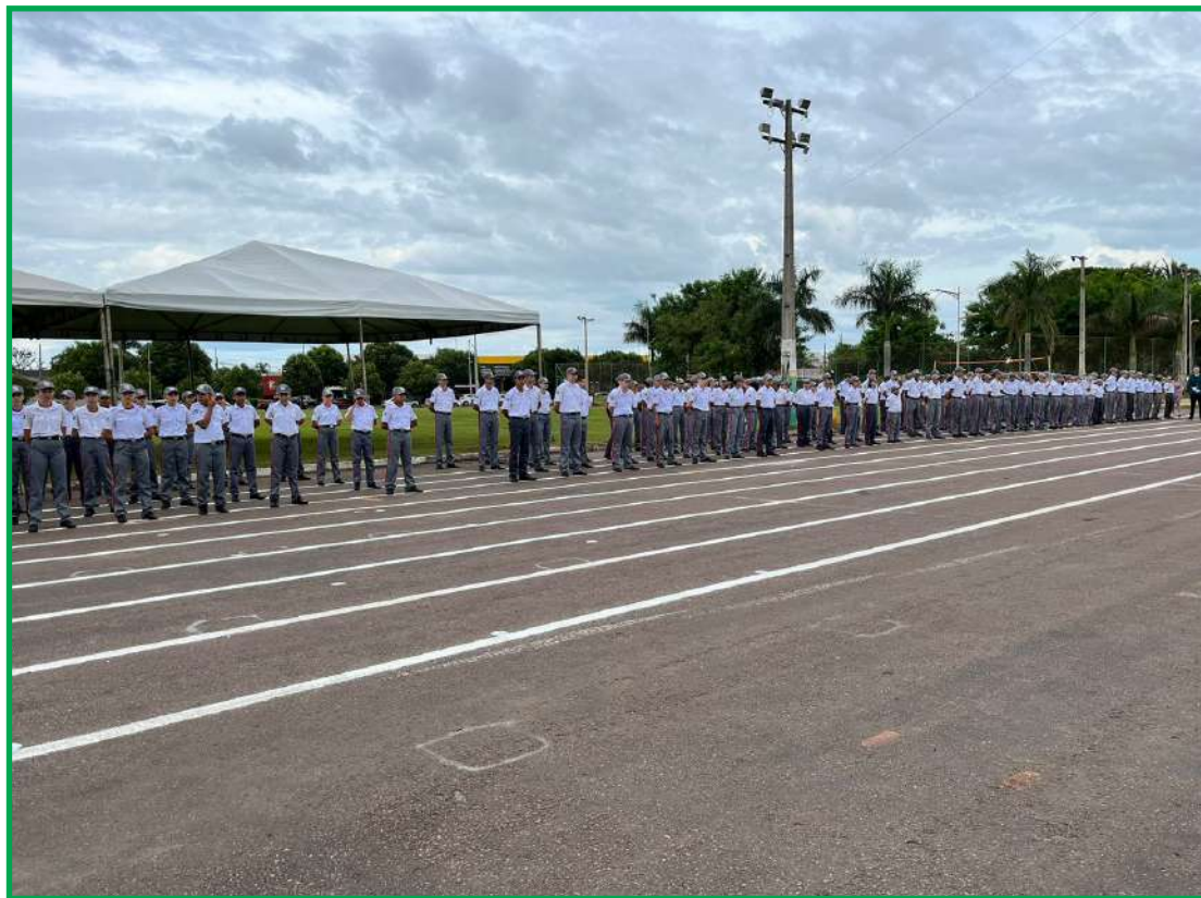
Escola Militar Tiradentes em Sinop

A organização e execução do Processo Seletivo será conduzido pela Secretaria-Adjunta de