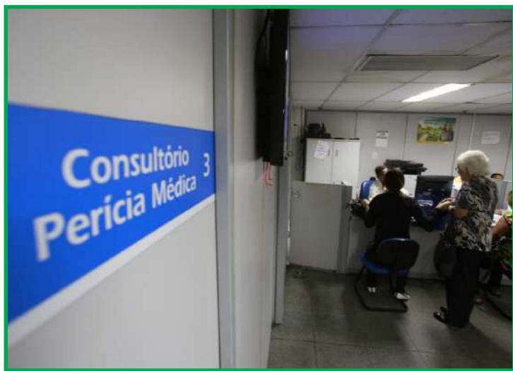
Agendamento pode ser feito por telefone ou online

As agências de Tangará da Serra, Várzea Grande e Cuiabá-Centro em Mato Grosso também realizarão antecipações de perícia médica ao longo do mês de outubro. Porém, nesses casos, as agências que ligarão para as pessoas com maior tempo de espera por perícia. É essencial que o cidadão mantenha o cadastro no INSS sempre atualizado para não perder nenhuma ligação.