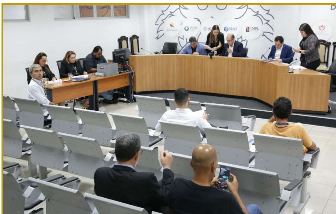
Cavalhada em Poconé: patrimônio cultural

de pertencimento do povo poconeano à cultura local, assim como a relação que as pessoas desenvolvem com esse evento cultural, que abrange a compreensão do passado, presente e futuro, de modo que a memória coletiva e individual é revivida e respeitada, assumindo a relação que estabelece entre as pessoas, a sociedade e a herança cultural que recebem e que projetam no futuro”, justifica o autor do projeto.