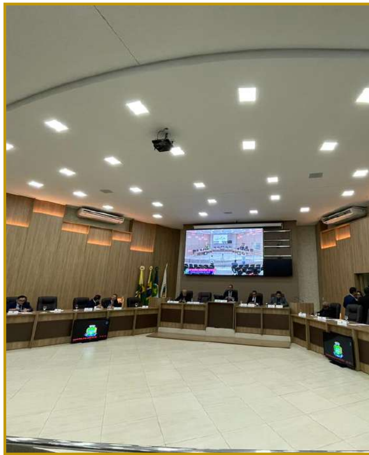
Projeto de Lei foi aprovado pelos vereadores