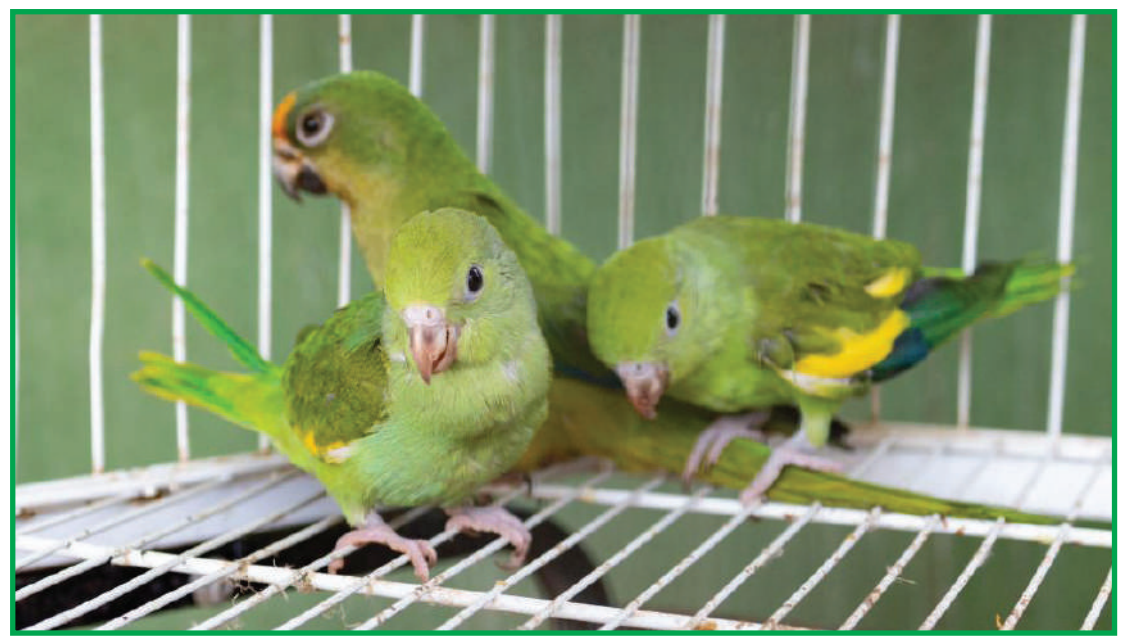
Animais silvestres devolvidos à natureza

resgatado pela Batalhão de Polícia Militar de Proteção Ambiental (BPMPA) no bairro Santa Rosa, em Cuiabá, preso a uma rede e encaminhado para uma clínica, onde se verificou apenas ferimentos leves. Após alta, foi solto em uma região de mata em Chapa-