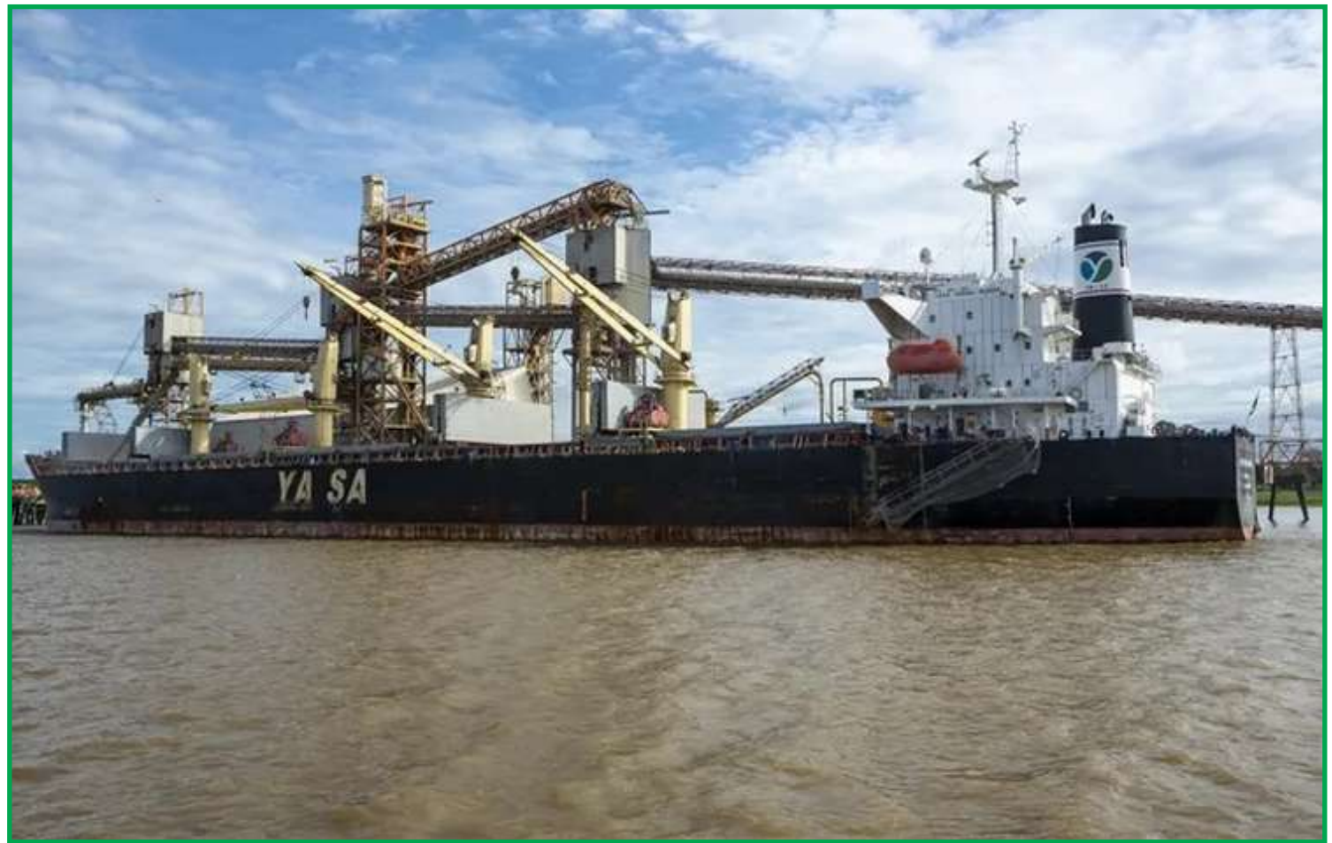
Produtos estão sendo redirecionados aos portos de Santos e Paranaguá

“Ao fazer a compra do produto do agricultor, a trading calcula a melhor logística e paga o valor resultante do porto menos as despesas até a origem. Nesse caso ela já fechou, já comprou. Então, ela não tem como nesse momento transferir esse custo ao produtor. Mas, ao longo do ano que vem ela com certeza vai praticar preços menores para recuperar esse valor que está sendo pago”, explica.