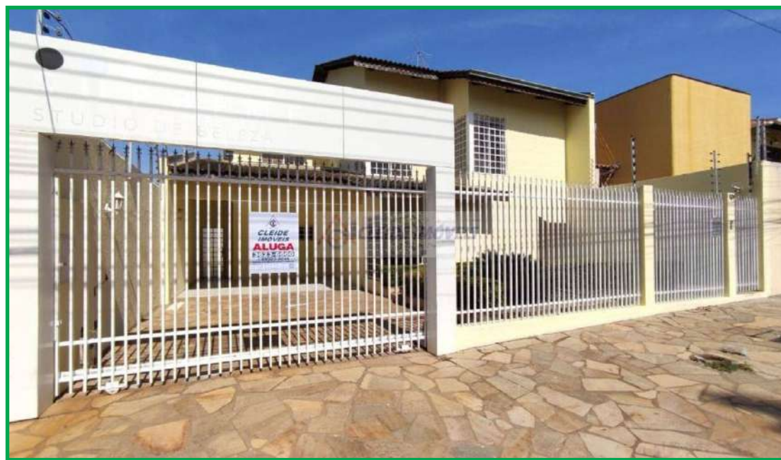
IGP-M, da FGV, acumula -4,46% desde janeiro

Para Braz, esse comportamento deve influenciar os preços às famílias na próxima medição. “Essas