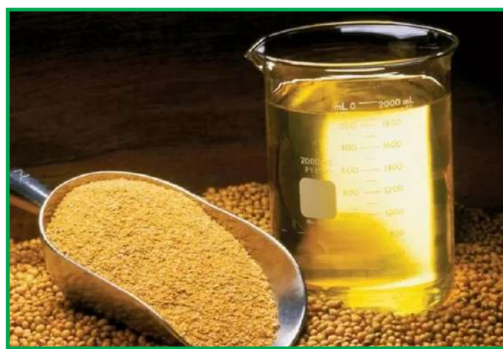
Acréscimo verificado em outubro é creditado à alta nas cotações do produto na bolsa de Chicago

“O recuo foi pautado pela queda no preço da soja em grão, que na parcial de outubro de 2023 (média até o dia 27) exibiu redução de 12,55% ante o mesmo período de outubro de 2022”, explica o Imea. O instituto salienta ainda que o aumento registrado nos preços mensal dos subprodutos da soja influenciou ainda na margem bruta das indústrias em outubro de 2023, que apresentou avanço de 4,49% no comparativo mensal.