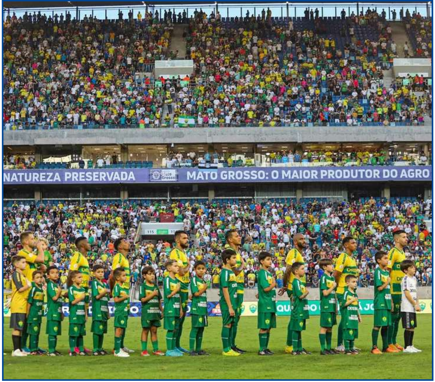
Média é superior a 17 mil por rodada

“Busco motivar e apoiar meus companheiros mesmo atuando pouco. Fico muito feliz em poder fazer parte desse elenco. É um grupo de grandes jogadores, que almejam grandes feitos com a camisa do time”, completou.