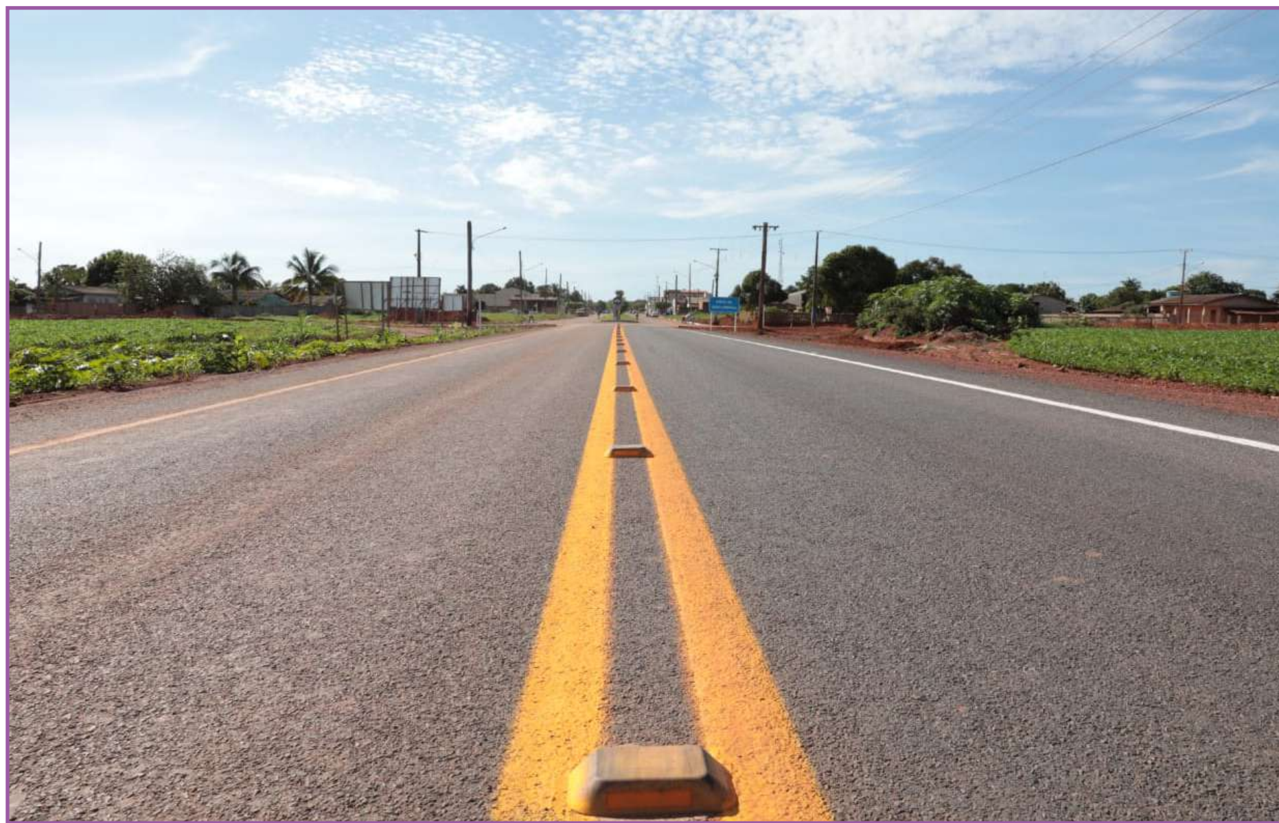
MT-140 se torna importante corredor logístico para o estado