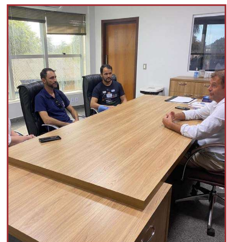
Processo da expansão da vigilância deve ser concluído no ano que vem