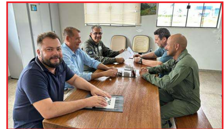
Papai Noel pelos ares em Sorriso