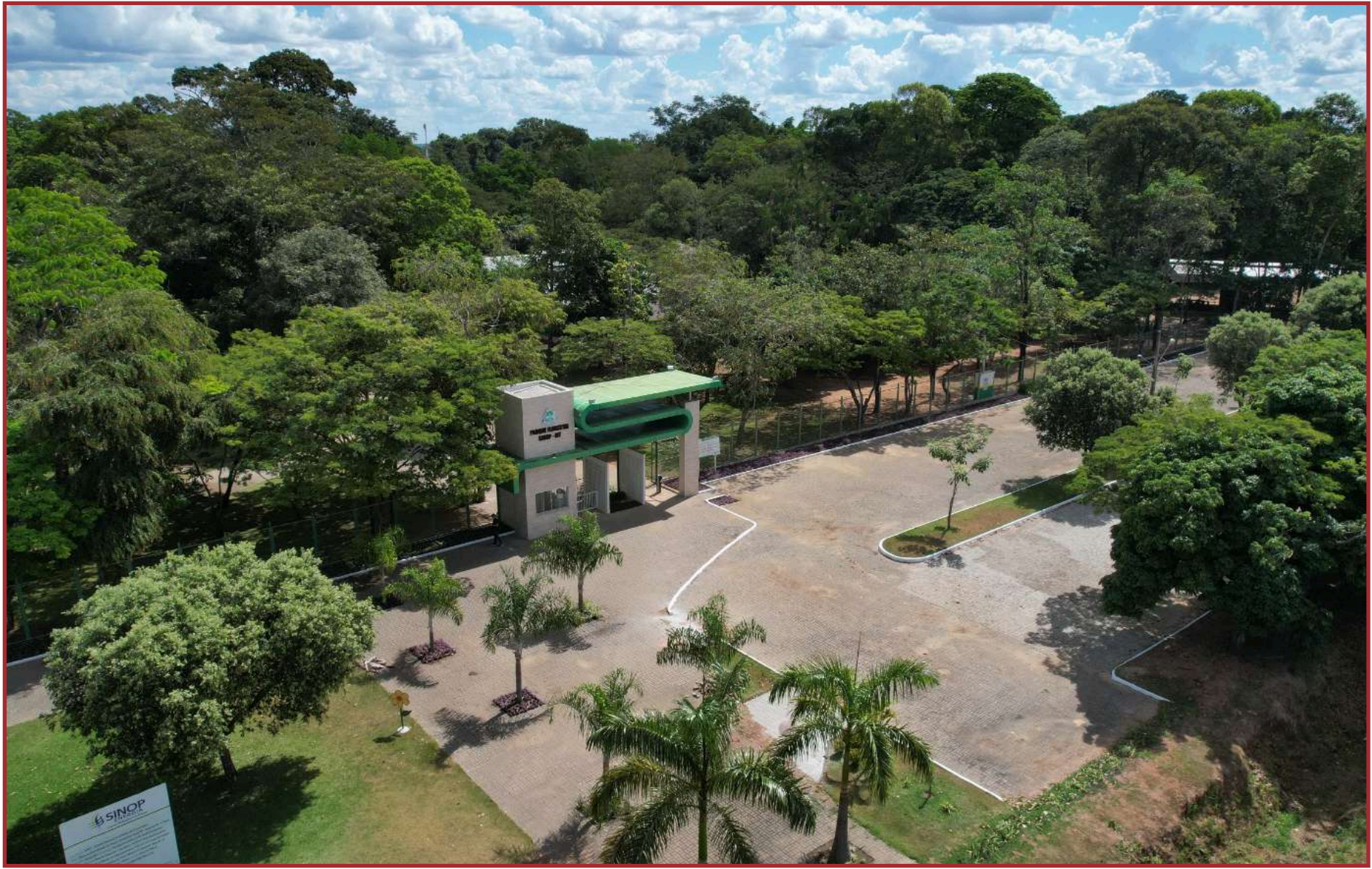
O projeto é uma iniciativa da Empaer

de 2022 e após realização da seleção das propriedades e cadastramento das mesmas, deu-se início ao processo de capacitação con-