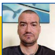
POR LEANDRO CARECA

O senador Sergio Moro (União-PR) utilizou as suas redes sociais na segunda (6) para criticar a prova do Exame Nacional do Ensino Médio (Enem), aplicada domingo. Segundo ele, a avaliação teria tido uma “doutrinação ideológica” e teria sido “mal redigida”. Moro, porém, escreveu incorretamente o nome do exame, que é aplicado anualmente desde 1998, chamando-a de “prova do ENEN”. Após internautas compartilharem a publicação do senador e ironizarem o erro, Moro corrigiu a postagem feita no X (antigo Twitter), colocando o nome correto: Enem. Ao entrar na publicação, aparece uma mensagem que ela foi editada às 20:31 de segunda. Mas Moro não foi o único parlamentar a errar. A ex-senadora Kátia Abreu também escreveu “ENEN” em uma postagem onde criticava questões da prova. Outro “cãtedra da língua portuguesa”, o deputado federal José Medeiros (PL-MT) também não escapou do erro. Segundo ele, um item do “ENEN” demonizava o agronegócio. Medeiros também escreveu “porquê” incorretamente. O certo seria “Por que isso é importante”.