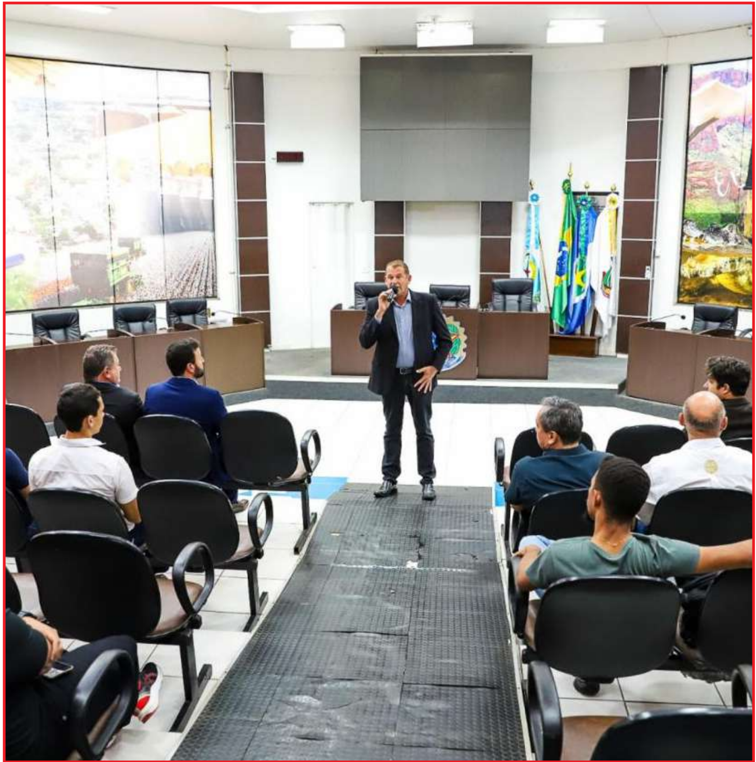
Primeira escola do interior de MT em Sorriso

"Essa é uma escola que vai além da grade curricular com aulas de ciências da natureza, ciências humanas, linguagens e matemática um currículo provoca o desenvolvimento da criatividade, autonomia e empreendedorismo, através da educação científica, tecnológica integrada e ferramentas educacionais para o futuro. Sorriso é o primeiro município do interior a ser contemplado com uma escola que é referência no Brasil", concluiu o gestor.