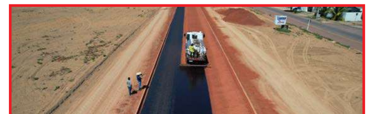
Fase de aplicação de material asfáltico na via

PROJETO QUE VEDA EXIGÊNCIA DE CONTRIBUIÇÃO SINDICAL É APROVADO NA CAE