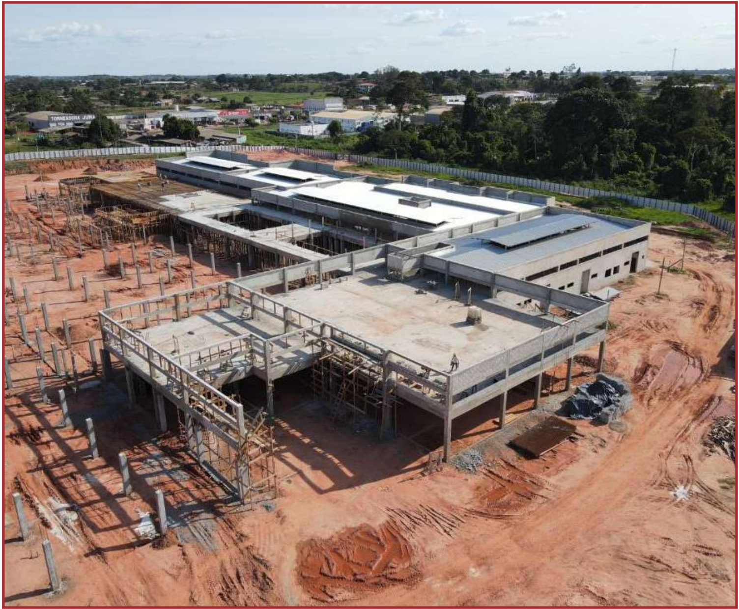
Hospital Regional de Juína está com 22% de execução

O Hospital Regional de Tangará da Serra está com 18% da obra realizada e já foram aplicados R$ 21,8 milhões para a execução da obra. Foram concluídas a limpeza de terreno, a terraplanagem, instalação de tapume e execução do canteiro de obras, montagem das estacas, blocos e armação da viga de baldrame, fundação do bloco e execução do muro. Está em execução os pilares, estrutura de fundação de fôrmas e concretagens, execução de radier e lajes de cobertura, além de instalações de rede sanitária e ventilação. O investimento total no hospital será de R$ 119,2 milhões. As novas estruturas contarão com 111 leitos de enfermaria e 40 leitos de UTI – entre adulto,