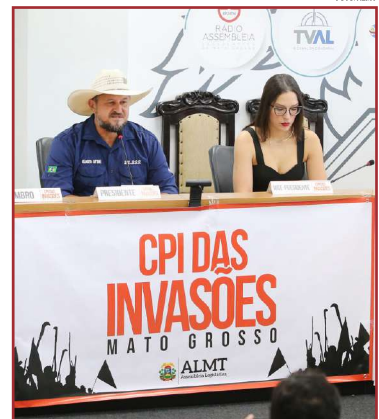
A definição ocorreu na manhã desta sexta-feira

competência, como as buscas e salvamentos, e o combate a incêndios, por exemplo", reforça o prefeito.