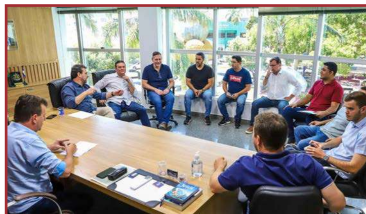
Serviço de Atendimento Móvel de Urgência em Sorriso

"Hoje, creditamos muitas e muitas vidas salvas ao excelente trabalho desempenhado por nossos heróis de farda, e, com o Samu, poderemos assumir parte deste trabalho, no que diz respeito ao atendimento médico de urgência e emergência em qualquer lugar, somar com os Bombeiros nas situações que necessitarem deste tra-