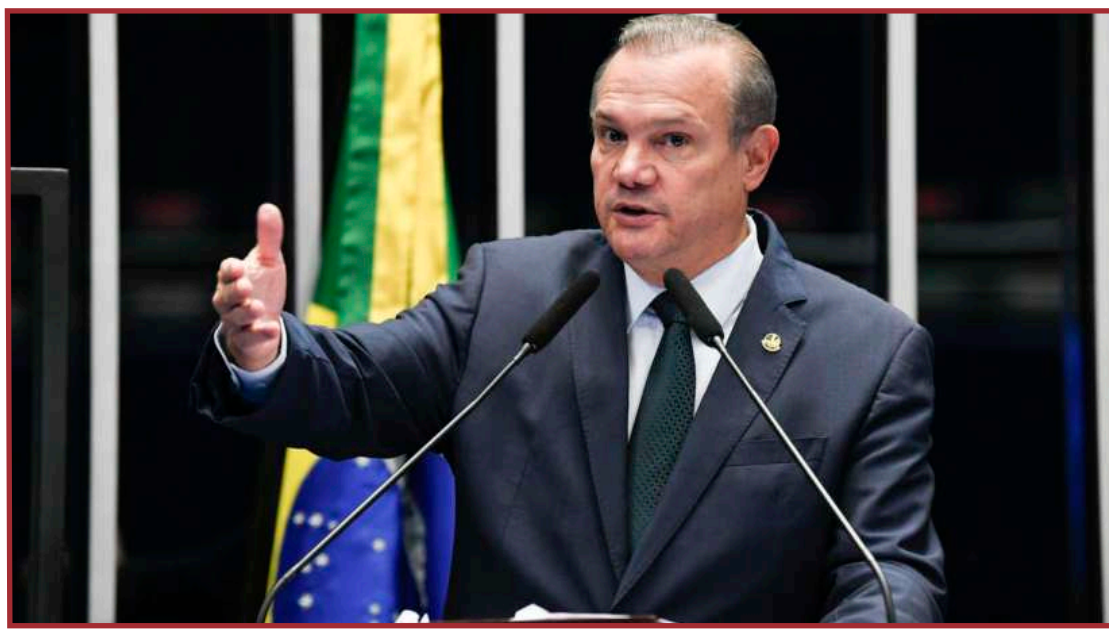
Senador diz vai gerar mais sonegação e prejudicar pequenos empreendedores

Conforme Fagundes, a reforma tributária beneficia as grandes corporações em detrimento do trabalhador. "Quem acaba levando vantagem não é o trabalhador e o pequeno e micro empresário, mas as grandes corporações, principalmente com uma reforma tributária que foi feita, ao nosso ver, lá na