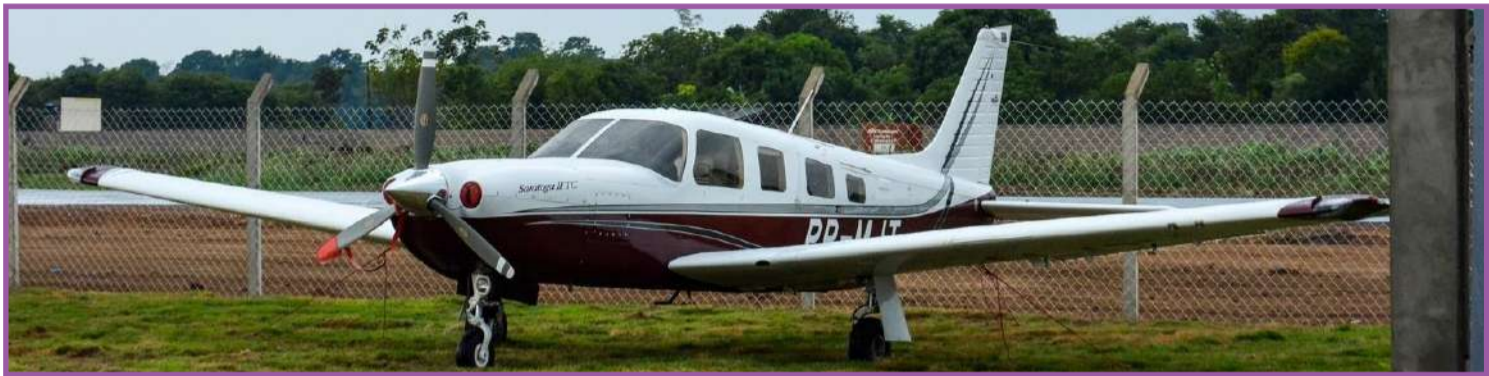
Proprietários de aerovanes poderão utilizar espaço

Dal'Bosco Empreendimentos irá cuidar de todos os negócios ligados ao setor de aviação, sendo responsável pela gestão e manutenção do aeródromo, além de toda