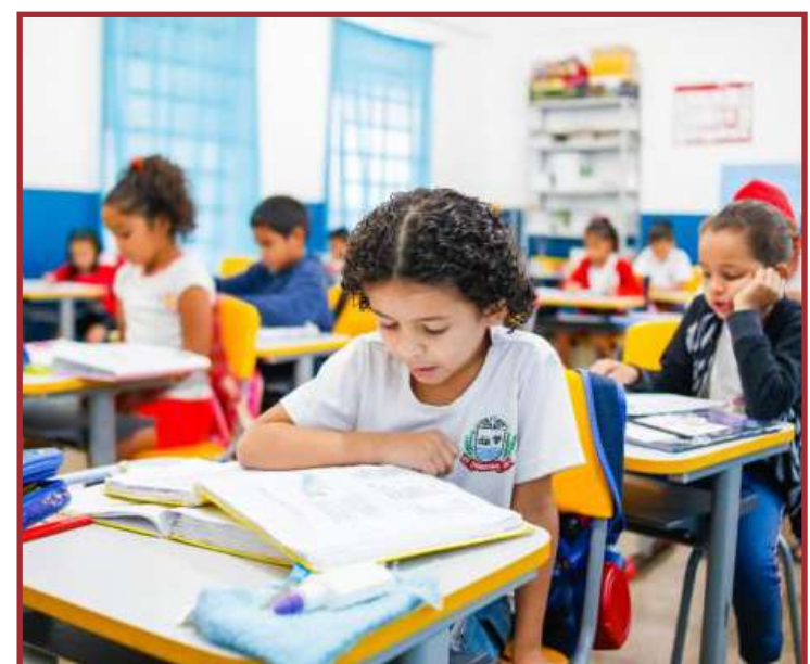
Serão realizadas do dia 27 de novembro ao dia 1 de dezembro