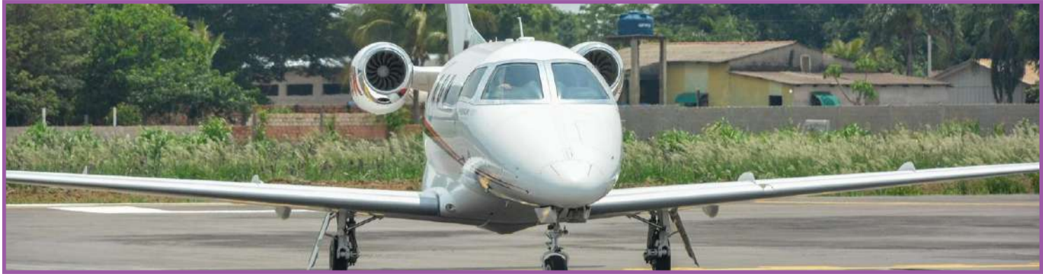
Jato pousando no Aeroporto DDA