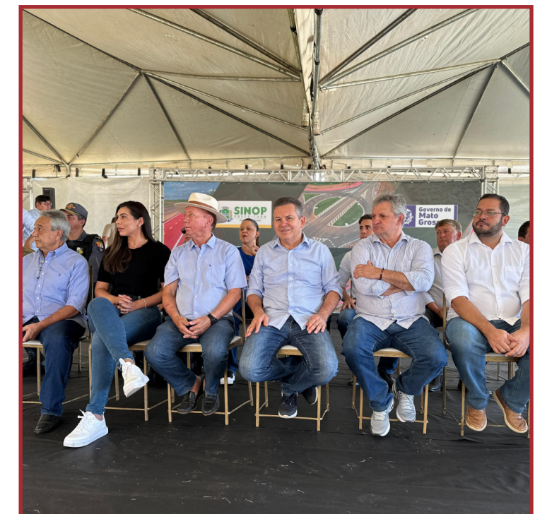
Obra na Estrada Nanci teve investimento de R$ 33 milhões

ECA, princípios da administração pública, dinâmica de grupo e outros temas. São dias para ampliar os conhecimentos acerca da função que devem desempenhar como conselheiros tutelares.