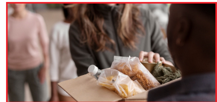
Ação vai receber alimentos não perecíveis e produtos de higiene pessoal