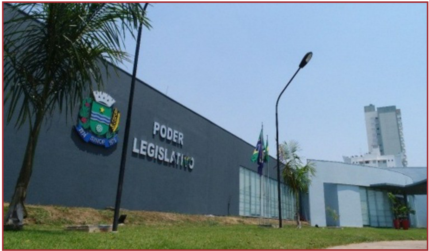
Foram ouvidas 710 pessoas em 23 regiões de Sinop

O MKT Pesquisa também quis ouvir dos entrevistados, o nível de satisfação com os atuais vereadores de Sinop. Questionando os eleitores sobre quem eles gostariam que continuassem para uma próxima legislatura. Neste cenário, 20% dos entrevistados disseram que gostariam que nenhum deles continuasse.