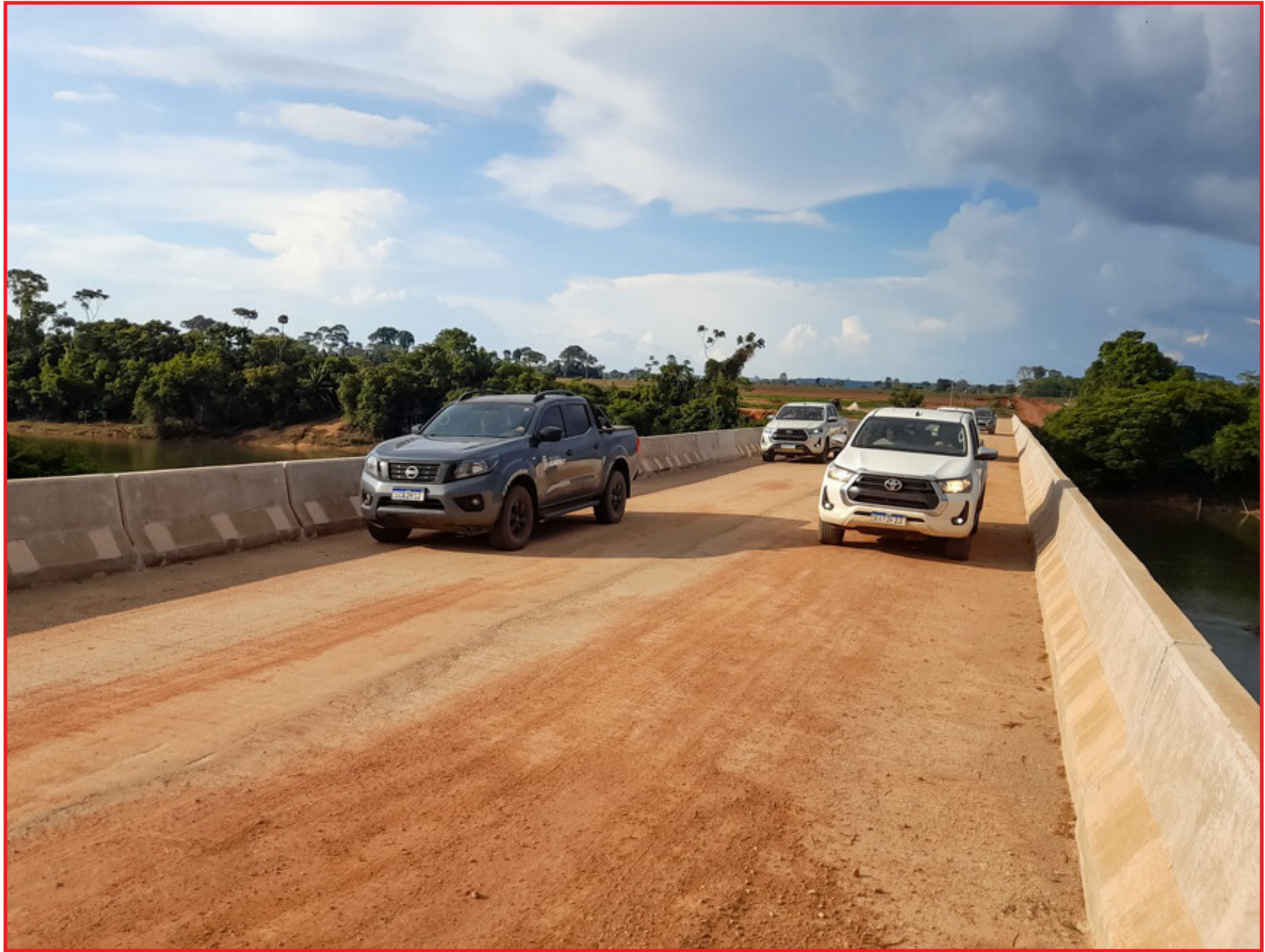
Ponte sobre o Rio dos Peixes em Juara