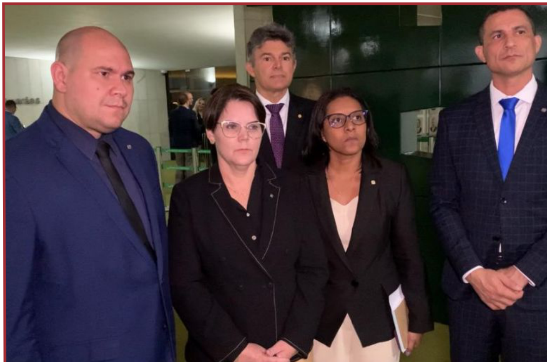
Deputados pretendem apresentar novas propostas para aumentar a segurança