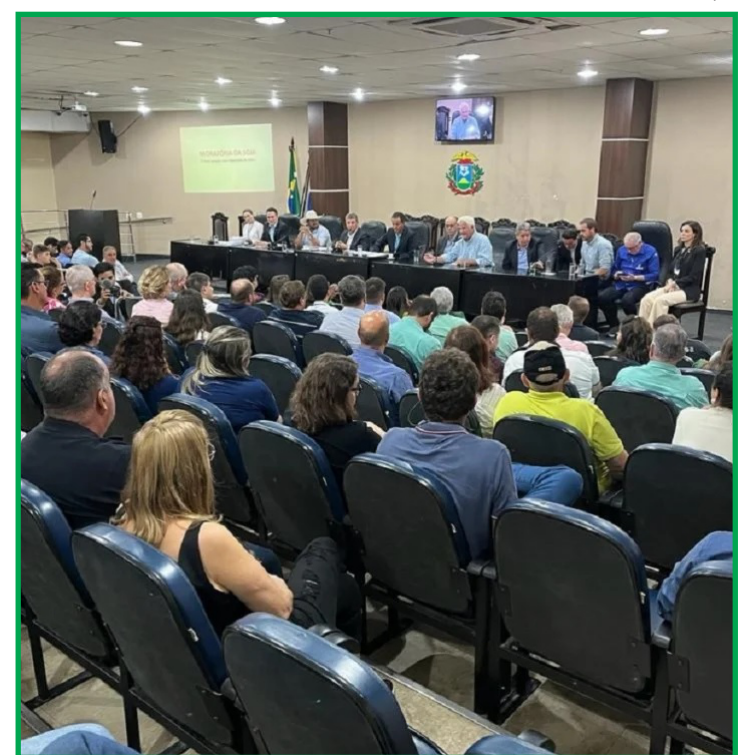
Pacto comercial tem afetado a comercialização de grãos dos produtores na região do bioma amazônico