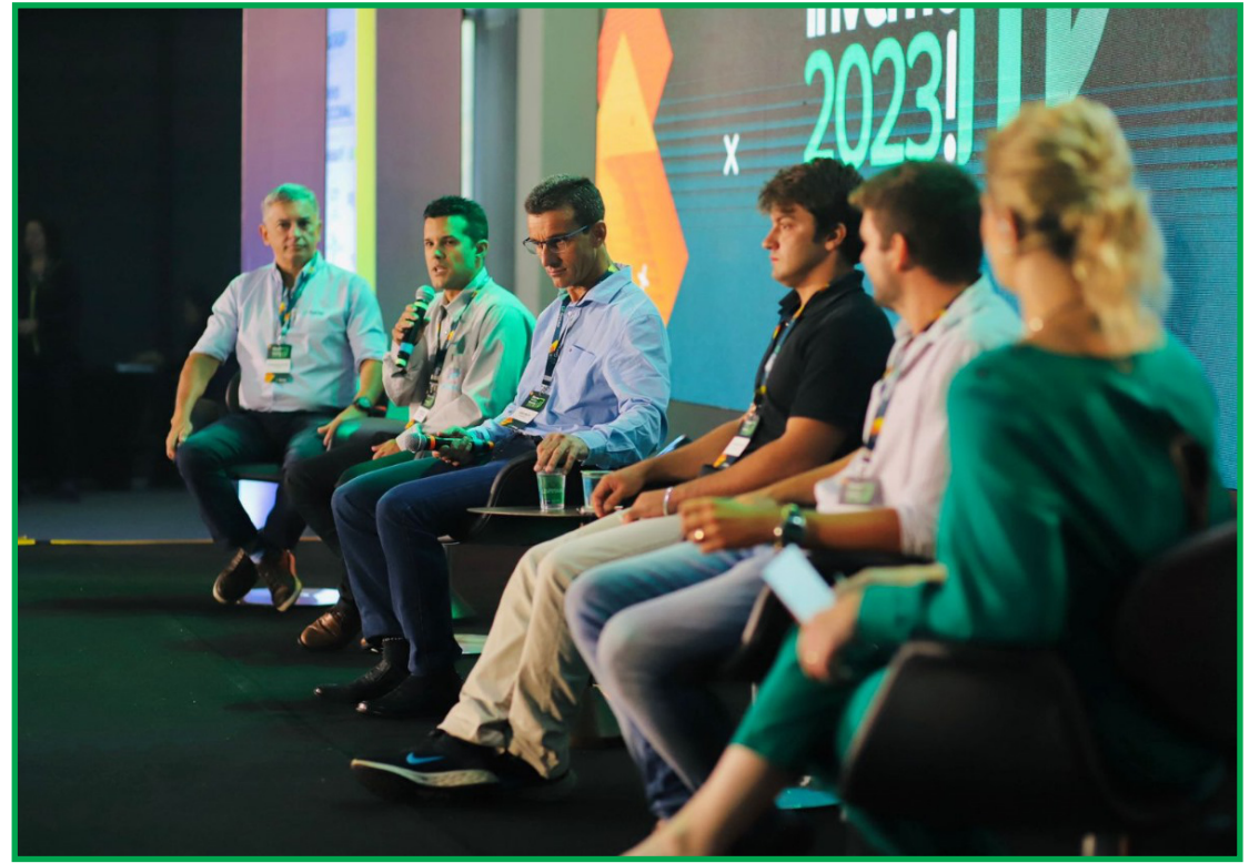
Os vencedores da temporada inverno 2023 foram revelados em evento

Para isso, é promovido o concurso, onde a indústria e a cadeia do agronegócio se reúnem para premiar produtores com os mais altos níveis de pro-