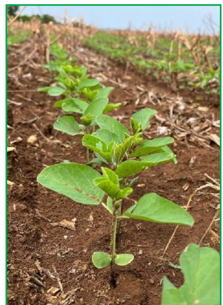
Atenções estão voltadas para o desenvolvimento da safra 23/24, segundo levantamento do Imea

(-6,69%), a cenoura (-5,66%) e o leite longa vida (-0,58%). Já a alimentação fora de casa subiu 0,32%, alta menor que a de outubro: 0,42%.