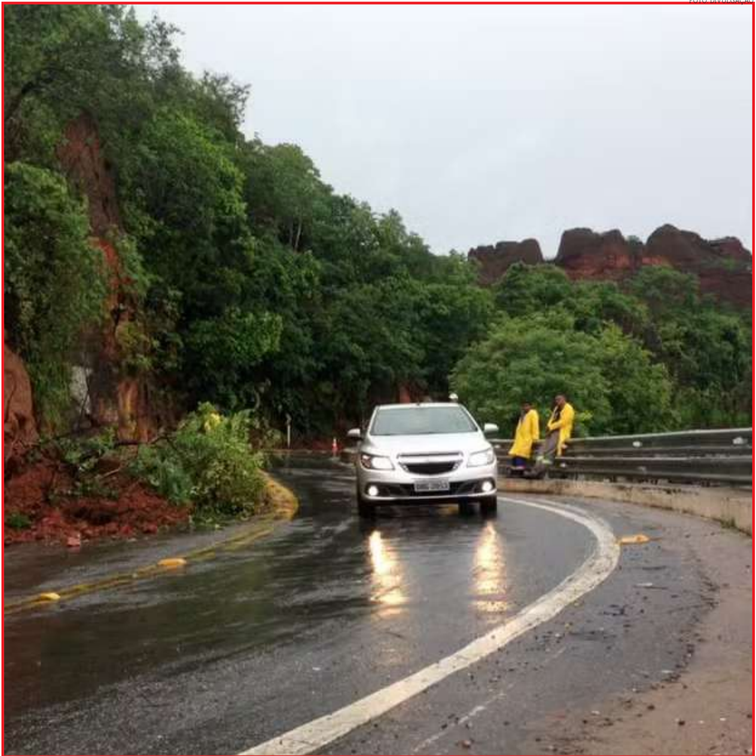
Decisão foi tomada pelo aumento significativo de fluxo de veículos de carga nas rodovias estaduais

O ICMBio informou por meio de nota que recebeu os relatórios de análise de medidas de redução de riscos na rodovia e que no início de dezembro realizou uma reunião com a Sinfra, em que ficou decidido que o licenciamento das obras propostas é de responsabilidade do órgão estadual e deve ser feito junto ao