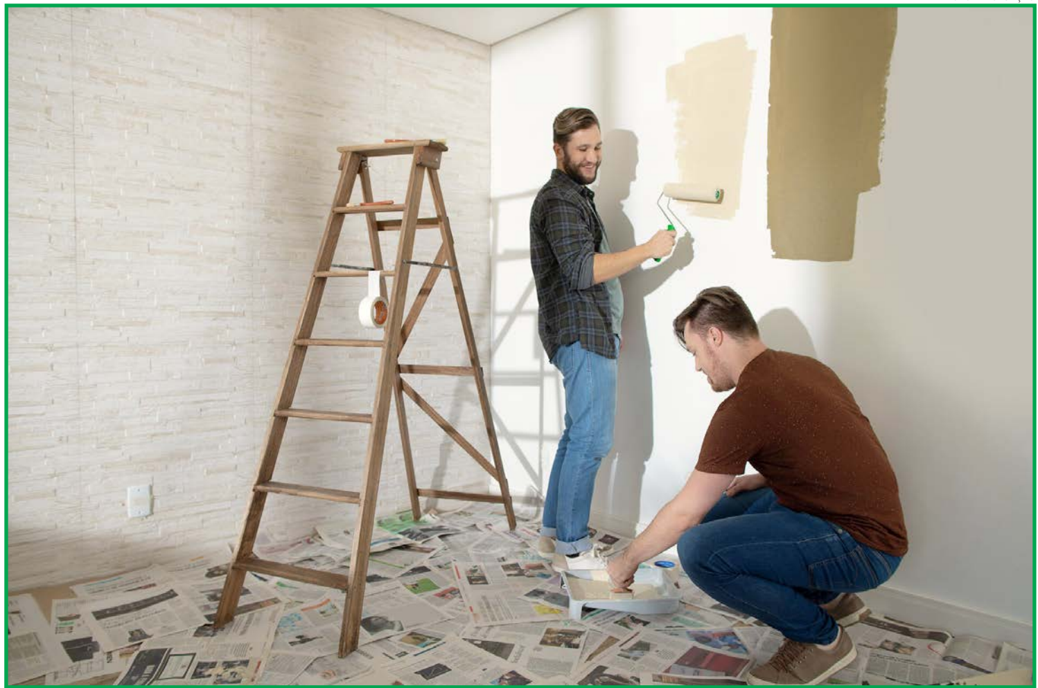
Em 10 meses, mais de 30 mil operações nesta modalidade foram feitas em todo o país

Ela orienta ainda que no momento da contratação da linha de crédito o associado deve levar o orçamento realizado para a construção ou reforma do imóvel e, após o crédito concedido, deve-se comprovar a destinação do recurso para as finalidades permitidas por meio da apresentação de notas fiscais.