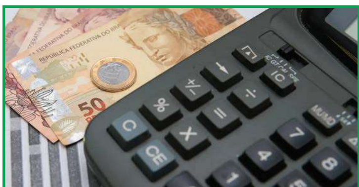
Calculado pelo IBGE, IPCA acumula 4,68% em 12 meses

mentação no domicílio subiram 0,75%, pressionados pela cebola (26,59%), batata-inglesa (8,83%), arroz (3,63%) e carnes (1,37%). Apresentaram queda o tomate