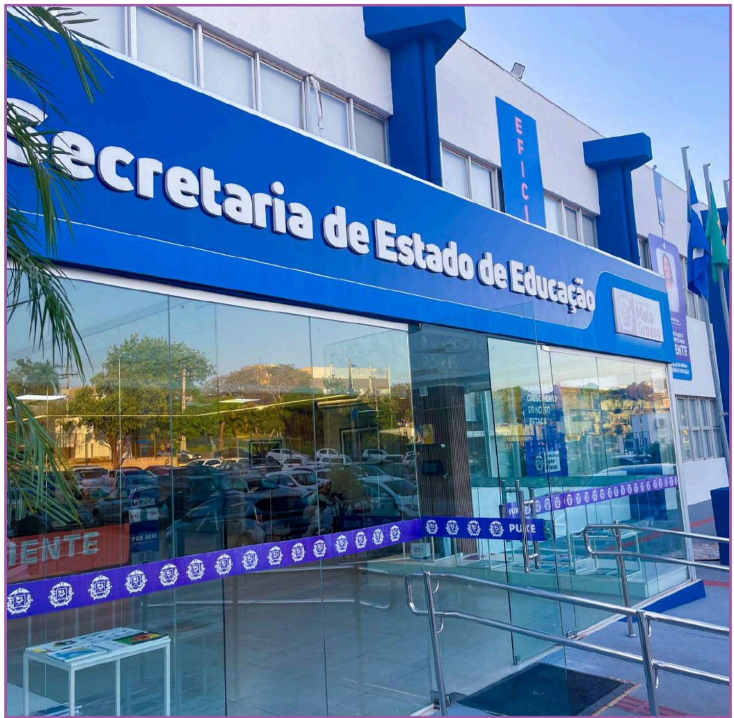
Para a concessão do benefício aos servidores da Seduc, serão investidos R$ 244,4 milhões