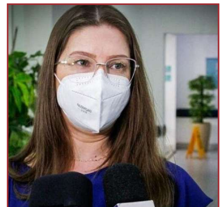
Governador afirmou que a servidora tentará provar sua inocência judicialmente

que a partir da licitação, deu início ao processo necessário à construção, e posterior financiamento pela Caixa Econômica Federal, dos apartamentos compostos por sala, dois quartos, cozinha, banheiro social e área de serviço, com área construída mínima de 45 m².