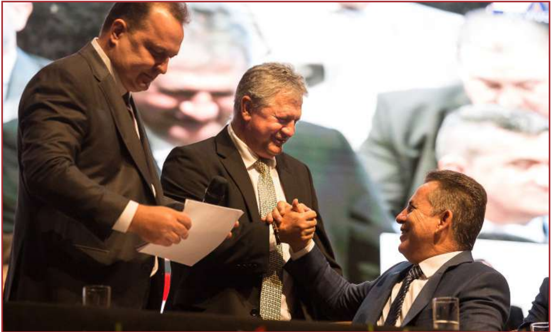
PRB em MT deve se tornar um partido satélite do UB