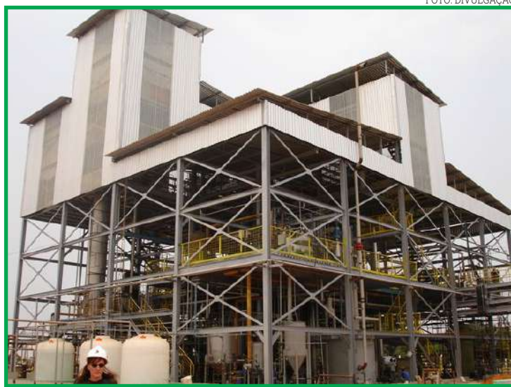
MT é o 5º com maior crescimento no setor industrial de janeiro a outubro

Os incentivos fiscais promovidos pela Sedec garantem segurança jurídica aos empresários e estimulam a