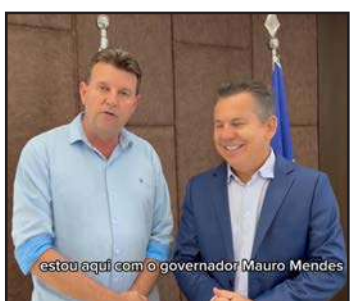
Estou aqui com o governador Mauro Mendes