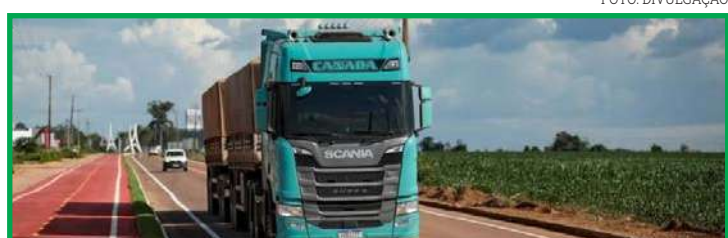
Cerca de 13,2 mil empresas transportadoras emitem o CT-e

A mudança de versão do programa abrange, também, o Conhecimento de Transporte Eletrônico para Outros Serviços (CT-e-OS) e a Guia de Transporte de Valores Eletrônica (GTV-e). Nesses casos, a quantidade de empresas que ainda não atualizaram seus sistemas é maior. Em relação ao CT-e-OS, das 1.859 em-