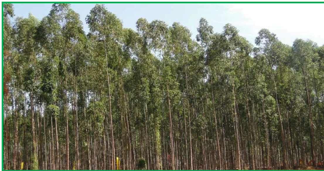
Clones de eucalipto para biomassa

"Hoje basicamente a silvicultura de eucalipto em Mato Grosso é pautada em três materiais. O H13, o VM01 e o 144. Tem um ou outro que vai bem em determinada região, mas esses três são os que se desenvolvem bem em todas as regiões. Então é um risco muito alto, caso surja al-