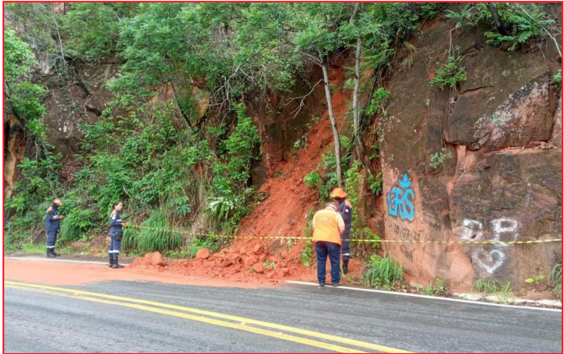
Comerciantes temem os impactos no comércio e turismo em Chapada dos Guimarães

O comércio também sente os efeitos da mudança de rota. O dono de supermercado, Alaerte Freitas, já sentiu o impacto no frete. O trajeto feito para buscar as verduras em Cuiabá aumentou, porque