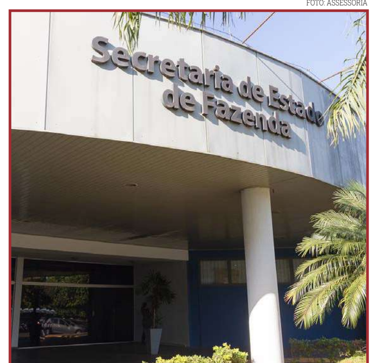
Empresas foram notificadas em R$ 150 mi pelo ICMS devido nas operações