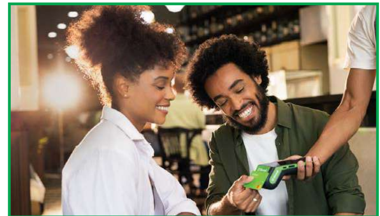
Consumidor: preste atenção nas transações

"Não clicar em links ou baixar arquivos recebidos por e-mail. Evitar realizar transações via redes de wi-fi públicas e jamais compartilhar senhas em redes sociais, principalmente whatsapp", diz ela ao alertar sobre qualquer tipo de taxa que apareça ao fim da transação, pois o pix deve ser oferecido gratuitamente para pessoas físicas, com limite de 30 transações por mês, por todas as instituições financeiras. Já