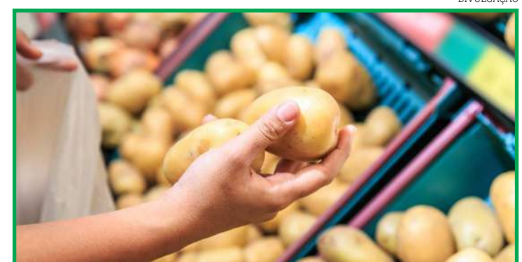
Custo subiu 2,55%

Outro item com forte elevação de preço médio é o café, de 4,25%. Ainda conforme análise o IPF-MT, o mercado internacional demonstra grande impacto sobre as variações observadas internamente, o que pode estar atrelado à variação nesta semana, assim como as previsões climáticas, gerando o crescimento no preço médio nessa comparação.