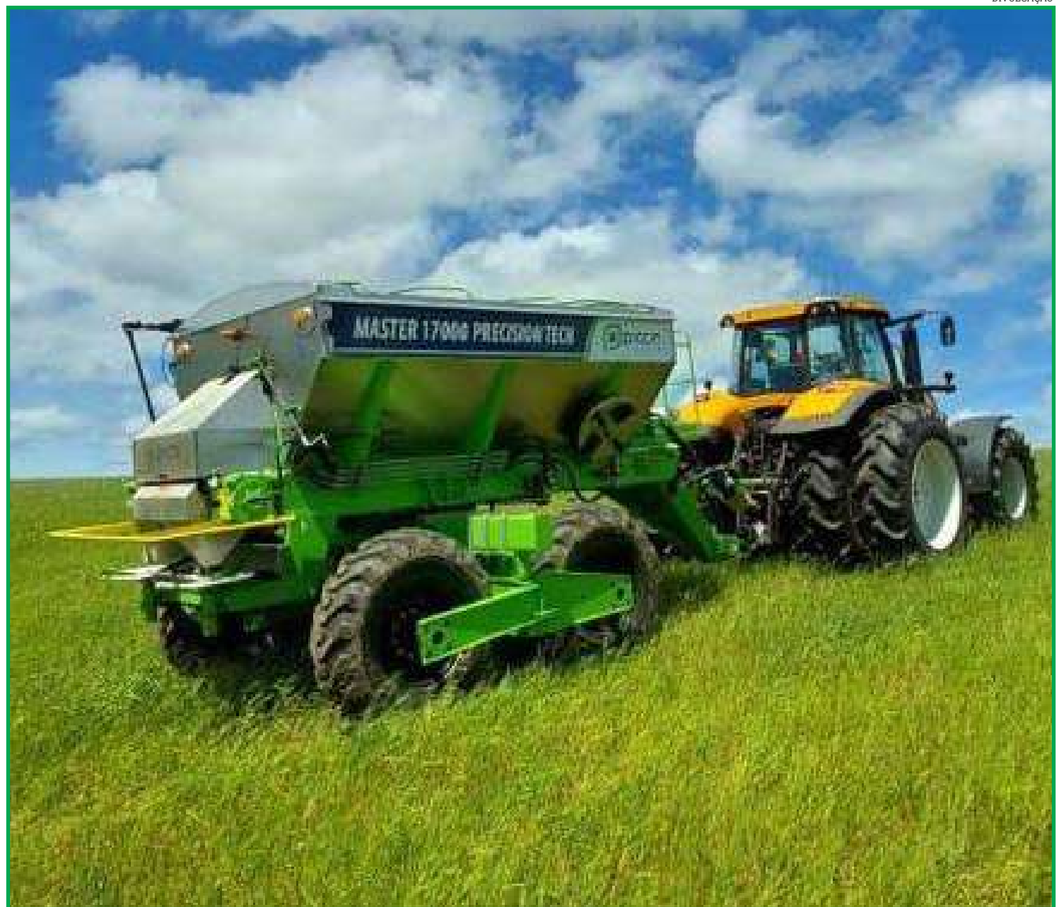
Uso racional e eficiente de insumos é fundamental para o produtor rural alcançar maior rentabilidade

O profissional da Piccin explica ainda que ao fazer a operação após o plantio, há a possibilidade de adubar com nutrientes específicos, conforme a necessidade das plantas. “Mesmo que tenha feito na semeadura, poderá ter a complementar, às vezes