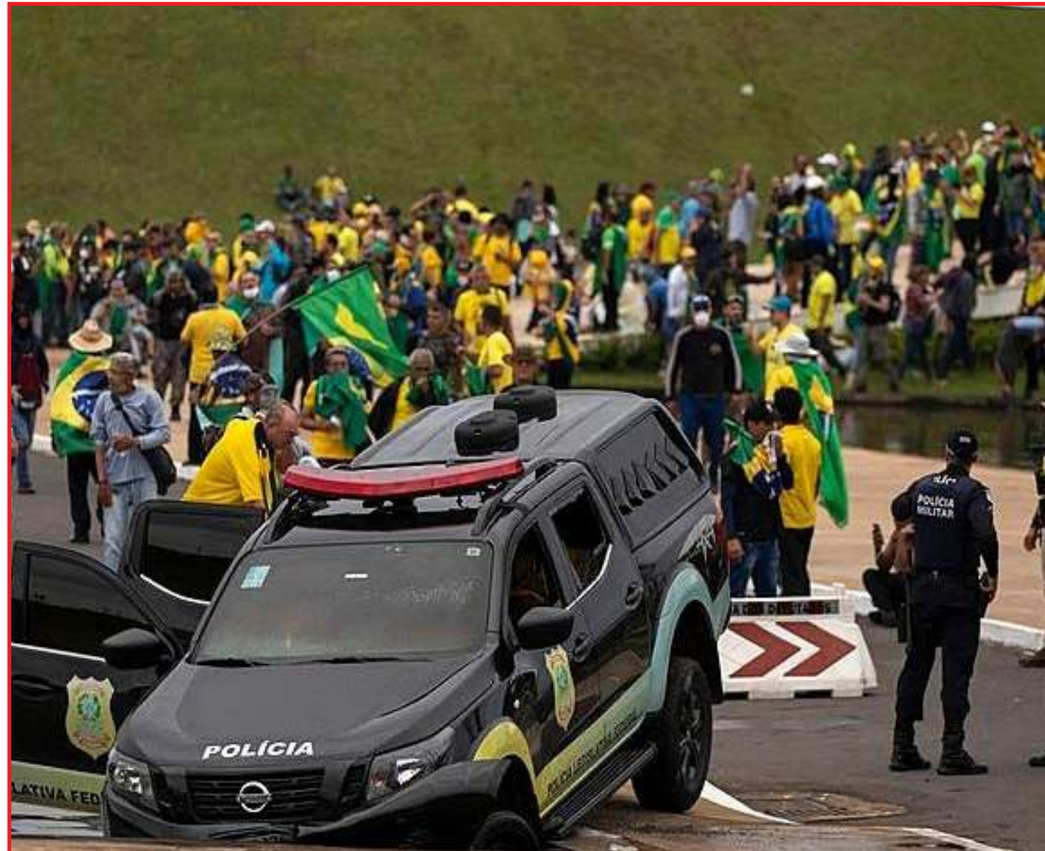
Agentes cumpriram 46 mandados de busca e apreensão e dois de prisão em 12 estados