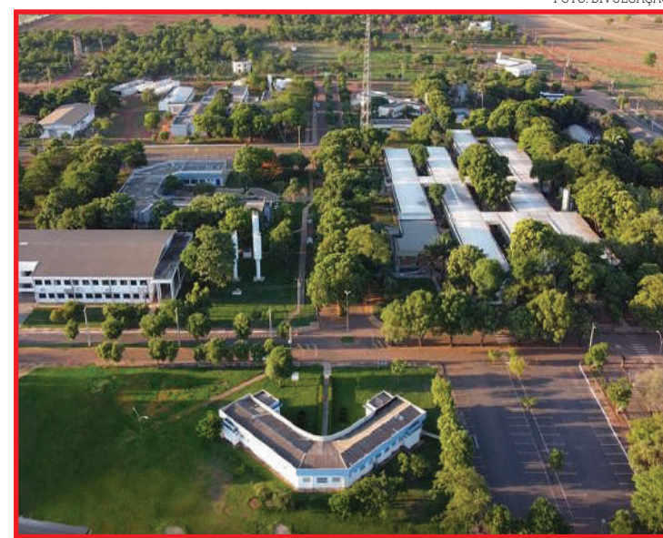
Candidatos devem se inscrever até o dia 16 pelo site da universidade

Um guia completo de Sinop. Tudo o que você procura a um clique!