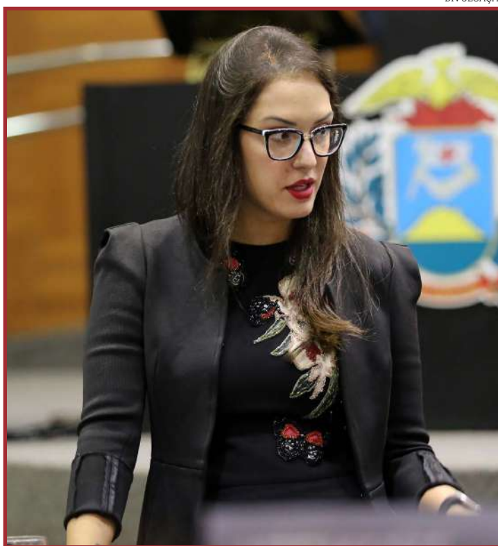
A Deputada fala em último mandato na AL