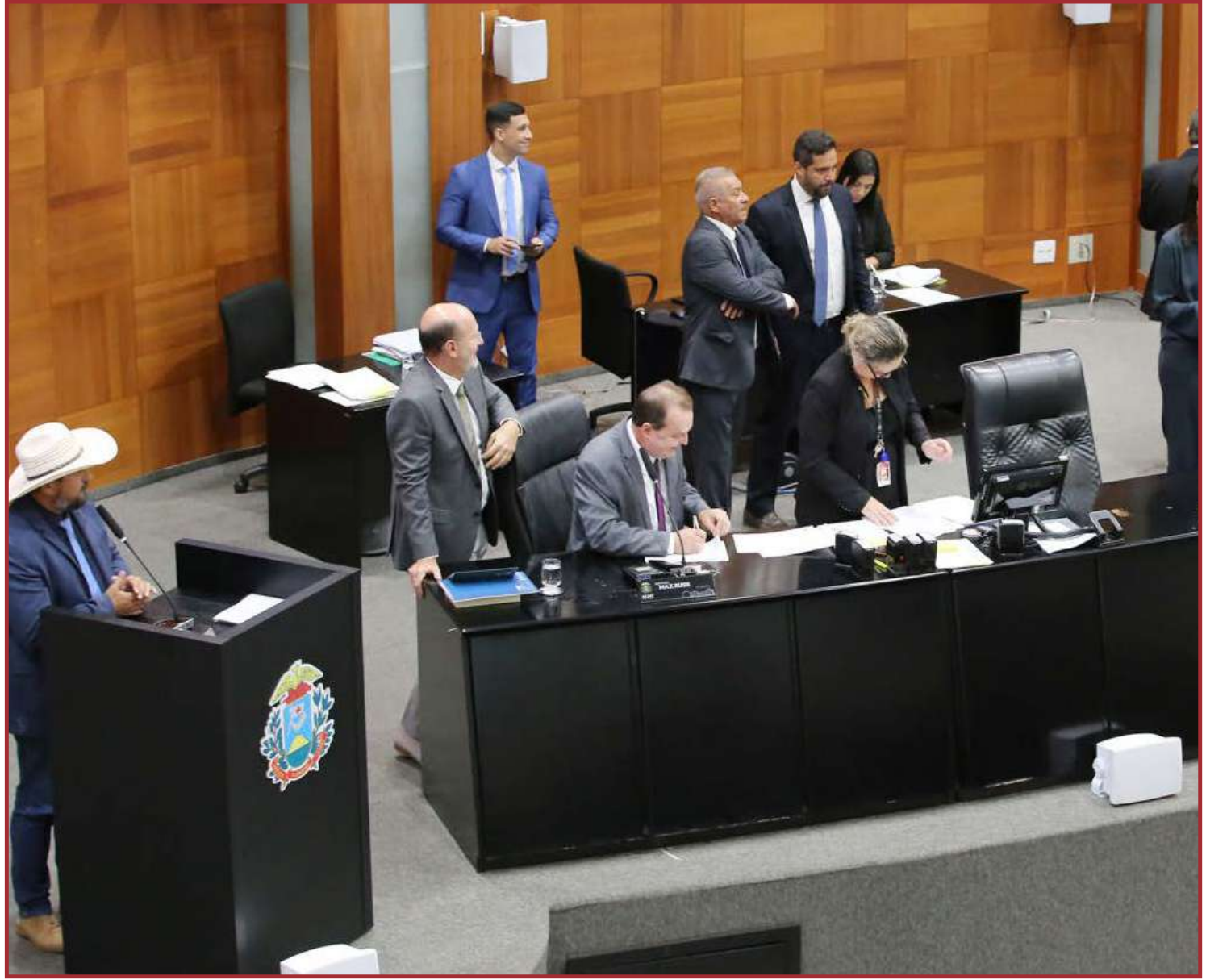
O texto ainda recebeu três votos contrários e uma abstenção

Para que a realocação seja autorizada, são necessários requisitos como ter dimensão igual ou superior a 10% da área da reserva local realocada, possuir vegetação nativa preservada ou regenerada, estar localizada