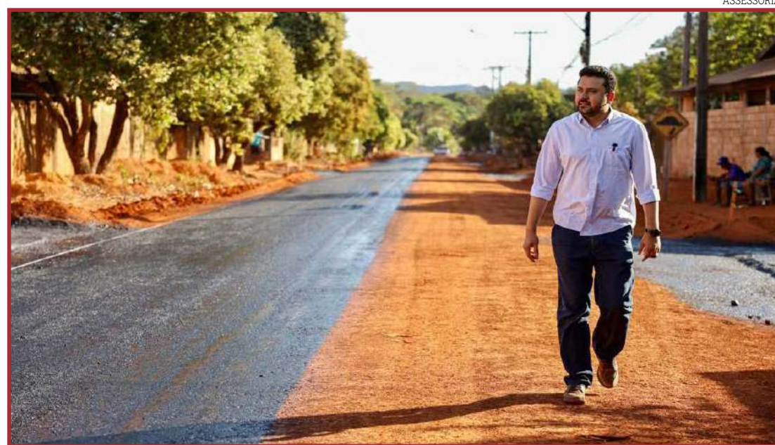
Asfalto em ruas do bairro Maria Antônia

O projeto compreende mais de 19,7 mil m 2 de drenagem e pavimentação. O investimento total foi de aproximadamente R$ 2,1 milhões, em parceria com a secretaria estadual de Infraestrutura. "É uma conquista para os moradores e um presente para nossa cidade. Juntos vamos transformar nossa cidade cada dia mais forte", disse. A drenagem e asfaltamento começaram