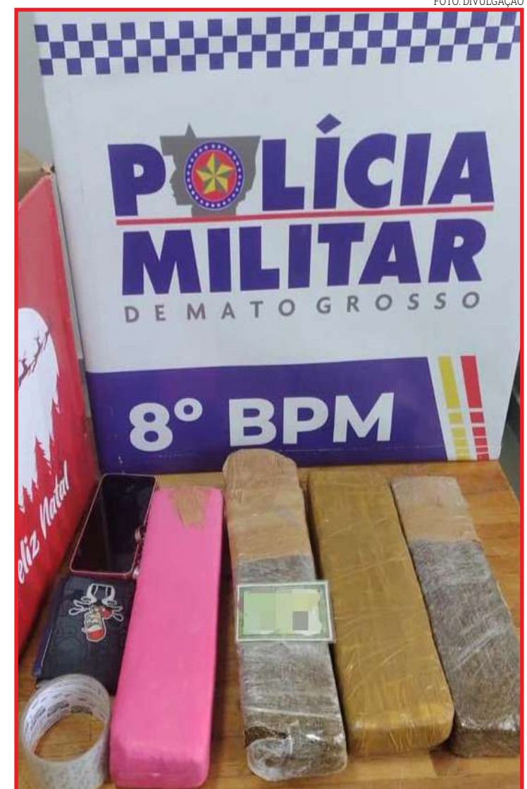
Suspeito afirmou aos policiais que estava levando as drogas para uma região de garimpo