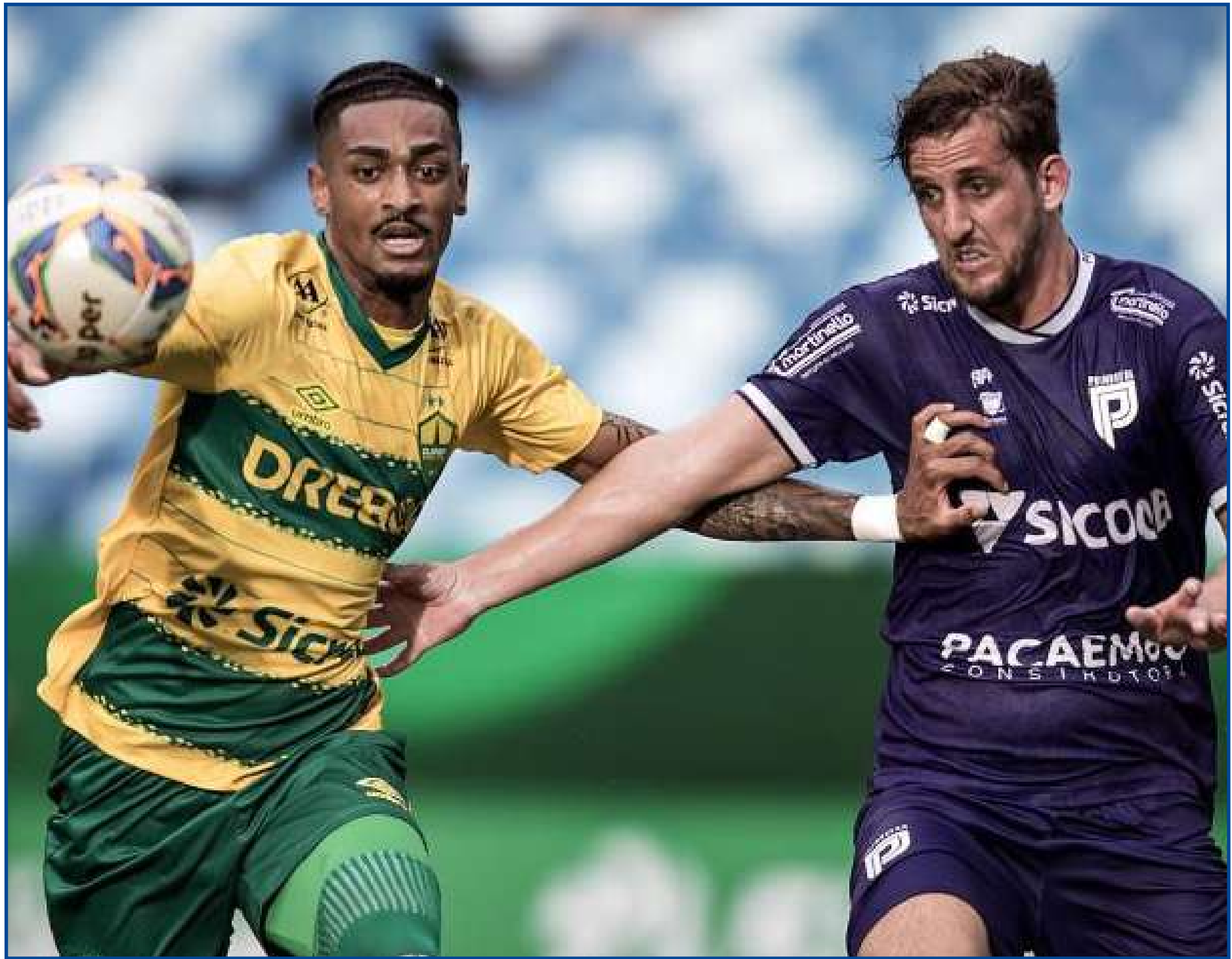
Cuiabá empatou em 1 a 1 com o Primavera

"O Sicredi, como instituição financeira cooperativa comprometida com o desenvolvimento social e econômico das comunidades onde está inserida, caminha junto com o futebol estadual há mais de 10 anos. Entendemos que o esporte tem papel fundamental