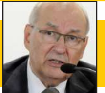
IVES GANDRA MARTINS

Assim são os empreendedores brasileiros, quando a doutrina econômica mostra que não podem crescer, crescem, pois tem a sabedoria da reinvenção