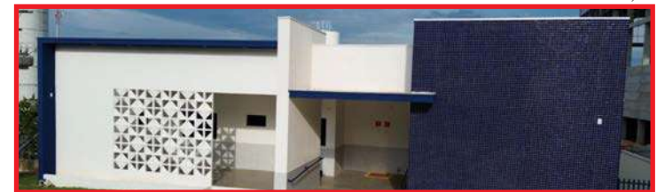
Sorriso receberá reforço de duas novas unidades básicas de saúde