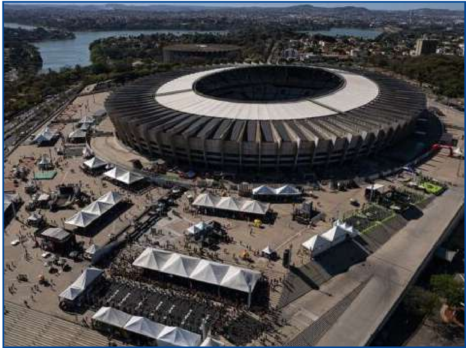
Precaução em BH para receber duelo de torcidas encrenqueiras

Outro aspecto decidido foi o da alimentação. Antes de deixarem o Mineirão, os torcedores dos dois times farão um lanche. “Cada um receberá uma marmitta”, diz o coronel. E a torcida do time derrotado sairá primeiro do estádio. A vencedora somente deverá