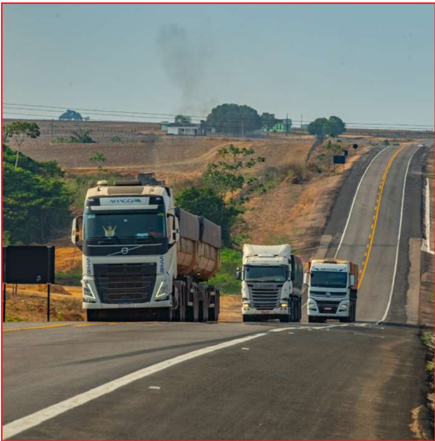
Concessão deu qualidade ao trecho entre Sinop e o Pará

Para melhor compreender os benefícios que os investimentos da concessionária Via Brasil BR-163 traz, nada melhor que ver o antes e depois. Essas transformações você pode confirmar com quem conhece o trecho de longa data mas também checar nos registros fotográficos. Veja por exemplo, como era a situação do trecho paraense entre Castelo dos Sonhos (distrito de Altamira) e Novo Progresso.