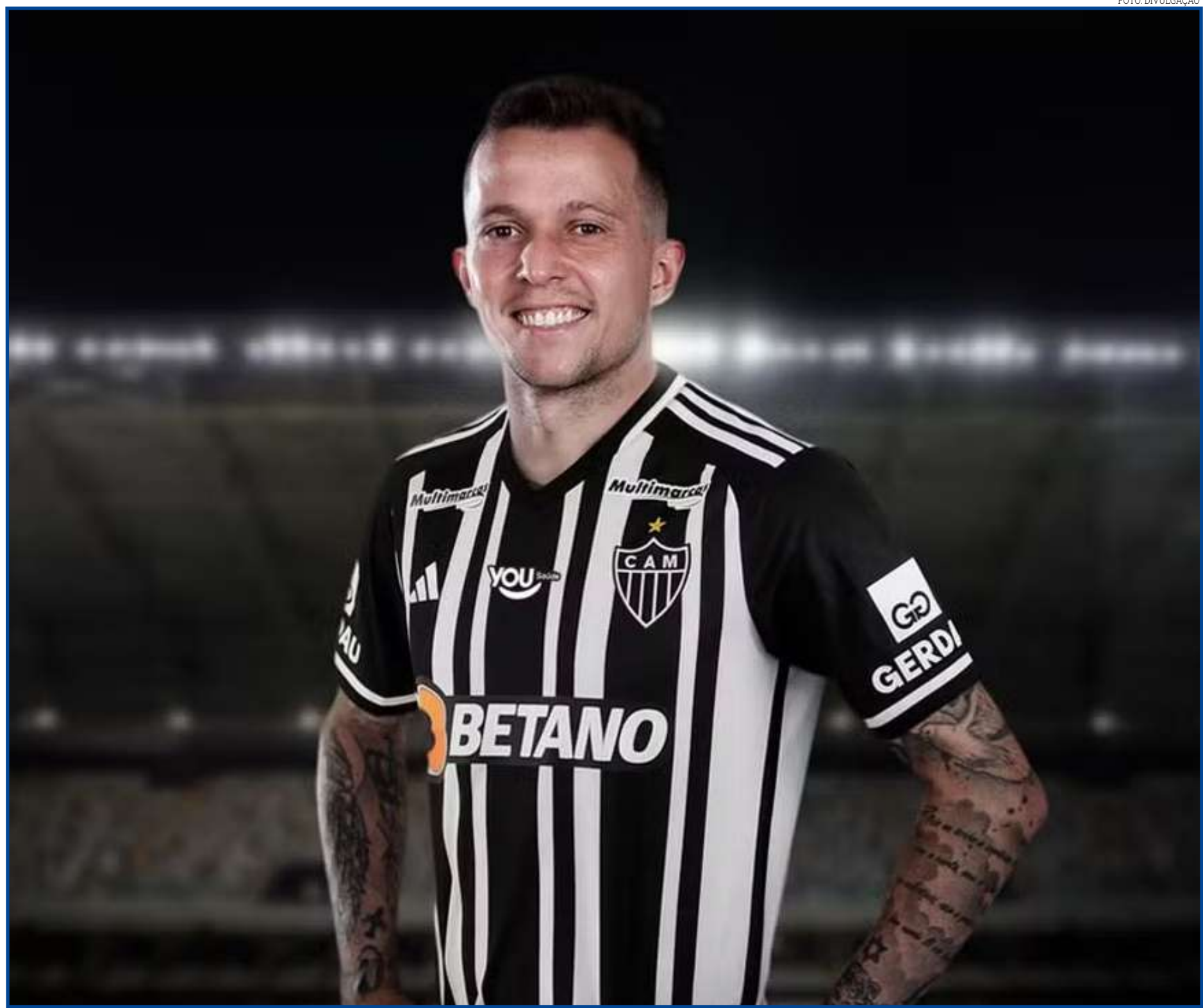
Jogador chegará em julho

"Tiveram vários clubes querendo conversar comigo. Clubes do Brasil e da Europa. Todos sabem o que foi decidido. Sem dúvida nenhuma, não vai faltar dedicação, mesmo com eu assinando com outra equipe. Quero sair daqui cam-