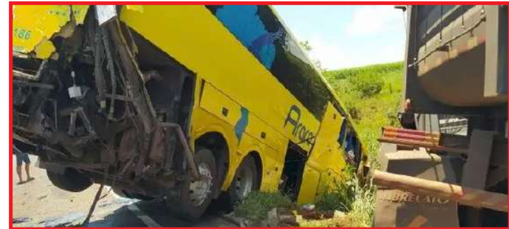
Acidente foi registro no trecho sul-mato-grossense da rodovia federal