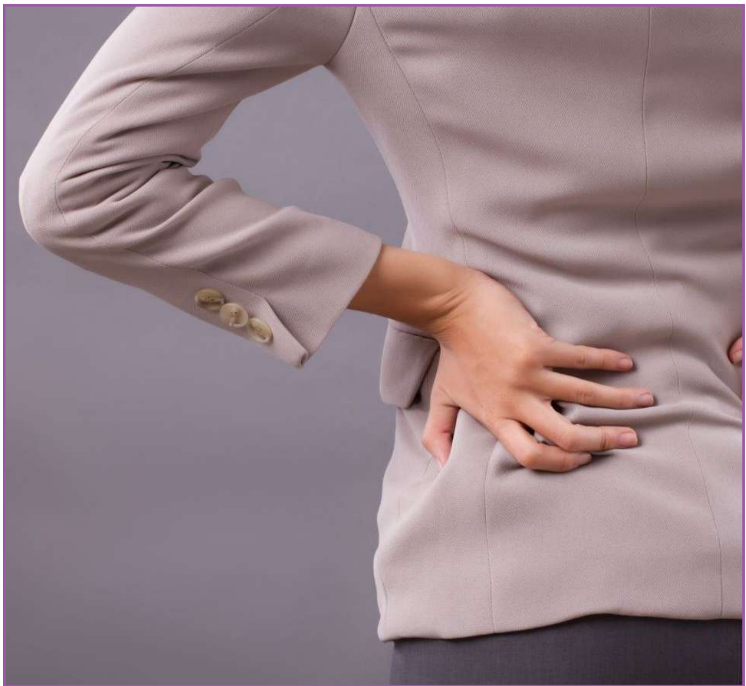
Hérnia de disco: nova vilã do mercado de trabalho em 2023

Para aqueles que trabalham com levantamento de cargas, o ideal é que tenha um treinamento prévio, com instruções sobre técnicas adequadas para levantar objetos pesados.