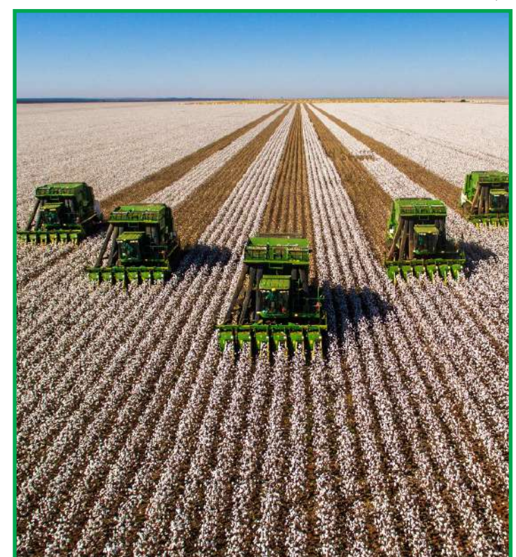
Soluções ajudam a melhorar as aplicações de insumos e até a economizar em uma cultura que tem alto custo