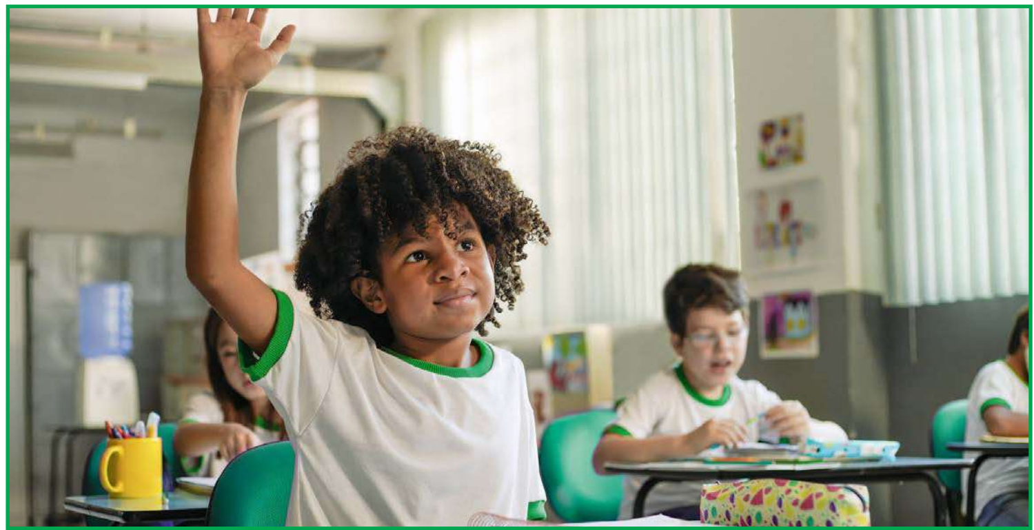
Programas A União Faz a Vida, Cooperativas Escolares e Jornada da Educação Financeira nas Escolas

Segundo estudo realizado pela Fundação em parceria com o Instituto para o Desenvolvimento do Investimento Social (IDIS), a cada R$ 1 investido no Programa, R$ 4,07 são devolvidos em forma de impacto positivo