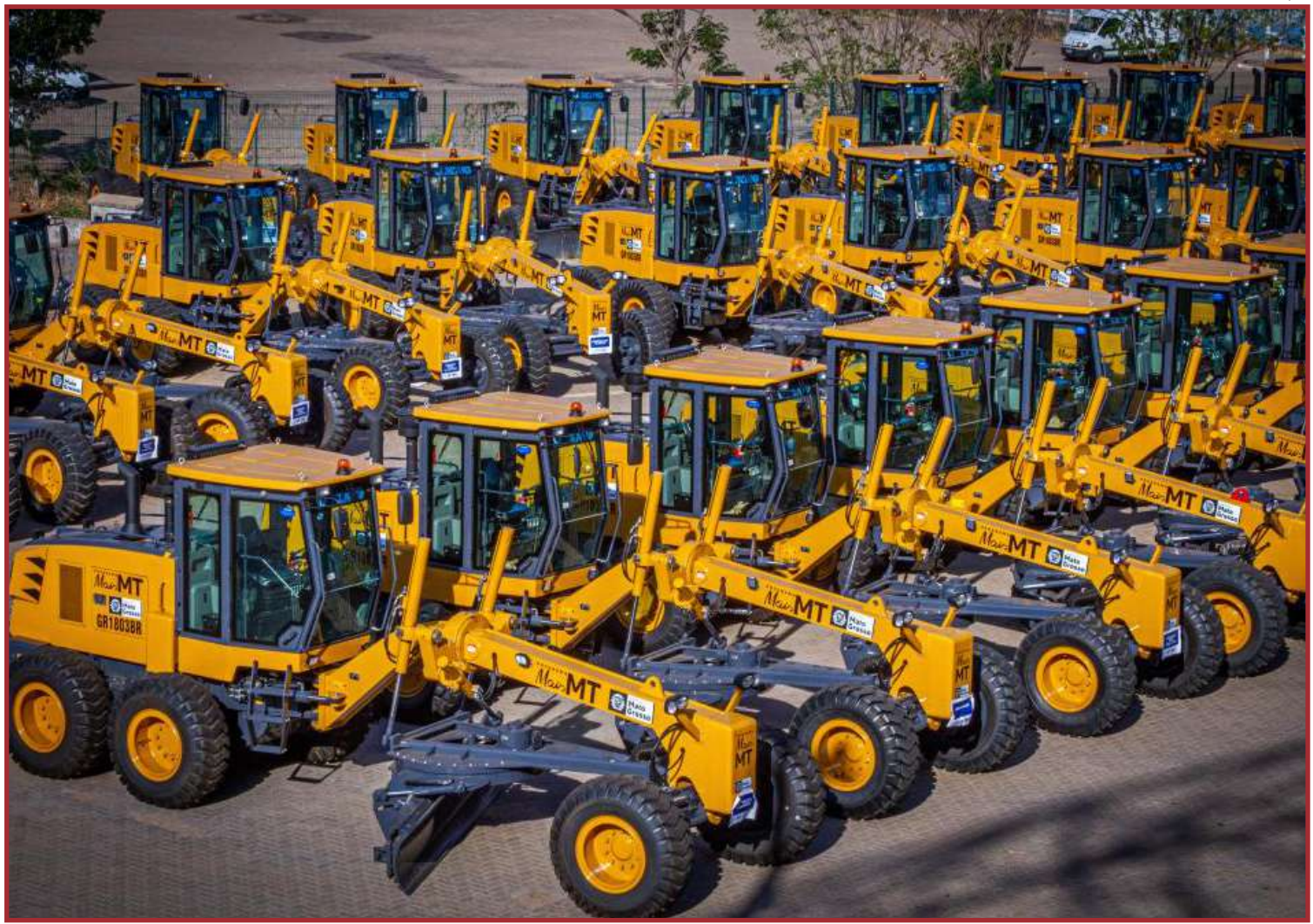
Maioria dos investimentos é em obras de infraestrutura, principalmente asfalto

"A grande diferença desse Governo é que ele consegue atender tanto os grandes municípios como os pequenos. Hoje eu tenho na minha cidade a pavimentação da MT-109 e estamos terminando de finalizar o projeto do anel viário da MT-412 e MT-109. Eu tenho um convênio assinado em fase de construção de 50 casas populares, eu tenho em execução calçadas dentro do nosso município. Assinamos, recentemente outro convênio de R$ 7,4 milhões para pavimentação as-