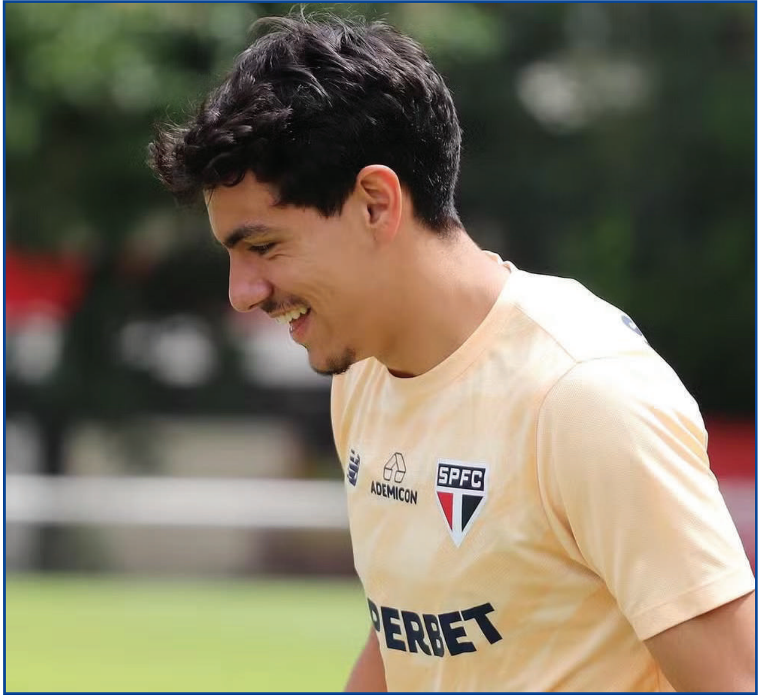
Moreira tem sido titular da lateral direita do SP

Para piorar, a situação do Tricolor na tabela de classificação não é mais tão confortável. O São Paulo, com um jogo a menos em relação aos adversários, tem 13 pontos, mas observado de perto por Novorizontino, São Bernardo e Botafogo-SP. O Tricolor ainda tem cinco partidas para disputar na fase de grupos do Campeonato Paulista. Apenas os dois primeiros de cada chave avançam para o mata-mata da competição.