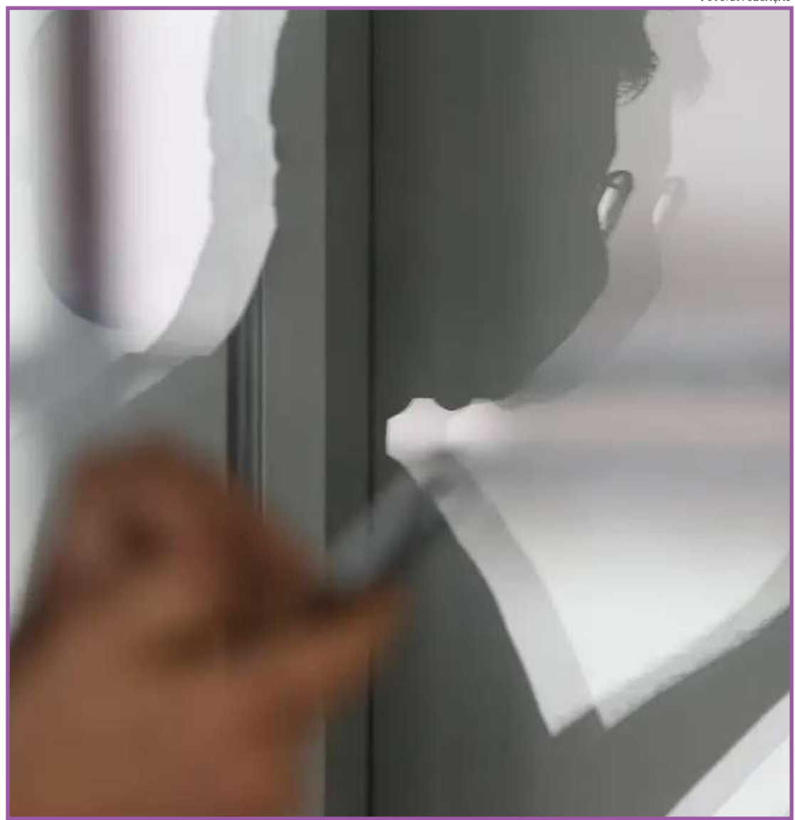
Tentativas de golpes são comuns... até demais

*Golpe do falso motoboy, do Whatsapp, do cartão por aproximação e, recentemente surgiu simulação via inteligência artificial, onde sua voz e imagem são clonadas, peça para os familiares ficarem atentos e fazerem perguntas pessoais. Nas situações diárias