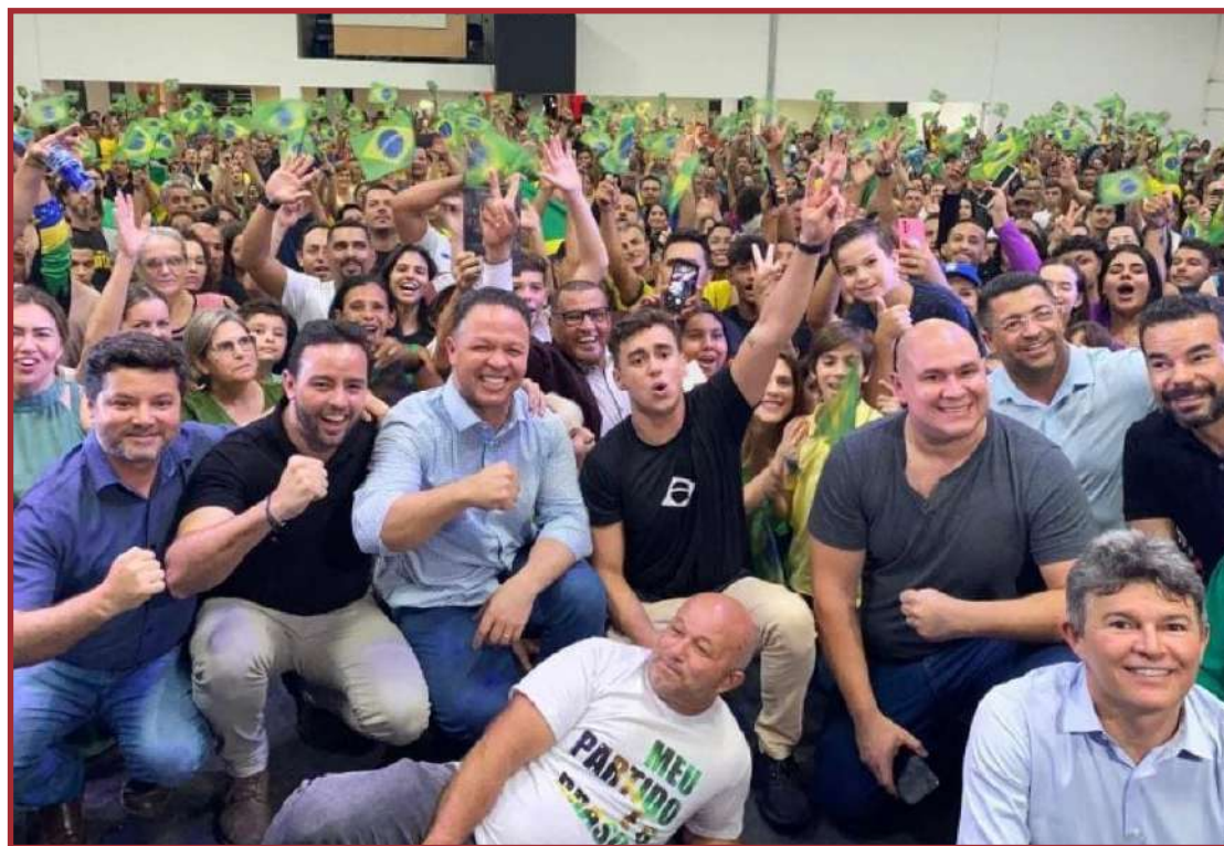
Deputados estaduais e federais E lideranças de Sinop mostrando apoio a Bolsonaro

O presidente do PL de Mato Grosso informou que o senador Wellington Fagundes não estará em São Paulo neste domingo, pois cumpre agenda fora do país, nos Estados Unidos.