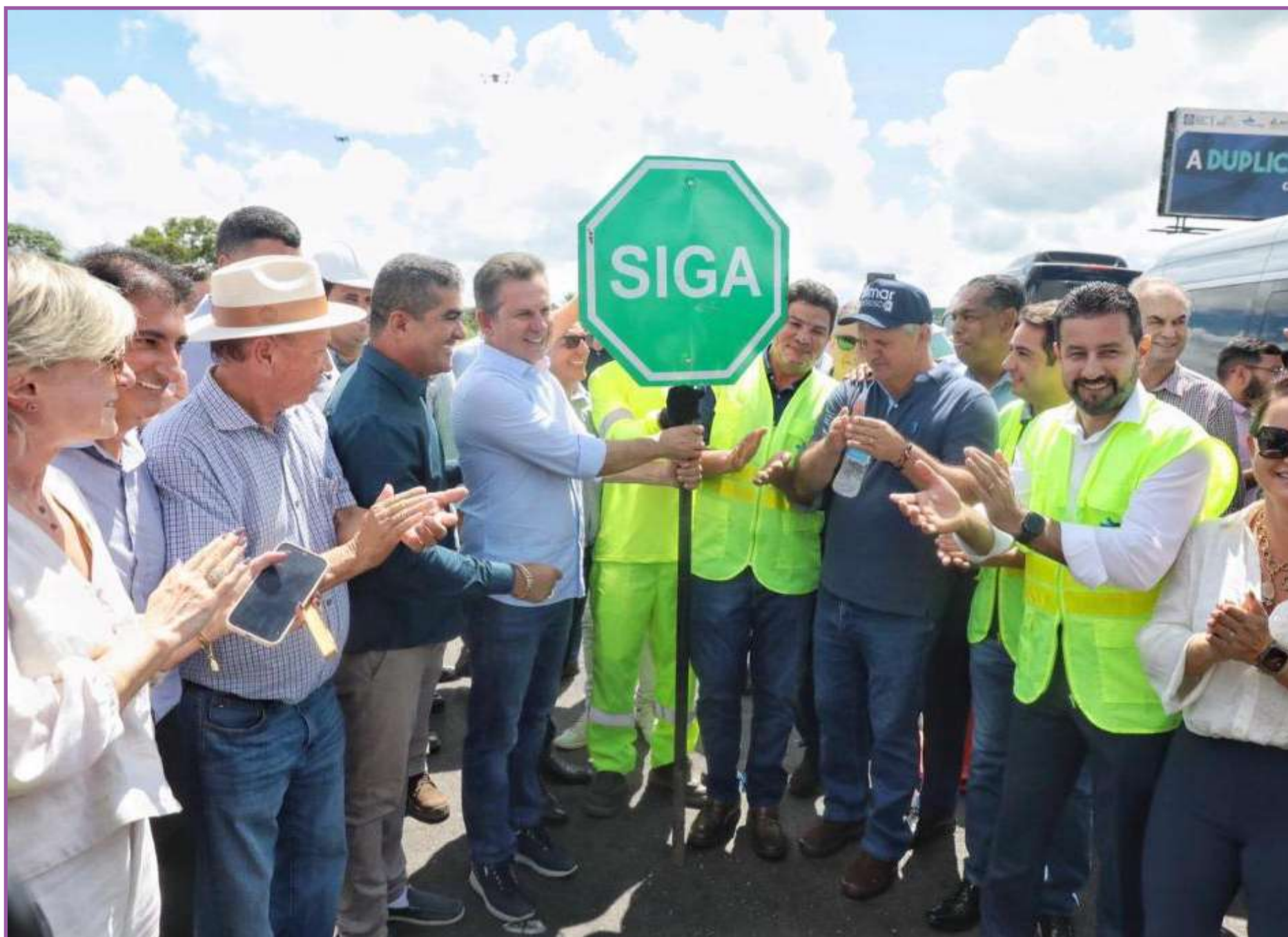
Mauro Mendes assinou ordem de serviço para duplicação da BR-163

Com a Prefeitura, o Governo também está construindo uma nova escola estadual e reformando as Escolas Municipais São