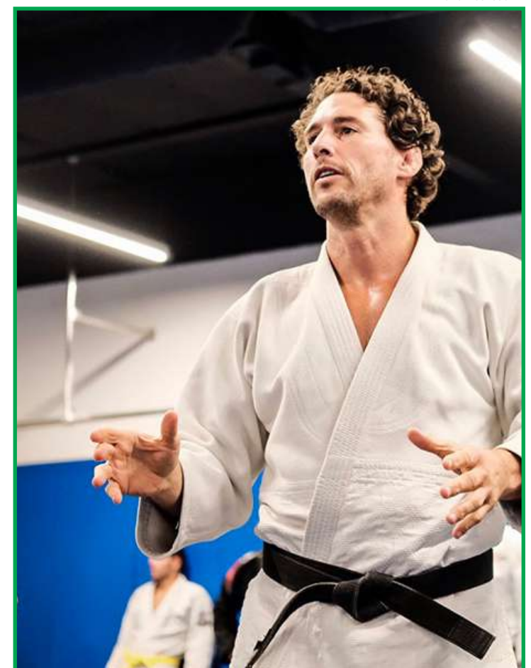
Ex-judoca estará em Sinop e Sorriso

será investigado e que sanções poderão ser aplicadas. A legislação prevê multa, suspensão ou até exclusão do sistema do Pix, dependendo da gravidade do caso.