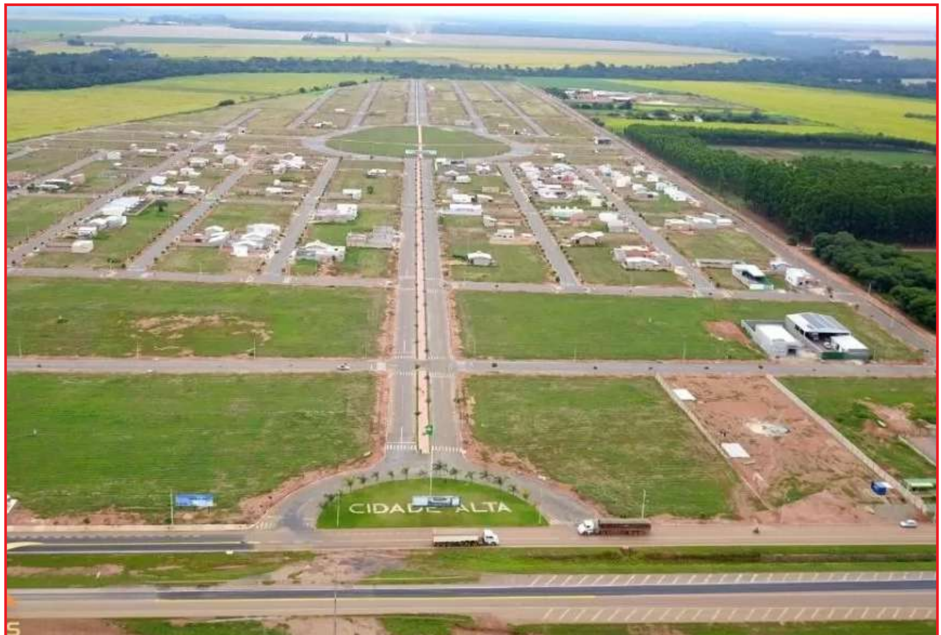
Mesmo depois de morar em tantos lugares, algumas pessoas escolhem construir a casa própria

Ter uma poupança e usar o dinheiro guardado. Financiamentos fornecidos por algumas empresas de loteamento. Consórcio, em que o comprador pode fazer uma poupança e ao mesmo tempo concorrer em um sorteio. Financiamento direto com bancos públicos