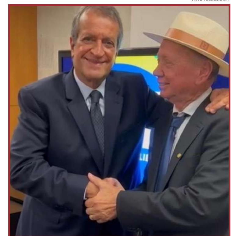
Dorner eliminou três concorrentes diretos com esta ação