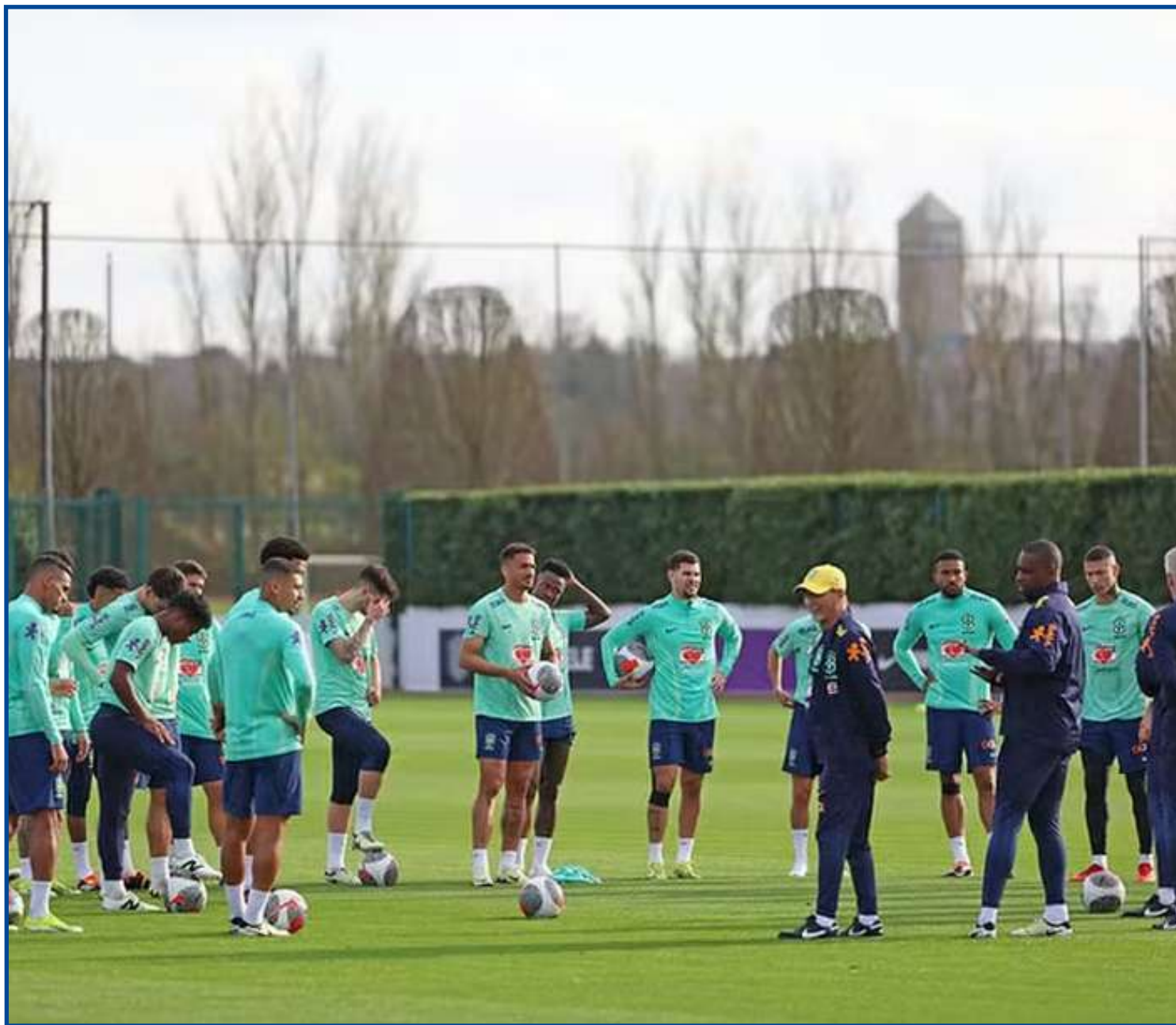
Dorival mantém mistério até mesmo com jogadores sobre quem começa jogando em Wembley