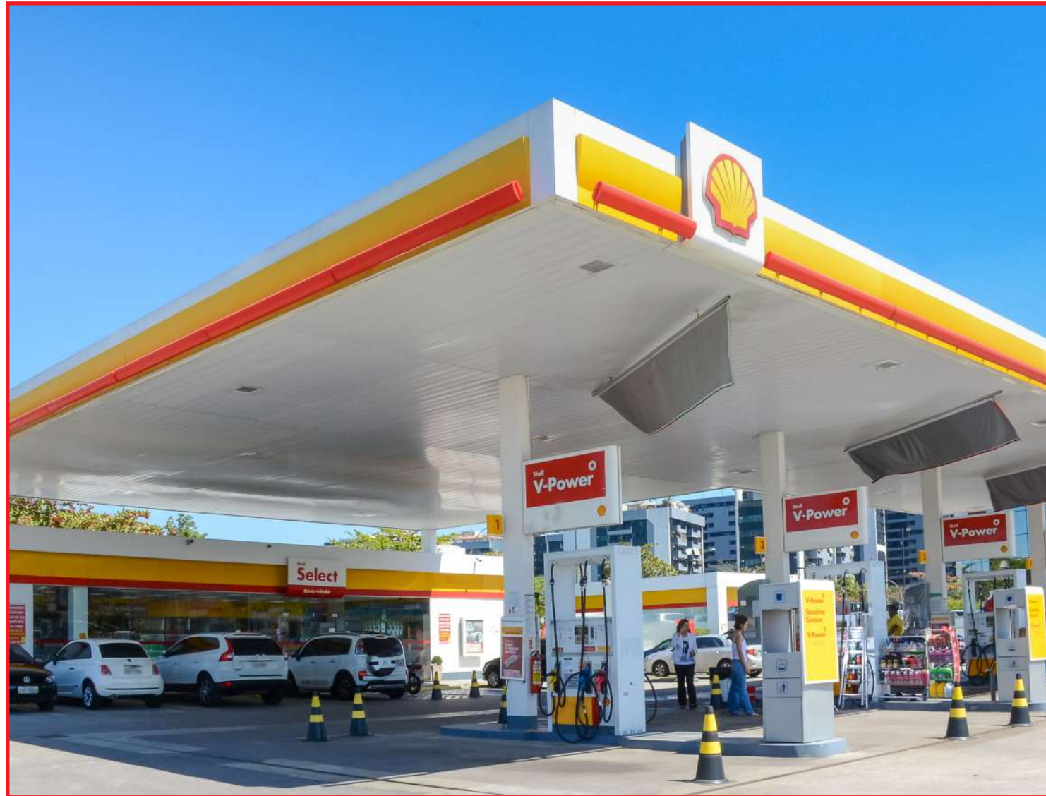
Parceria vai expandir negócios da companhia no Centro-Oeste e fortalecer a marca Shell