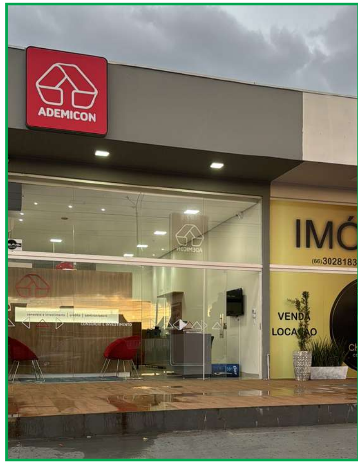
Unidade de Campo Verde: crescimento de 39% em créditos comercializados em 2024