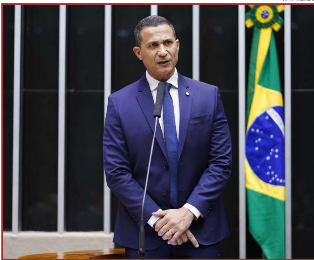
Objetivo do parlamentar é evitar fugas em todo país