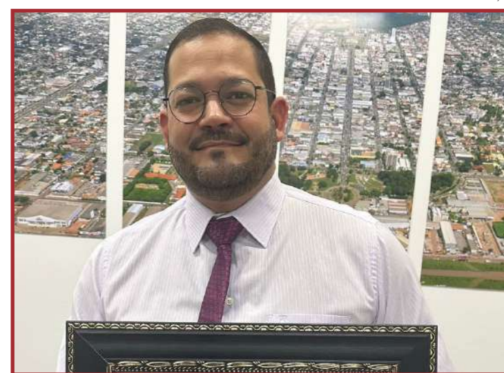
Pesquisa foi realizada pela Unity Pesquisas

O título é atribuído após uma pesquisa que envolveu 571 entrevistados, realizada via call center entre os dias 19 e 23 de fevereiro.