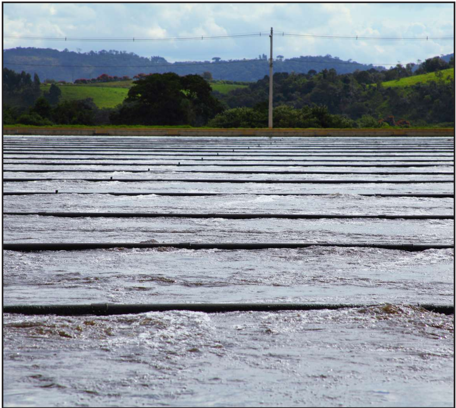
Tratamento visa a sustentabilidade hídrica

A exemplo disso, um trabalho conjunto iniciado em 1996, com a concessão do tratamento de esgoto à iniciativa privada em Jundiá, já resultou na melhoria significativa da qualidade do rio que leva o nome da cidade. Sob a gestão da DAE Jundiá, a Companhia Saneamento de Jundiá realiza o tratamento do esgoto, enquanto a Tera Ambiental encarrega-se de transformar o lodo, resultante desse processo, juntamente com outros resíduos orgânicos, em fertilizante orgânico composto. A cidade apresenta índices significativos em saneamento, acima da média nacional, com 99,65% das populações urbana e rural beneficiadas por redes de abastecimento de água e 98,81% conectadas às redes de esgoto. Além disso, 100% dos es-