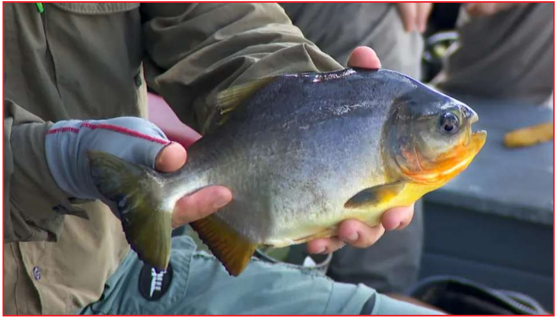
Peixes de água doce possuem uma grande concentração de Ômega 3 e nutrientes

a inclusão desses peixes na dieta pode ser benéfica até economicamente, já que, de acordo com a Associação Mato-grossense de Piscicultores (Aquamat), escolher a Tambatinga, por exemplo, pode resultar em uma economia de até 60%. Em comparação, o valor do filé de salmão atinge o valor de R$ 135 por quilo.