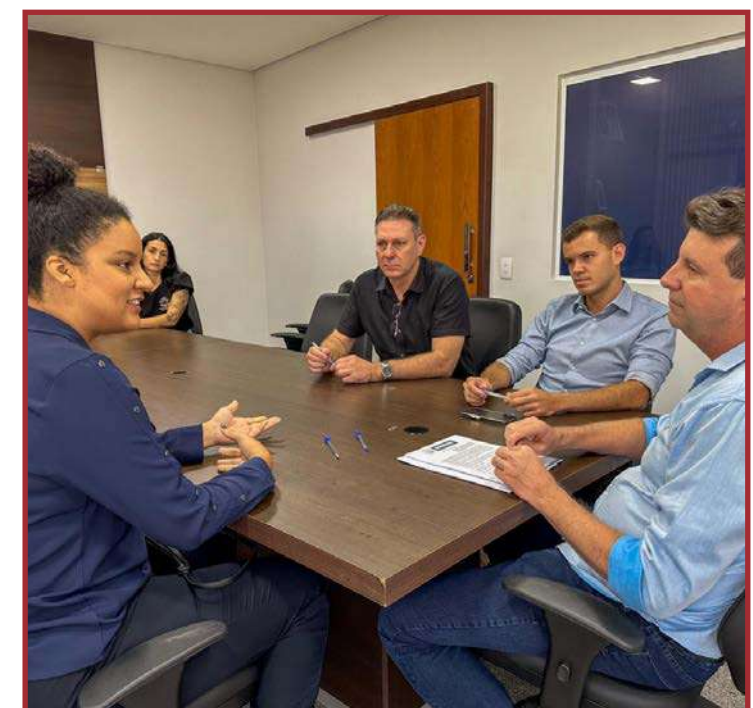
Recurso vai ajudar estudantes a "ir e vir" de Sinop todos os dias