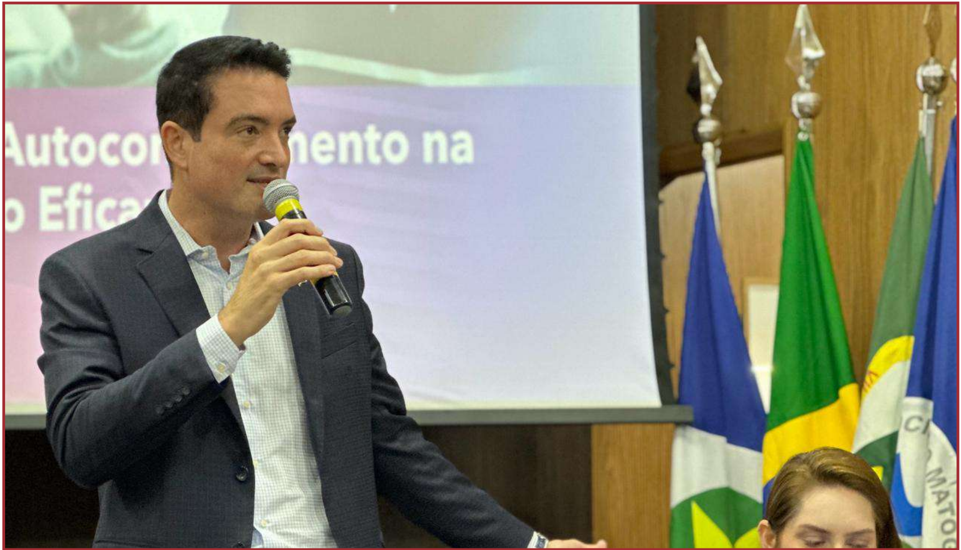
Assembleia aprova mudança de estatuto e redução de mandato de diretoria

A nova diretoria também colocou em votação e obteve aprovação a medida de que apenas prefeitos em mandato poderão votar nas eleições presidenciais da AMM, previstas para ocorrer em janeiro de 2027. Essa medida garante que apenas os gestores municipais atualmente empossados participem da escolha de seus representantes, reforçando a legitimidade e a representatividade das decisões tomadas.