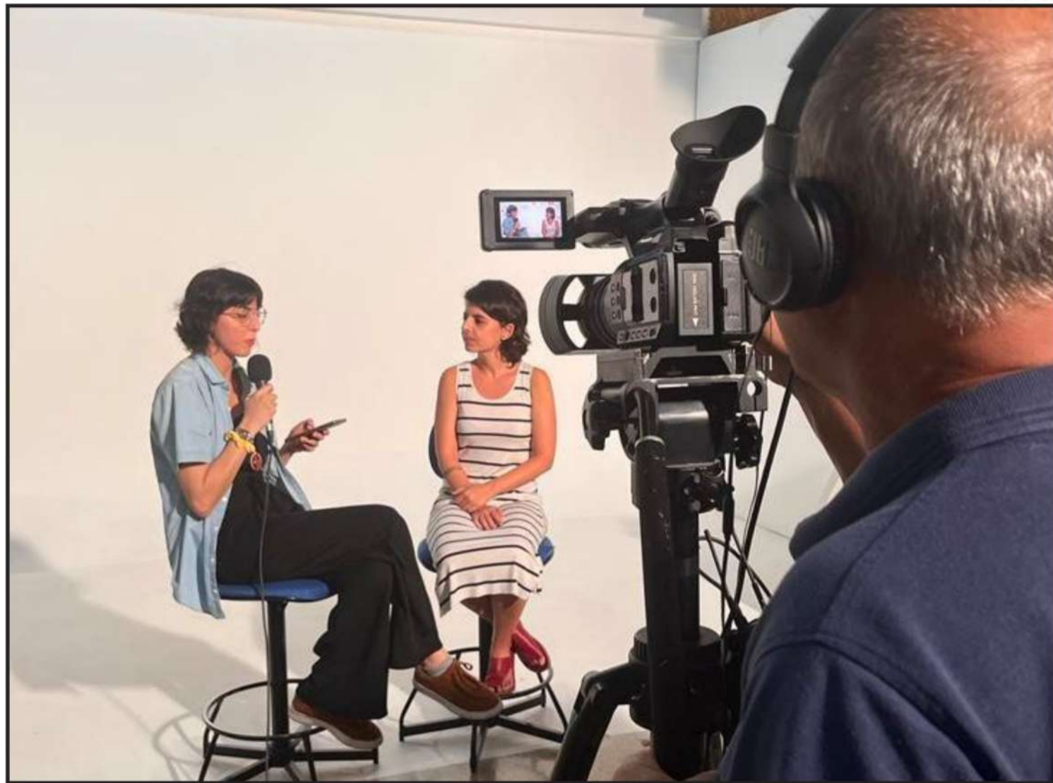
Neste domingo (7 de abril), Dia Nacional da e do Jornalista, saudamos a trajetória de luta

Por fim, entre as nossas prioridades, está a sustentabilidade da produção jornalística. Frente ao enfraquecimento do jornalismo, que a cada ano torna-se mais insustentável, a categoria