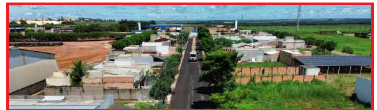
Trabalho continua na região pelos próximos 30 dias, e depois segue para outros pontos