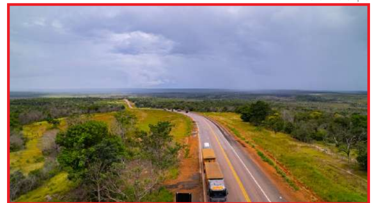
Confira a programação semanal de obras