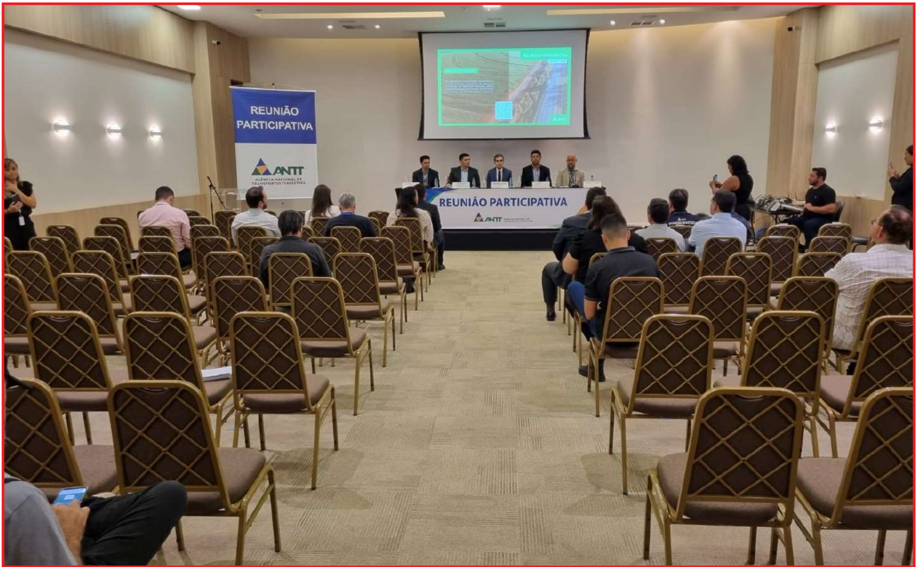
Reuniões presenciais foram bem esvaziadas