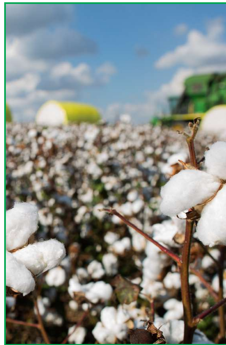
Cotton Day foca disseminação de informação e a apresentação de novidades