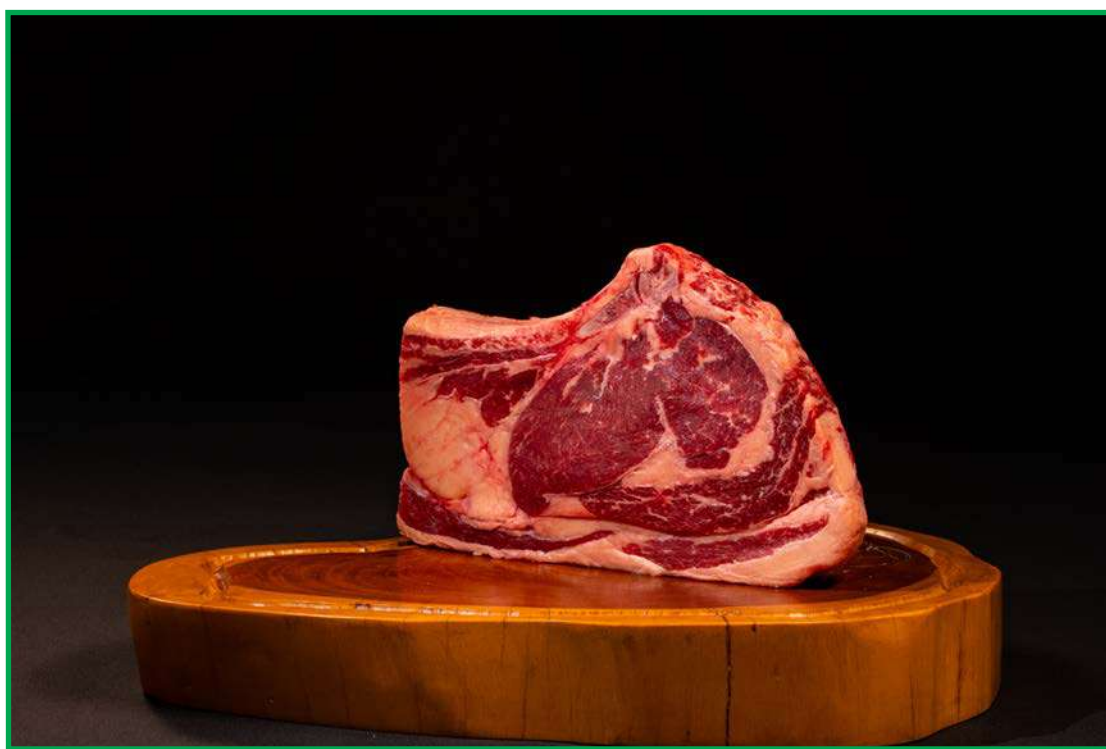
Frigorífico foi inaugurado nesta terça

cional, são deixados em jejum (24 horas), um processo necessário e importante no pós-abate, porém muito estressante e determinante para o resultado final, uma vez que os animais sofrem com o ambiente restrito dos currais de espera. Fatores que influenciam de