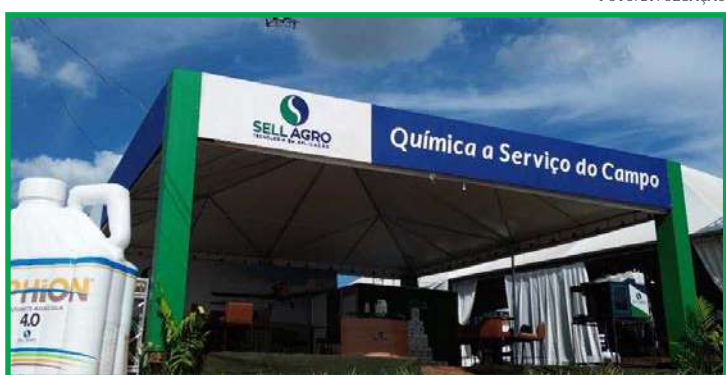
Sell Agro participa do evento

Na oportunidade, a Sell Agro pretende também reforçar que o uso adequado de adjuvantes pode diminuir significativamente a quantidade de agroquímicos na aplicação, promovendo