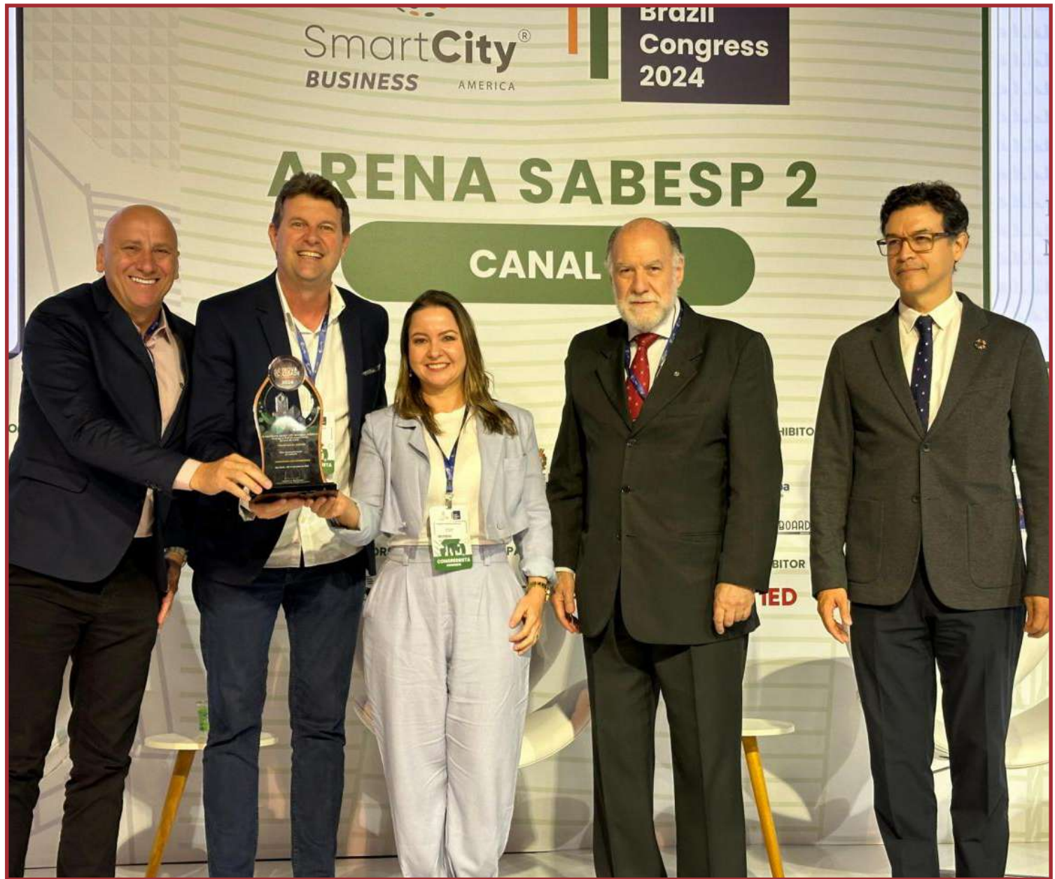
O Eco Sorriso e o Sorrímobi fizeram conquistar este ano o prêmio