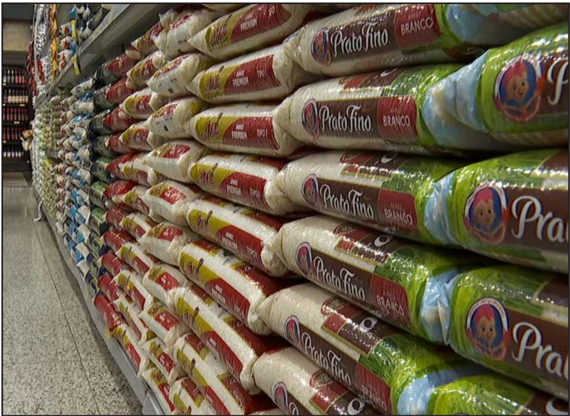
Nos supermercados de MT, o preço do pacote de arroz de 5 kg varia entre R$ 27 e R$ 30