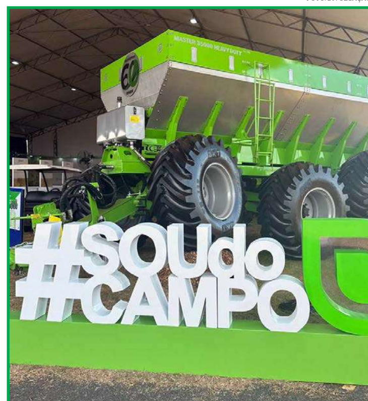
Equipamento foi apresentado em evento