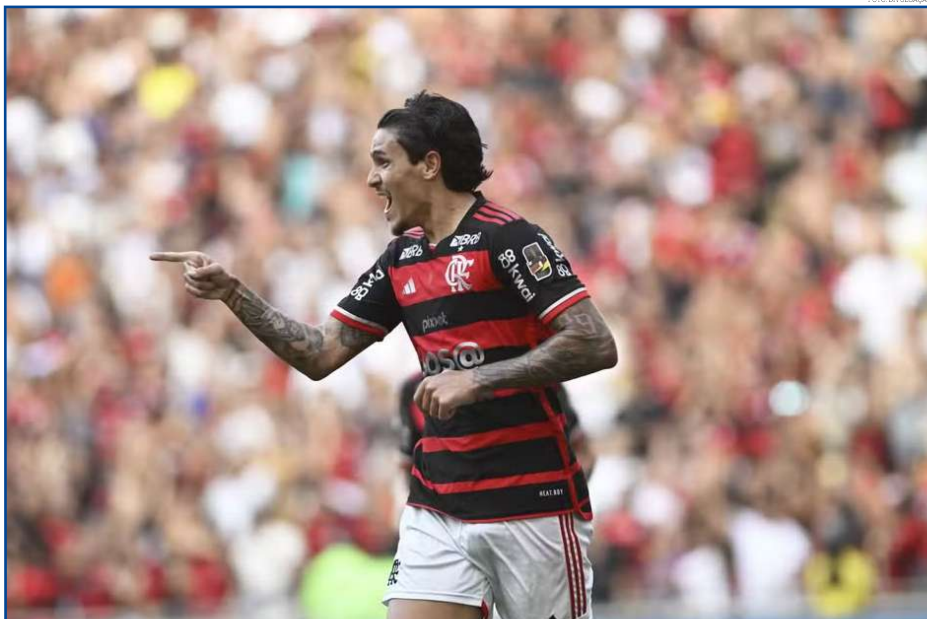
Pedro marcou na vitória sobre o Corinthians

"Cacá (zagueiro do Corinthians) estava conduzindo a bola para o meio, eu estava perto, já pressionei e consegui roubar bola. Aí o G pegou