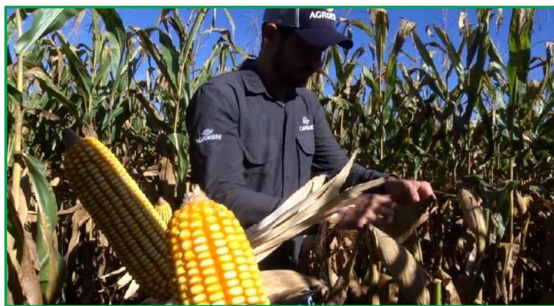
Expectativa no Brasil é que traga benefícios ao milho

O grupo, pontua o agricultor, está sempre em busca de inovação e focado em obter os máximos rendimentos. Nas últimas real safrinhas, conta ele, foram realizados mais investimentos em adubação e na escolha dos híbridos. "Procuramos posi-